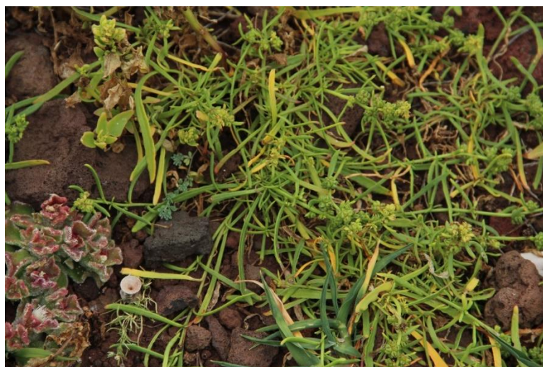
Figura 1. Beta patula . Foto tirada no ilhéu do Desembarcadouro, Ponta de São Lourenço.

delimitadas e sinalizadas, com reserva genética da Beta patula , dentro dos Sítios da Rede Natura 2000 das Ilhas Desertas (PTDES0001) e Ponta de São Lourenço (PTMAD0003).