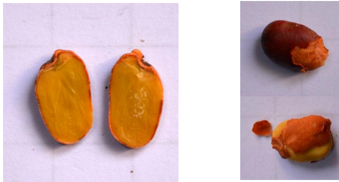
Gambar 3. Bagian dalam biji kayu kuku

Biji mirip kancing yang pinggirannya berlekuk. Ukuran biji kategori sedang dengan dimensi \pm 0,7 \times 1,6 \times 0,5 cm. Buah polong seberat satu kilogram dapat menghasilkan 320 gram biji, atau sebanyak 704 butir biji, sebanyak 15% tidak dapat dipilih untuk benih