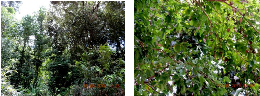
Gambar 1. Pohon kayu kuku sedang berbuah masak

Buah pohon kayu kuku tergolong buah kotak , mempunyai ruang biji atau kotak hingga empat ruang, yang paling umum, yaitu satu, dua dan tiga ruang biji, setiap ruang kotak hanya berisi satu biji. Morfologi buah bentuknya membulat pada pangkal dan meruncing pada ujungnya. Kulit buah terpecah jika masak, namun tidak terlepas dari tangkai buahnya. Warna buah ketika masak putih pucat atau kecokelatan . Kulit buah menebal dan keras pada pinggiran buah. Permukaannya bergelombang kecil, termasuk bentuk buah dehiscens . Kulit buah keras sehingga sulit dipecahkan, karena kulit buah mempunyai jaringan gabus yang tebal dalam membungkus biji. Bentuk buah masak serta biji pohon kayu kuku dapat dilihat pada Gambar 2.