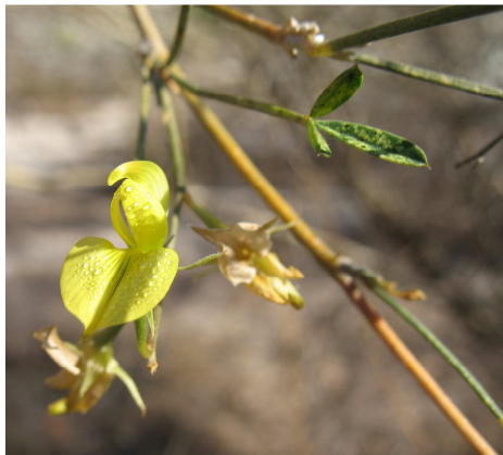
Crotalaria anomala (MANJAKAHERY Herisoa)