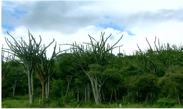
Bush xérophytique du Sud-Ouest