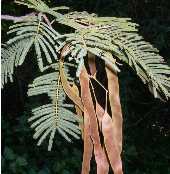
Albizia polyphylla (PHILLIPSON Peter B.)