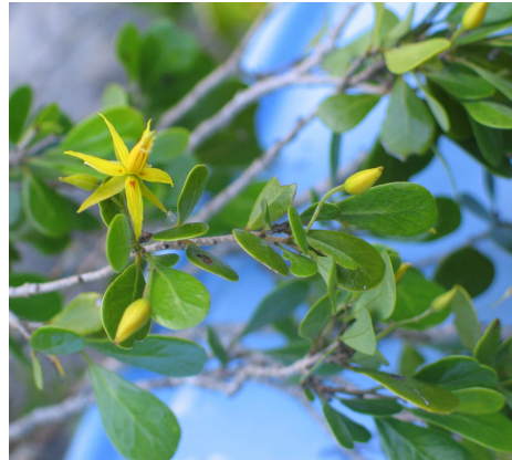
Baudouinia sollyaeformis (RATOVOSON Fidy)