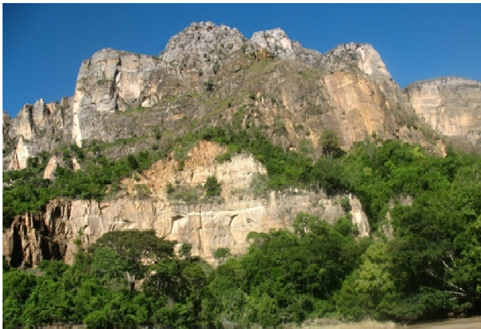
Forêt à Uapaca bojeri (Ambatofinandrahana)