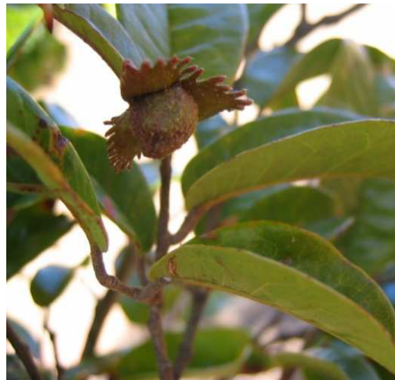
Schizolaena tampoketsana (Missouri Botanical Garden)