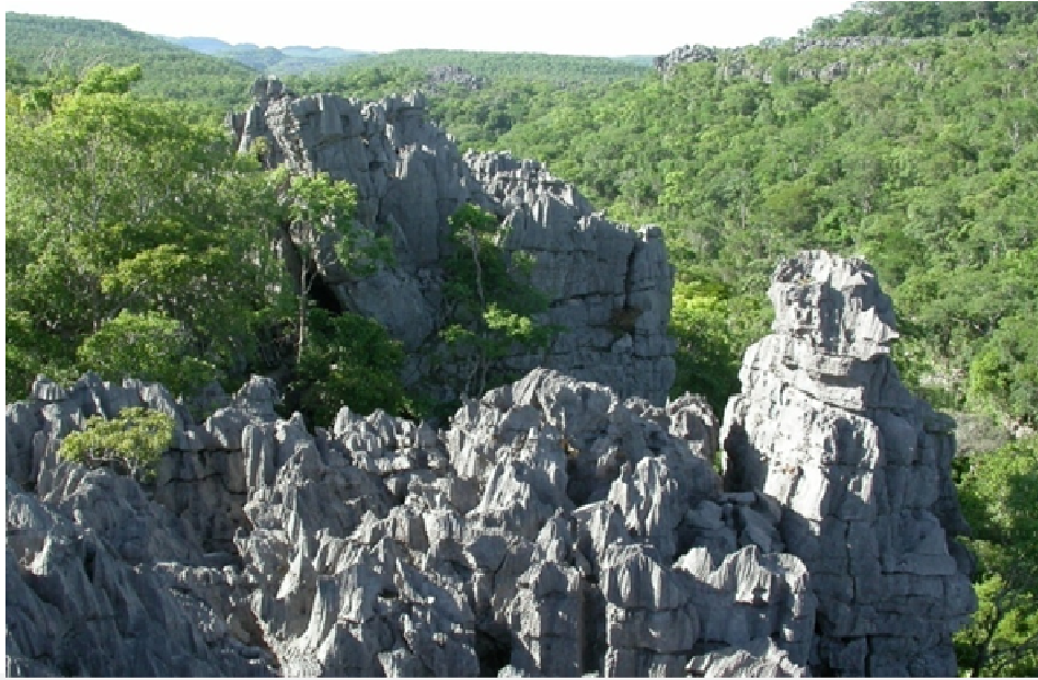
Forêt des reliefs karstiques (Tsingy Bemaraha)