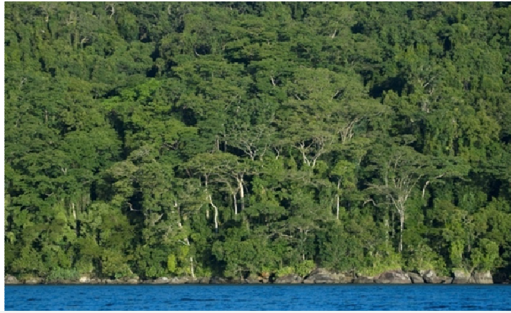
Forêt dense humide orientale (Masoala)