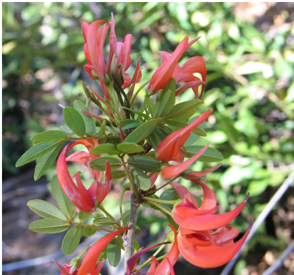
Chadsia salicina (RATOVOSON Fidy)