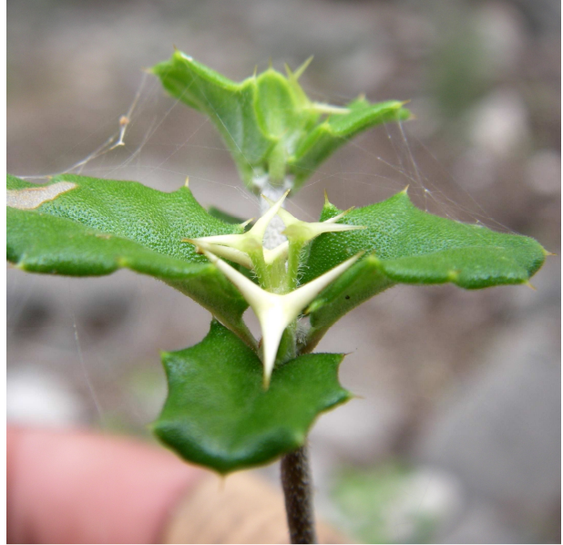
Barleria calcitrapa (RATOVOSON Fidy)