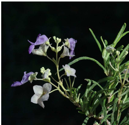
Capitanopsis angustifolia (PHILLIPSON Peter B.)