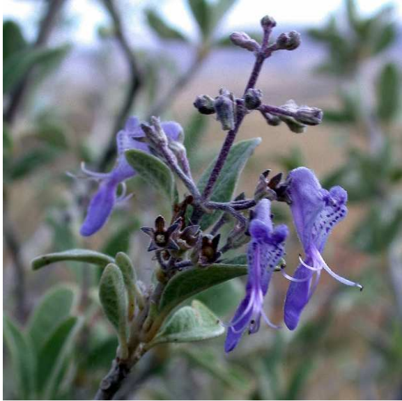
Capitanopsis albida (LOWRY Porter P)