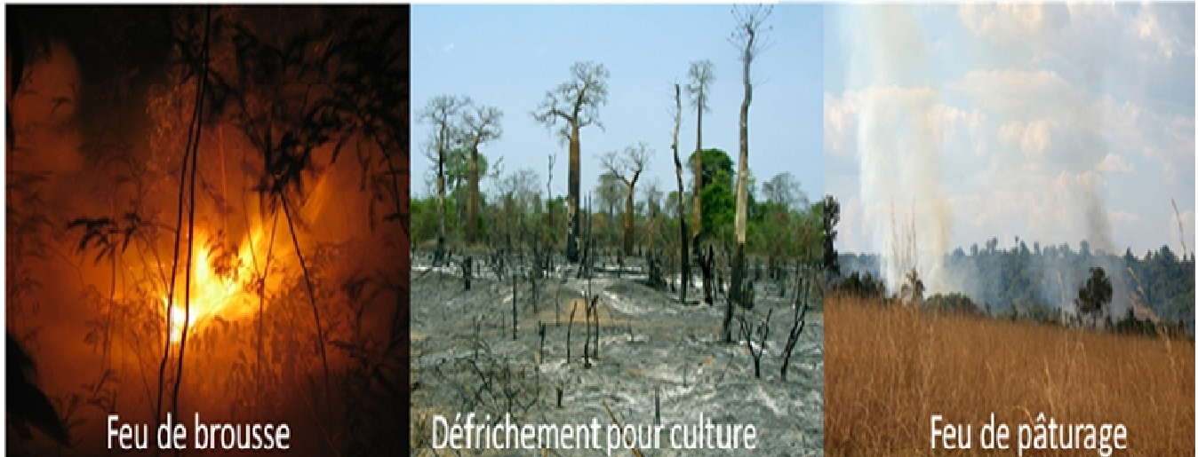
Défrichage pour l'agriculture

Face à ces menaces et pressions, des mesures alternatives ont été prises pour le besoin de protection et de conservation, comme la ratification par l'Etat malgache de nombreuses Conventions internationales (CDB 1 , CITES 2 , changement climatique, protocole de Kyoto) et leur mise en effectivité par les organismes compétents. Le Groupe (GSPM) travaille en étroite collaboration avec de nombreuses Institutions pour la remise à jour de la Liste Rouge de l'UICN et en partenariat également avec la CITES pour la catégorisation des espèces dans les Annexes de cette convention.