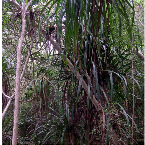
Pandanus perrieri (CALLMANDER Martin)