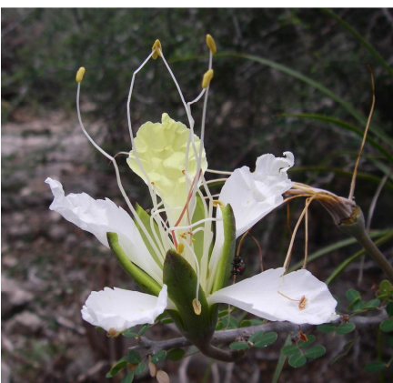
Lemuropisum edule (RATOVOSON Fidy)