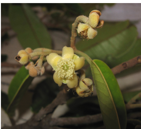
Schizolaena manomboensis (LOWRY Porter P)