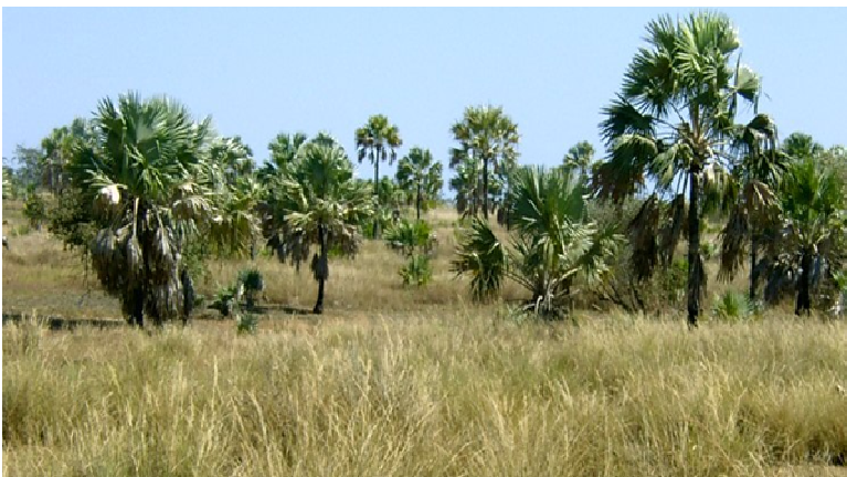
Savane arborée à Bismarckia nobilis (Antrema)

Ces écosystèmes naturels sont en grande partie détruits actuellement et ont fait place aux savanes et aux formations secondaires qui occupent d'immense surface.