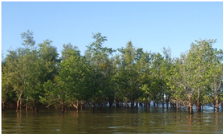
Mangroves (littoral Nord-ouest)

Ces écosystèmes naturels sont en grande partie détruits actuellement et ont fait place aux savanes et aux formations secondaires qui occupent d'immense surface.