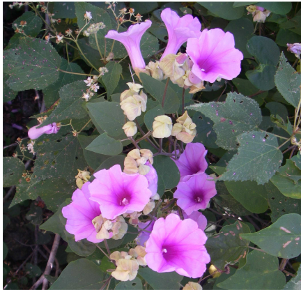
Argyreia onilahiensis (PHILLIPSON Peter B.)