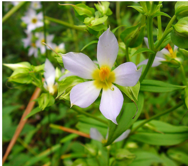
Exacum subteres (RAKOTOVAO Charles)