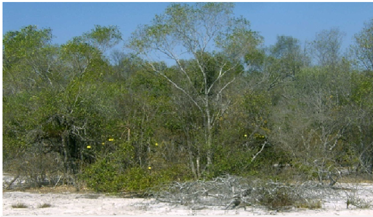
Forêt dense sèche occidentale (Antrema)