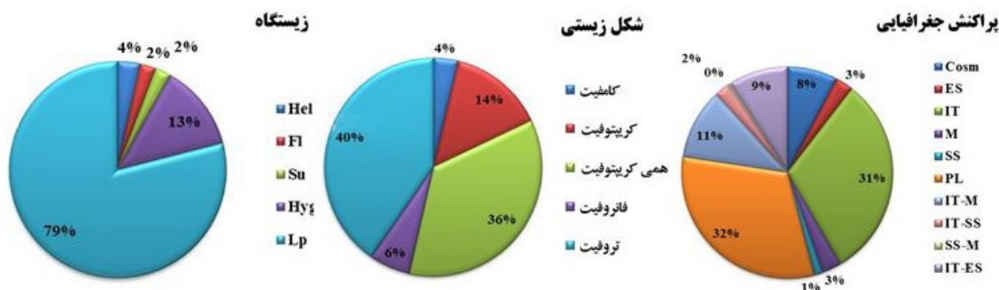
شکل ۲- نمودارهای وضعیت رویشی، شکل زیستی و پراکنش جغرافیایی گونه‌های گیاهی. Figure 2. Habitat, biological form and corology diagrams of plant species.

جدول ۲- فهرست گونه‌های گیاهی شناسایی شده در رویشگاه‌های آبی استان کرمانشاه. علائم اختصاری وضعیت رویشی: Hel= برآمده از آب، Hyd= آبی (Life form): Cha= کامفیت، Cr= کریپتوفیت، Fl= شناور، Su= غوطه‌ور، Hyg= رطوبت‌پسند، Land plant (LP)= گیاهان خشکی؛ شکل‌های زیستی (Life form): Cha= کامفیت، Cr= کریپتوفیت، Hem= همی کریپتوفیت، Pha= فانروفیت، Thr= تروفیت، پراکنش جغرافیایی (Chorotype): Cosm= جهانی وطنی، ES= اروپا-سیبری، Hyr= هیرکانی، IT= ایرانی-تورانی، Z= زاگرسی، M= مدیترانه‌ای، PL= چند ناحیه‌ای، SS= صحاراسندی.