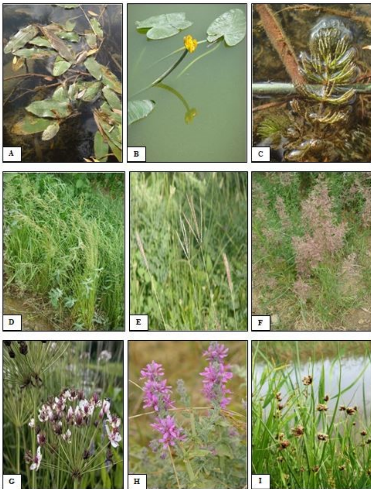
شکل ۳- تصاویر ۹ گونه گیاهی حاضر در رویشگاه‌های مورد بررسی.

Figure 3. Photographs of nine plant species in the studied habitats, A. Potamogeton nodosus . B. Nuphar lutea . C. Ceratophyllum demersum . D. Catabrosa aquatic . E. Bothriochloa ischaemum . F. Calamogasteris pseudo . G. Butomus umbellatus . H. Lythrum salicaria . I. Bolboschoenus maritimus .