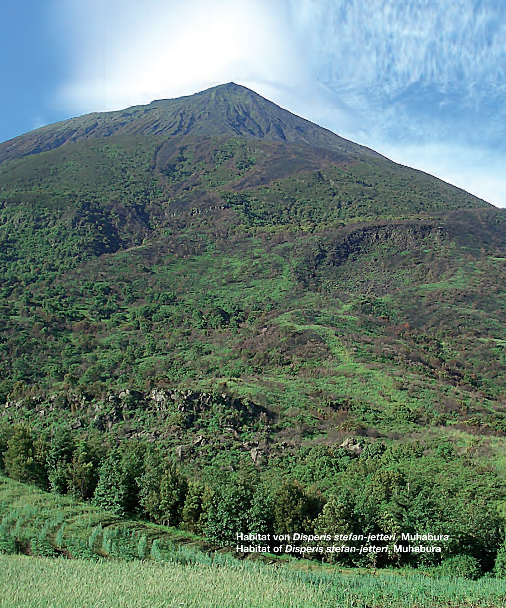
Habitat von Disperis stefan-jetteri , Muhabura Habitat of Disperis stefan-jetteri , Muhabura