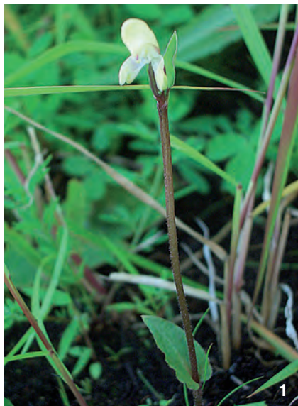
1. Disperis stefan-jetteri , Habitus Disperis stefan-jetteri , habit