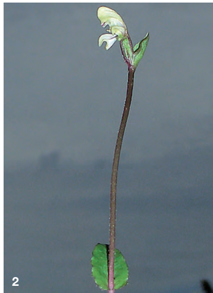
2. Disperis stefan-jetteri , Detail, Habitus Disperis stefan-jetteri , detail of habit

Zusammenfassung: Die neue Art Disperis stefan-jetteri aus Ruanda (Vulkan-Nationalpark) wird beschrieben. Die Art ist mit Disperis macowanii verwandt, unterscheidet sich aber durch die Form und Größe des Lippenappendix, der 2-gelappt und nur an der Spitze papillös ist.