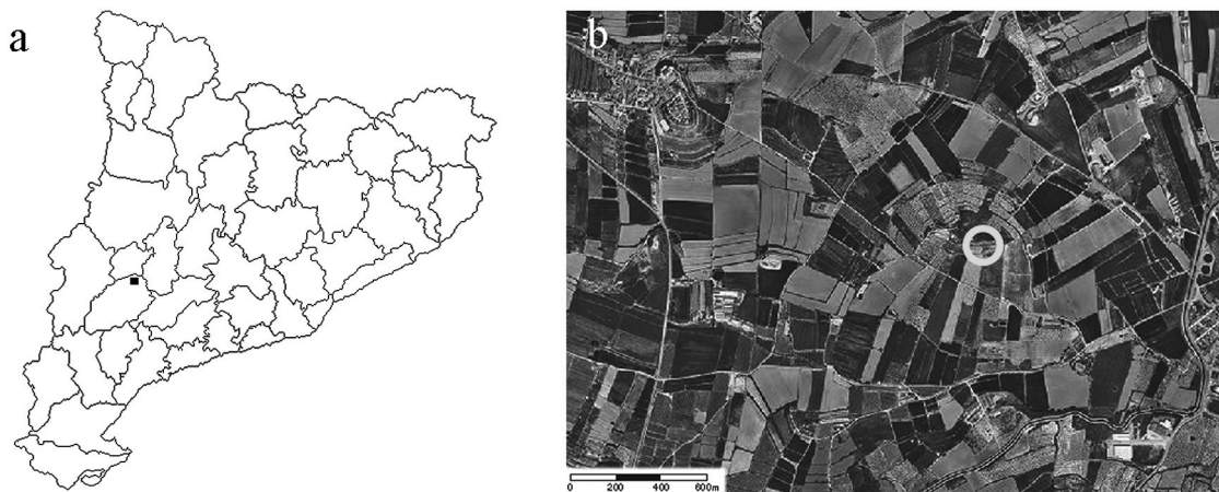
Figura 1. a) Localització de la zona de mostreig a la comarca de les Garrigues. b) Ubicació del Tossal Gros (cercle) entre els conreus de la plana.

de la zona. L'objectiu d'aquest estudi és aportar noves dades a la biota líquènica del territori sicòric i ampliar en la mesura del possible el coneixement de la diversitat líquènica de Catalunya i la seva distribució en el territori.