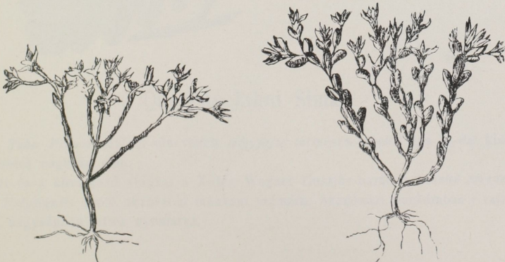
b) Sedum deserti-hungarici Simk., természetes nagyságban.

Jegyzet. E két rajzot czeruzával Wagner János, tollal Úrhegyi Alajos rajzolta.