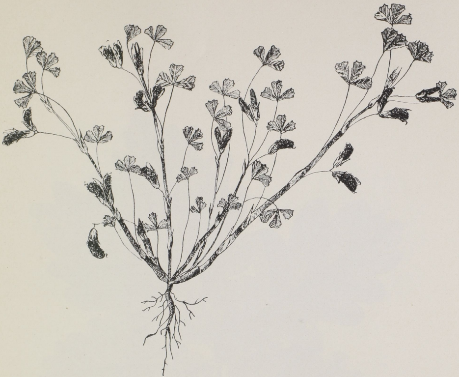
a) Trifolium perpusillum Simk., természetes nagyságban.