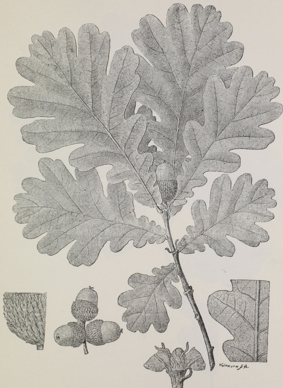
Quercus Haynaldiana Simk.