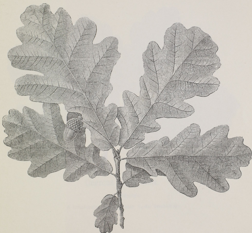
Quercus Dévensis Simk.