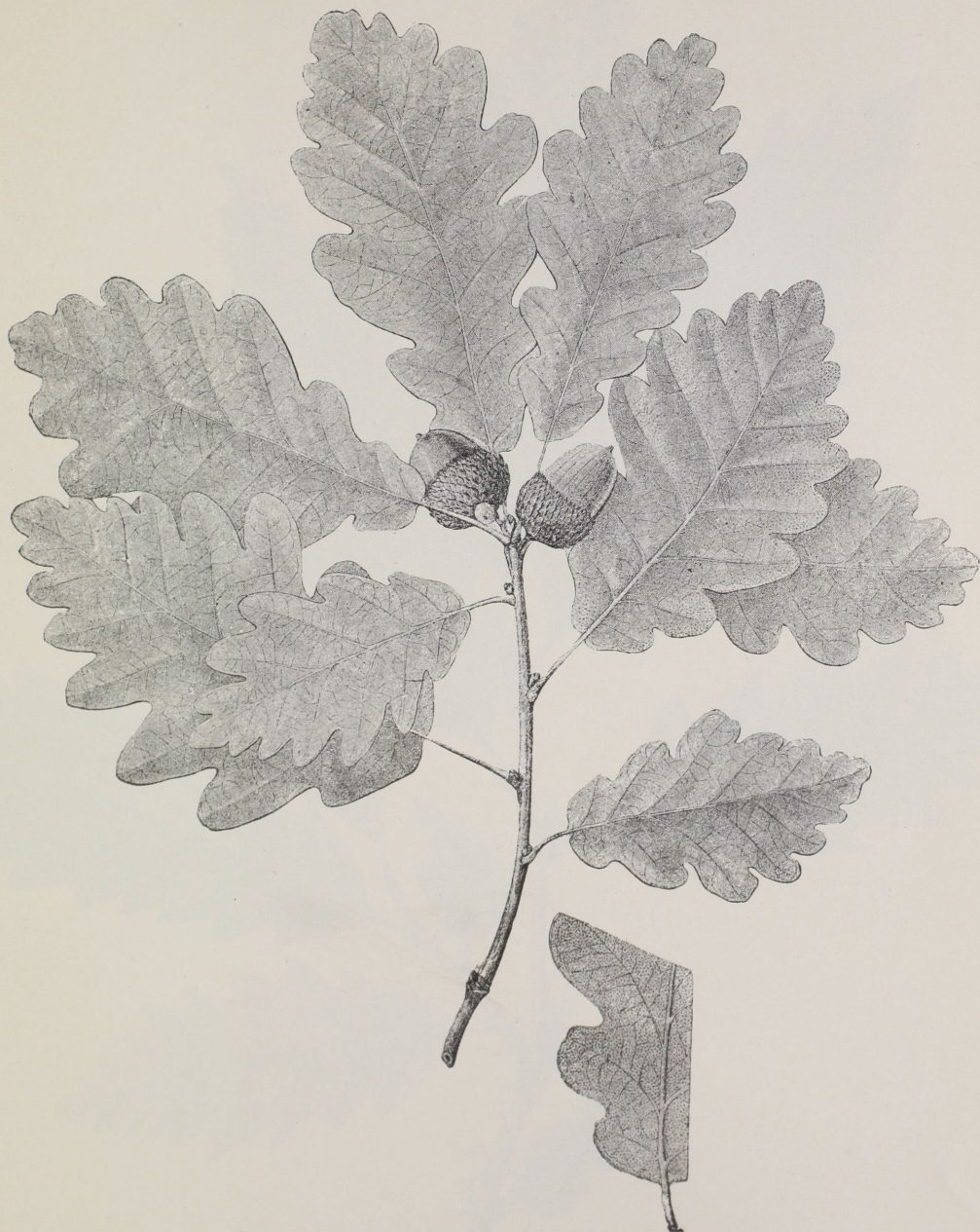
Quercus Tabajdiana Simk.