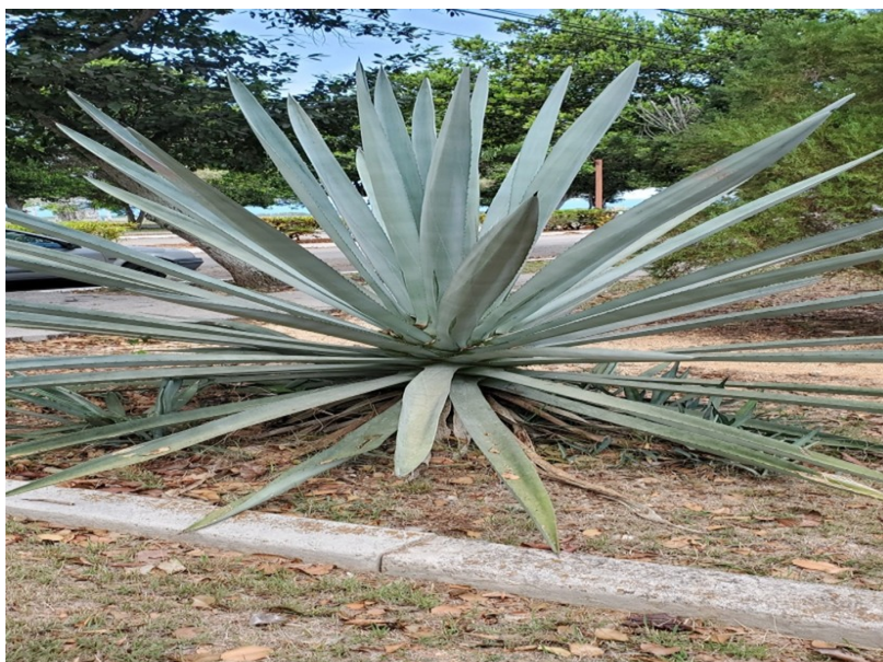
Figura 3. Agave fourcroydes . Marzo, 2023.

En el área didáctica del Jardín Botánico de Matanzas existen ejemplares de la misma, según aparecen en la Figura 3.