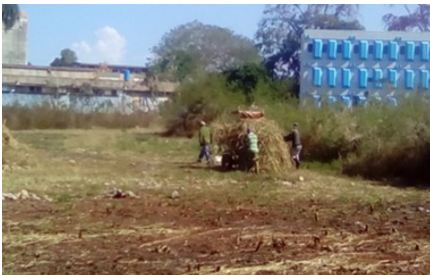
Figura 9. Trabajo productivo en el área del Agavetum. Febrero, 2023