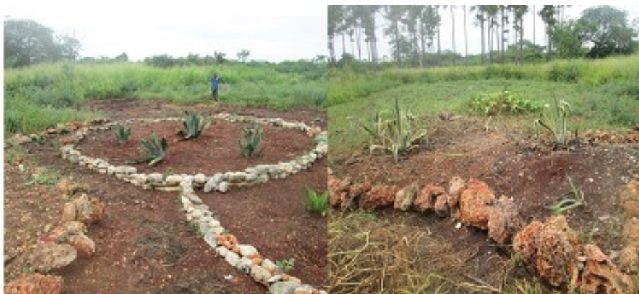
Figura 10. Inicio de la construcción del Agavetum. Mayo, 2023.

Trabajan en el área obreros, especialistas y técnicos, con el objetivo de realizar una preparación del terreno acorde a los requerimientos del Agavetum, donde se comenzó la siembra de las primeras unidades reproductivas. Figuras 9 y 10.