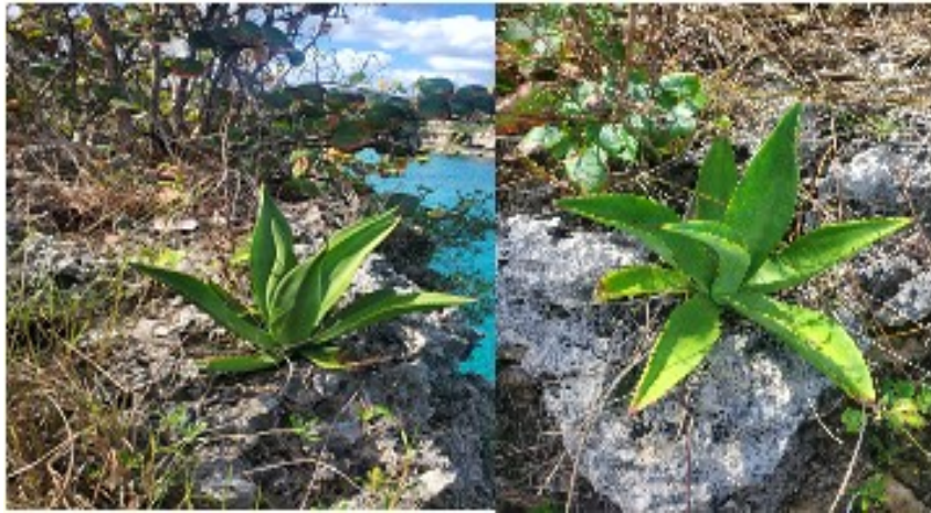
Figura 7. Agave offoyana , sobre rocas costeras del norte de Matanzas. (Desde Cava Roca hasta la playa El mamey). Fotos: Yasiel Hernández Rivero. Febrero, 2023.

Como parte de las acciones para la construcción del Agavetum en el JBM, se realizó visitas de observación de ejemplares de agave en las zonas costeras de Matanzas, donde se apreció la ecología y morfología de los mismos por los investigadores. Figuras 7 y 8.