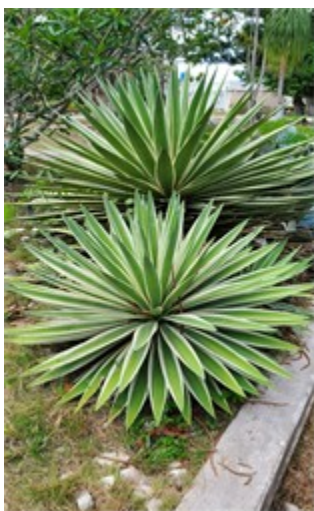
Figura 4. Agave angustifolia . Foto Yasiel Hernández Rivero. Marzo 2023.

Las flores crecen sobre un eje (quiote) ramificado, laxo, de hasta 4 m de alto, fértil a partir de la mitad o del tercio superior, tiene 9 a 15 ramas primarias de 35 cm de largo. Las flores miden de 4 a 8 cm de largo, son tubulares, verde parduzcas a verde amarillentas. Tiene gran variación a lo largo de su distribución. Las formas del Norte (Sonora-Chihuahua-Sinaloa) son más grandes con respecto a las de Guerrero-Puebla-Oaxaca y además florecen en épocas diferentes. En el norte florece en invierno de diciembre a marzo y en el sur en el verano de junio a agosto (Mendoza y Martínez 2018).