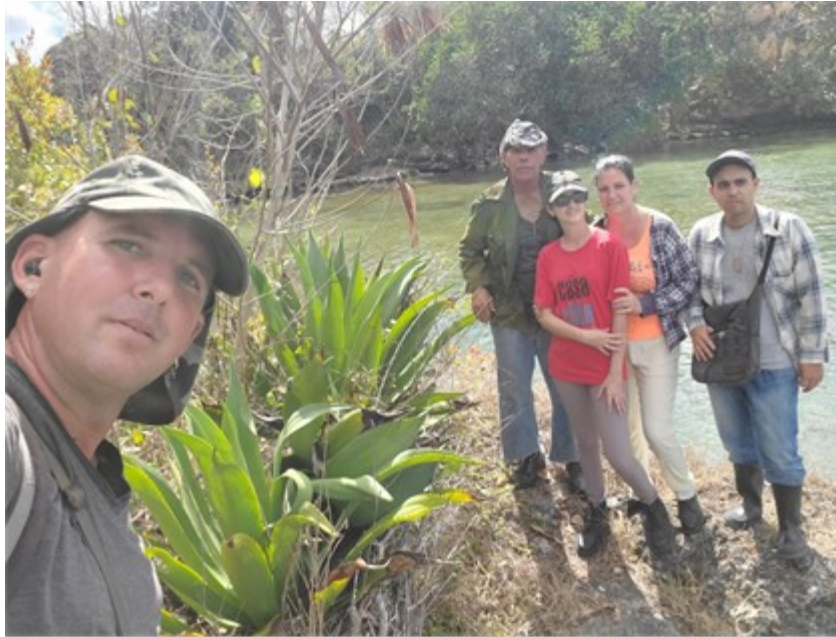
Figura 8. Investigadores en visita a área natural. Febrero, 2023.