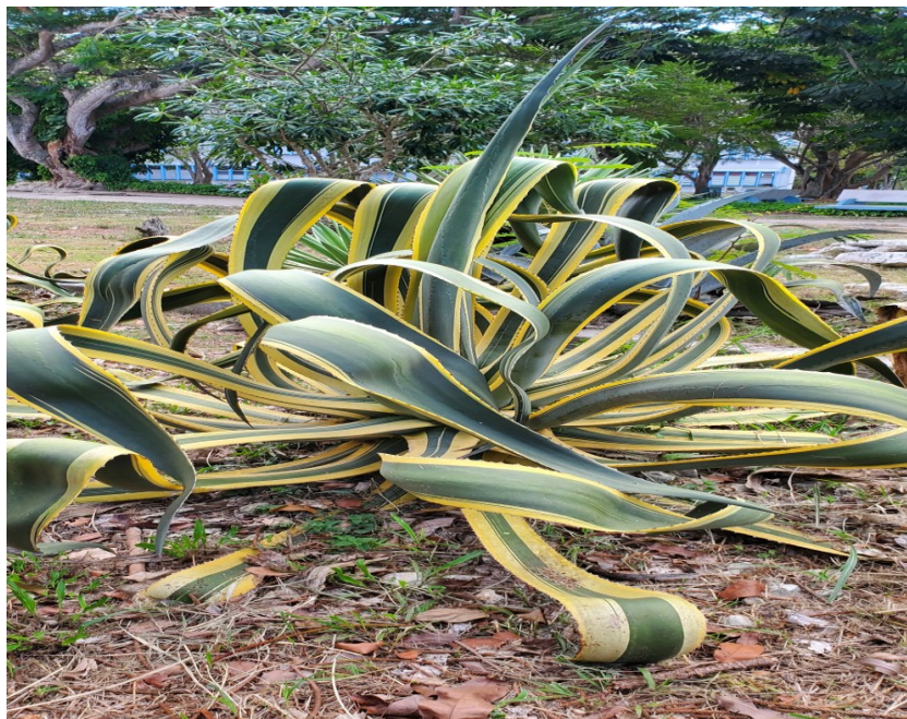
Figura 2. Agave americana . Marzo, 2023.

En el área de suculentas del JBM, existen 5 ejemplares de la especie.