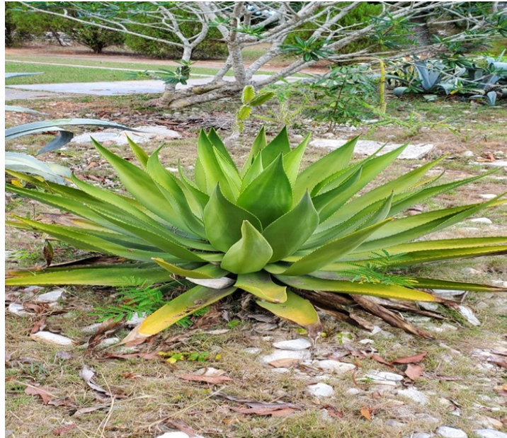
Figura 5. Agave offoyana . Marzo, 2023.

Son robustos, acaules, hojas lanceoladas, de 1-2 m y de 20 a 30 cm de ancho. Espina terminal de 4-5 mm. Flores de 7-8 cm anaranjadas en panículas amplias. Frutos en cápsula estrechamente oblonga. Semillas de 7 mm.