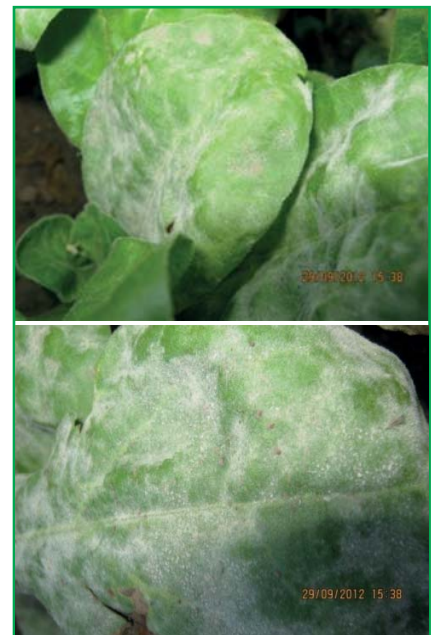
Листя Calendula , уражене Sphaerotheca fuliginea Poll. f. calendulae Jacz.

Фузаріозне в'янення ( Fusarium oxysporum Schlecht.) виявлено на