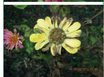
На рослинах Zinnia змішана інфекція Alternaria zinnia Pappe., Cercospora zinnia Ell. et Mart., Erysiphe cichoracearum .

Sacc.) виявлено на 5-ти видах однорічних квітково-декоративних рослин: Antirrhinum , Calendula , Salvia , Tropaeolum , Zinnia .