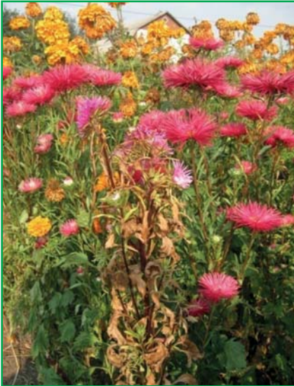
Рослини Callistephus, уражені Fusarium oxysporum Schlecht.

thora infestans , Phytophthora cryptogea Pethyb. Et Laff., Phytophthora castorum Schroet.) мали незначне поширення на видах однорічних квітково-декоративних рослин.