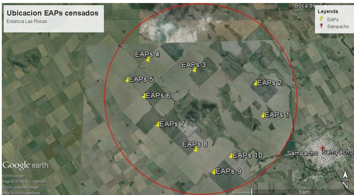
Figura 4: Ubicación Geográfica de cada EAP relevado.