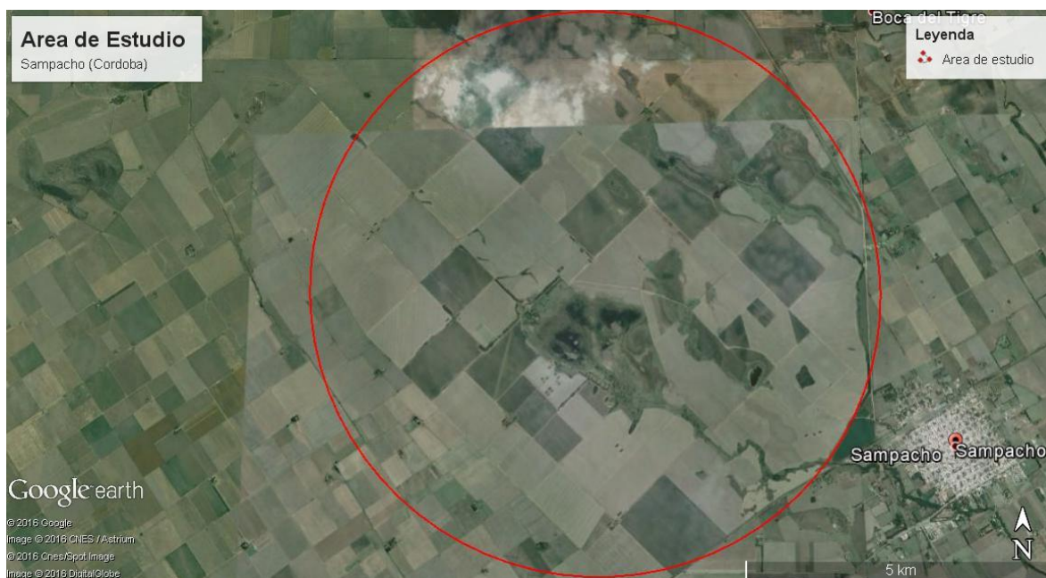
Figura 1. Área de muestreo del trabajo.

Los cultivos agrícolas presentes en la zona son soja, maíz, trigo y maní, en secuencia de este último, centeno para realizar cobertura durante los meses de invierno.