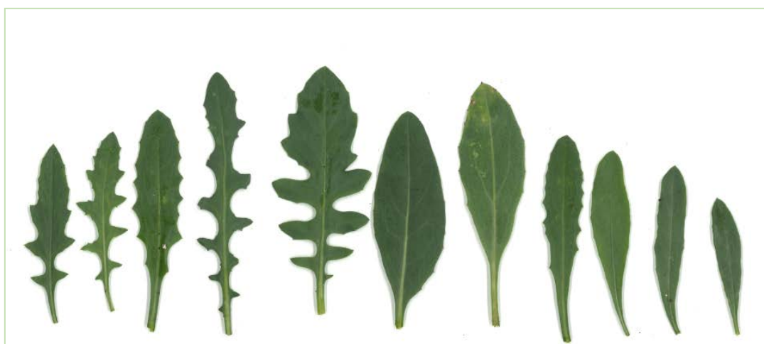
Fig. 1. Diferentes formas de las hojas basales observadas en las plantas cultivadas de Centaurea ×masfitensis .