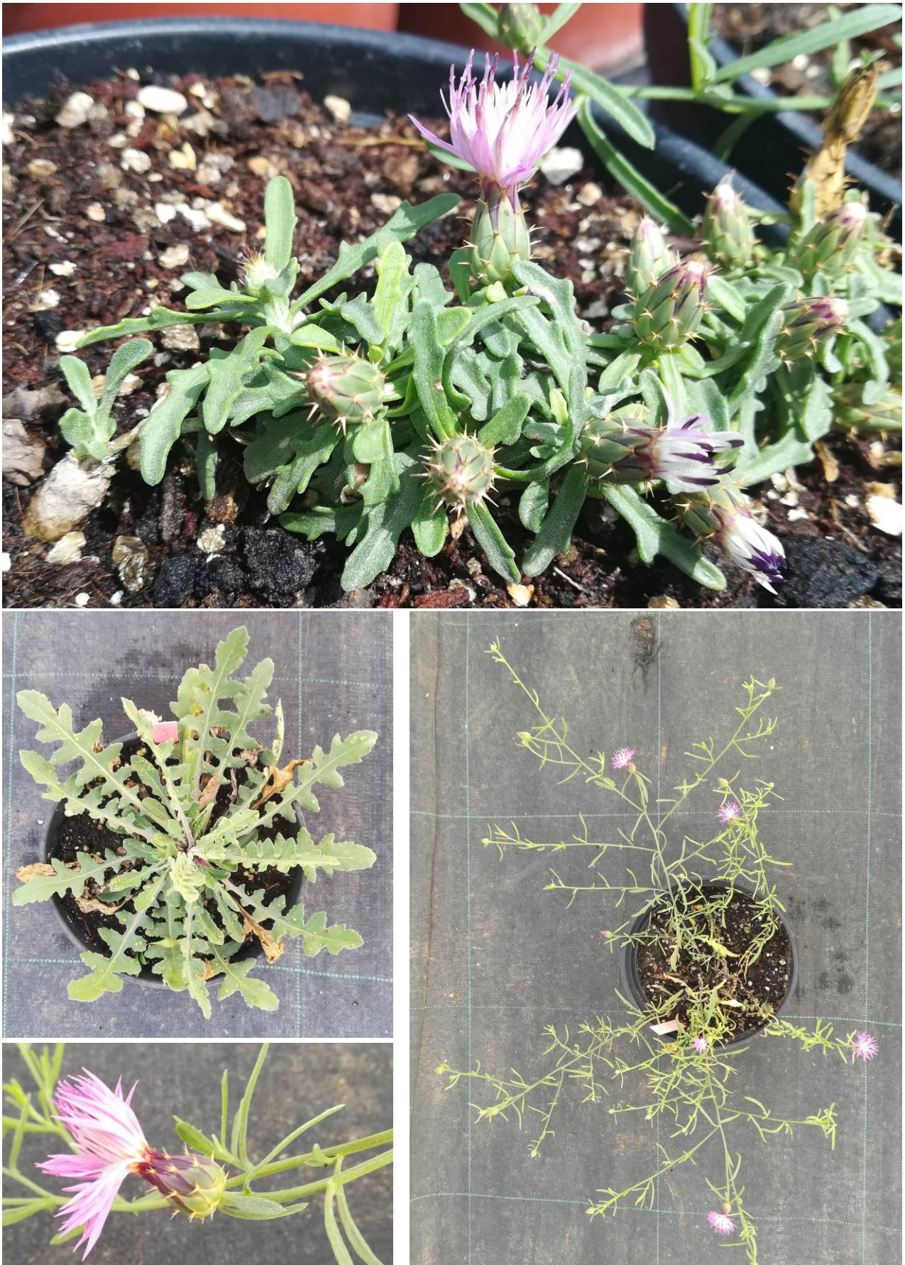
Fig. 3. Diferentes plantas de Centaurea xmasfitensis cultivadas en el CIEF y detalle de algunos de los caracteres más diagnósticos.