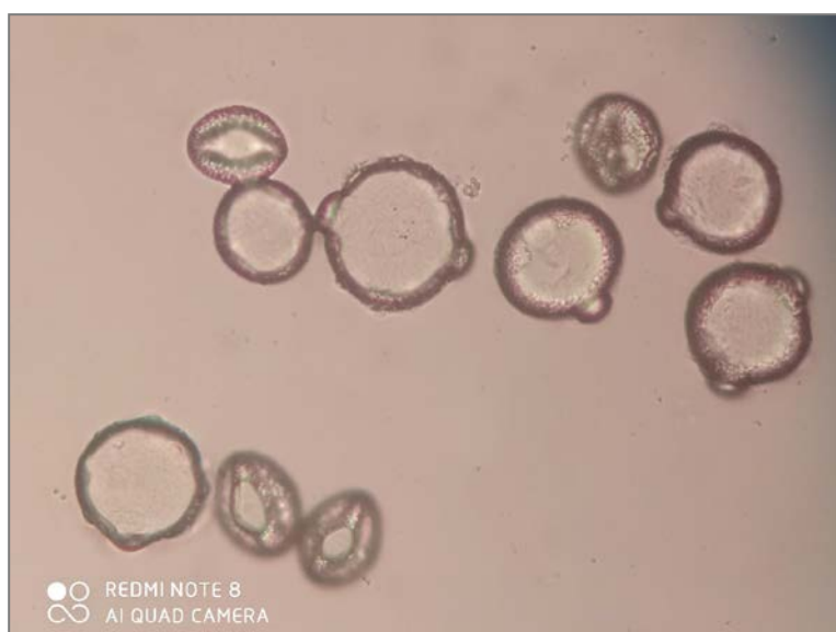
Fig. 2. Granos de polen de Centaurea ×masfitensis .