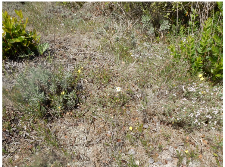
Photo 5. Vue du Koelerio macranthae-Thymetum vulgaris ; on reconnaît Thymus vulgaris , Fumana ericifolia , Lavandula latifolia , Helianthemum apenninum ; © B. de Foucault.

HAm12. Koelerio macranthae-Thymetum vulgaris B. Foucault 2019 (de Foucault, 2019a, tab. 7 ; photo 5).