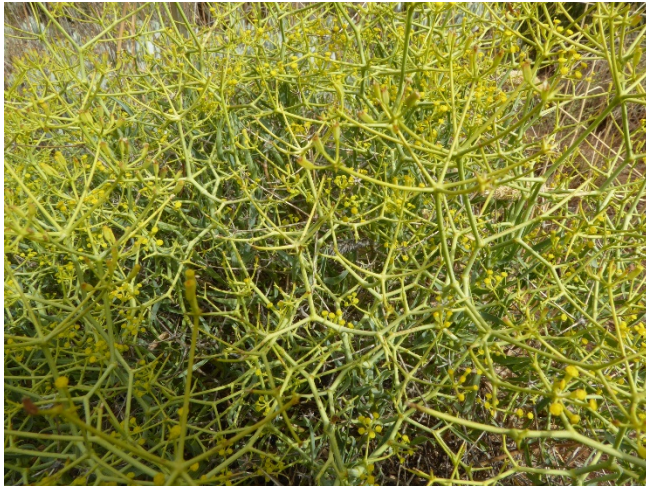
Photo 9. Bupleurum frutescens subsp. spinosum sur la Sierra Nevada ; © B. de Foucault.