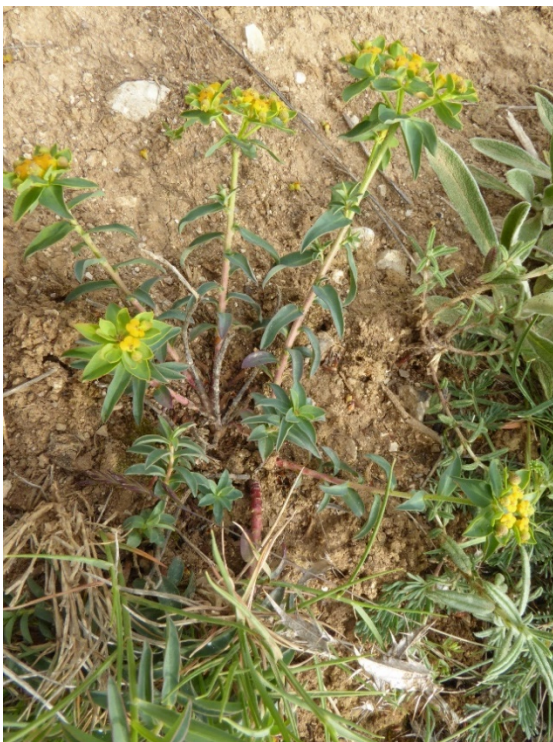
Photo 2. Euphorbia flavicoma subsp. mariolensis ; © B. de Foucault.