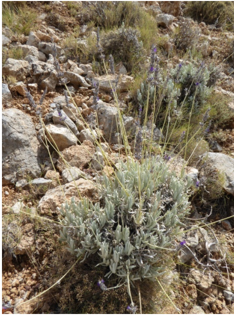
Photo 11. Lavandula lanata sur la Sierra Nevada ; © B. de Foucault.