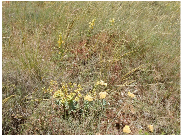
Photo 4. Un représentant audois du Phlomido lychnitidis-Brachypodion retusi ; Phlomis lychnitis au second plan, Euphorbia nicaeensis au premier ; © B. de Foucault.

Julve (1993) place aussi dans cette alliance le Brachypodio ramosi-Feruletum glaucae , association languedocienne décrite par Sutter (1977). L'examen du tableau de cet auteur montre pourtant de bien faibles affinités synsystématiques avec les Rosmarinetea officinalis . À défaut d'une meilleure place, on peut conserver cette position. À noter une association throphytique associée à Fumaria capreolata , Lathyrus oleraceus subsp. biflorus , Campanula erinus , Valantia muralis , Centranthus calcitrapa , Mercurialis huetii , Theligonum cynocrambe ... qui évoque un ourlet throphytique vernal de corniche relevant du Valantio-Galion muralis (classe des Cardaminetea hirsutae ).