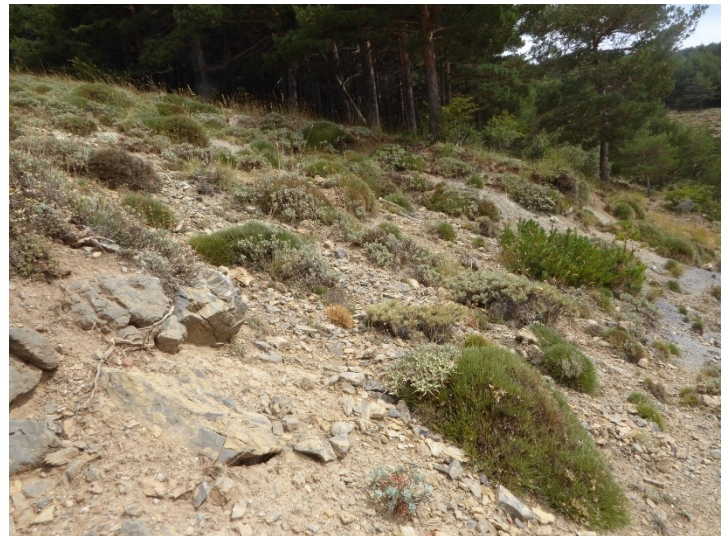
Photo 8. Une pelouse ouverte des Erinaceetalia anthyllidis sur la Sierra Nevada ; © B. de Foucault.

Garrigues ouest-orientales des massifs nord-africains et de la Sierra Nevada (photo 8), caractérisées par Erinacea anthyllis subsp. a., Helianthemum cinereum subsp. rotundifolium , H. apenninum subsp. stoechadifolium , Echinospartum boissieri , Jurinea humilis , Thymus orospedanus , Th. serpyllodes subsp. gadorensis , Helictochloa gervaisii , Festuca hystrix , Satureja intricata , Santolina canescens , Sideritis incana .