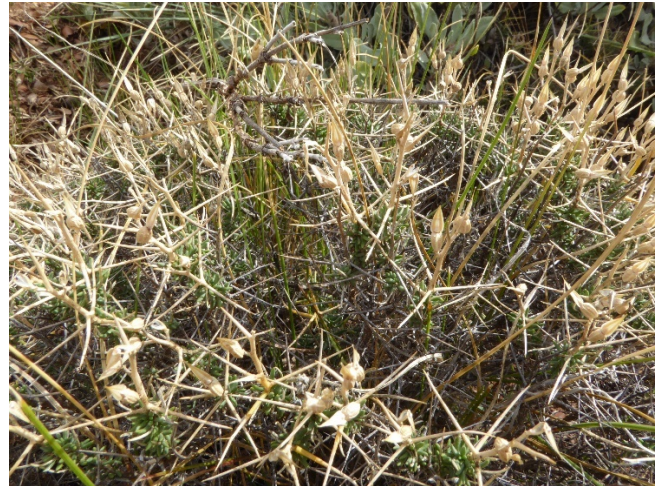
Photo 10. Vella spinosa en fruits sur la Sierra Nevada ; © B. de Foucault.

Alliance Fs. Festucion scariosae Martínez-Parras, Peinado & Alcaraz 1984 ( Lazaroa 5 : 124) ; tableau 1 : colonne Fs, tableau 17