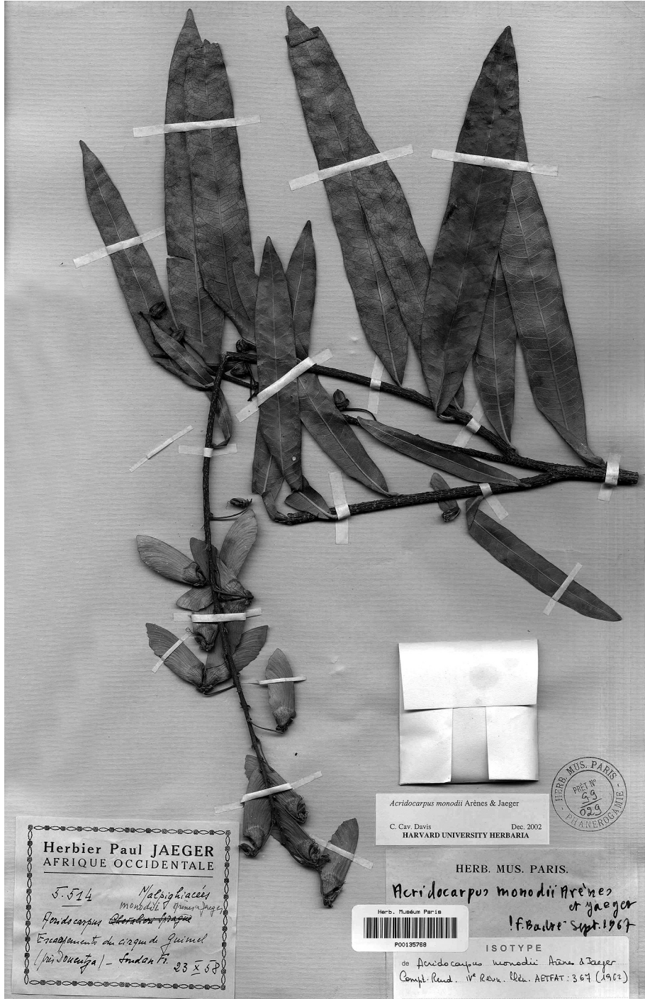
Fig. 2. — Acridocarpus monodii Arènes & Jaeger ex Birnbaum & J.Florence, isotype (P. Jaeger 5514, part P135768).