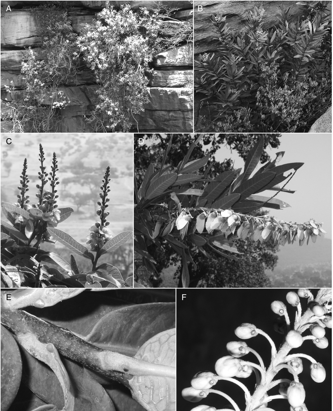
FIG. 4. — Acridocarpus monodii Arènes & Jaeger ex Birnbaum & J.Florence : A , forme plaquée retombante sur la roche abrupte ; B , forme buissonnante dressée ; C , inflorescence terminale en grappes dressées ; D , infrutescence, samares accolées par deux ; E , glandes à l'insertion du pétiole, face inférieure du limbe ; F , deux glandes ferrugineuses sur le calice.