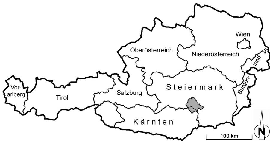
Abb. 1: Die Lage der Stubalpe (Untersuchungsgebiet, grau) in Beziehung zu den Grenzen der Bundesländer Österreichs The Stubalpe (area of investigation in grey colour) in relation to the provincial borders of Austria

Die Abgrenzung der Gebirgsgruppe wird nicht ganz einheitlich vollzogen. Der Südteil wird öfters, insbesondere in der älteren Literatur sowie in naturräumlichen Gliederungsmodellen für das Bundesland Kärnten (z. B. SEGER 1992) unter dem Namen Packalpe als eigene Gebirgsgruppe abgetrennt. Diese Ausscheidung des Südteils ist jedoch geomorphologisch wenig überzeugend. Wir folgen in der Gebietsabgrenzung