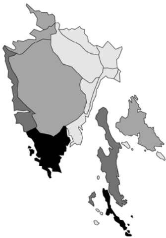
Abb. 115: Salvia verbenaca