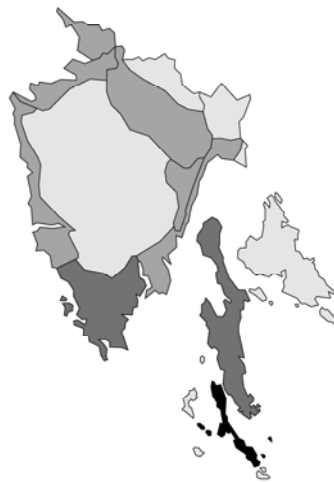
Abb. 18: Clinopodium ascendens