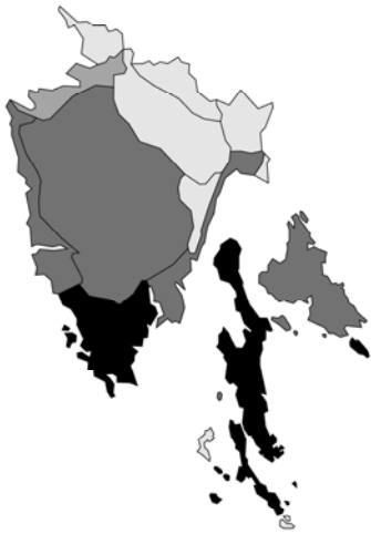
Abb. 147: Teucrium capitatum