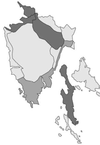
Abb. 98: Origanum vulgare subsp. prismaticum