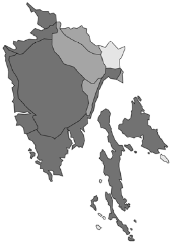
Abb. 103: Prunella laciniata