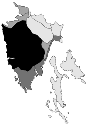
Abb. 77: Mentha microphylla