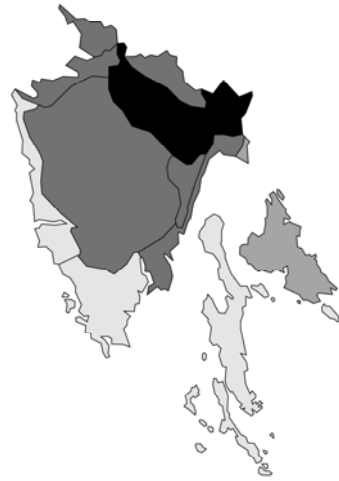
Abb. 50: Lamium orvala