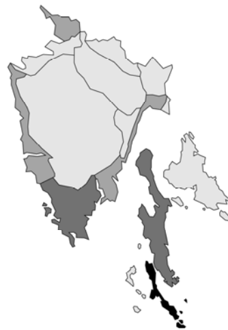
Abb. 90: Micromeria juliana