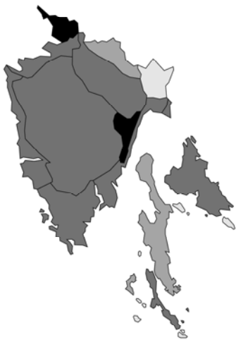
Abb. 119: Satureja montana