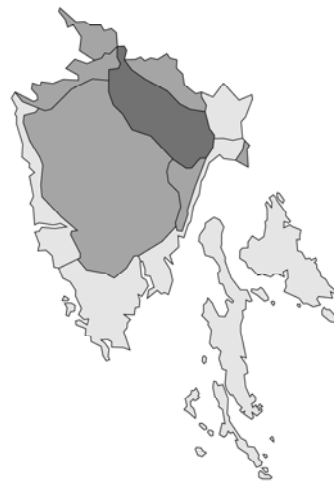
Abb. 102: Prunella grandiflora subsp. grandiflora