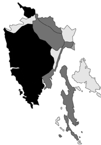
Abb. 48: Lamium amplexicaule subsp. amplexicaule