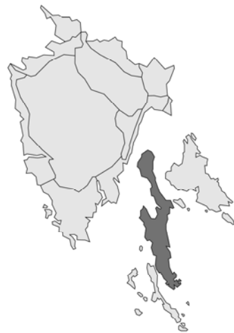
Abb. 6: Ballota acetabulosa