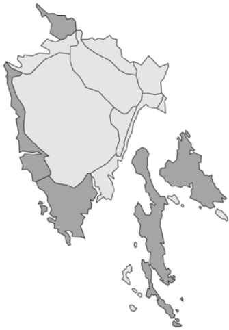
Abb. 3: Ajuga chamaepitys subsp. chia