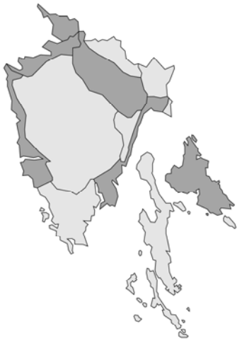
Abb. 45: Hyssopus officinalis