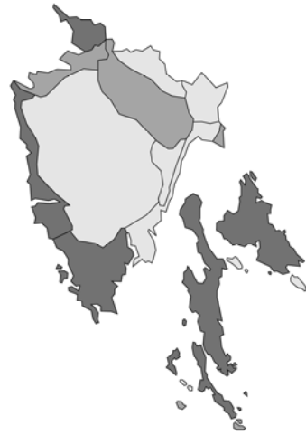
Abb. 62: Marrubium vulgare