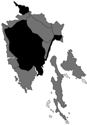
Abb. 49: Lamium maculatum