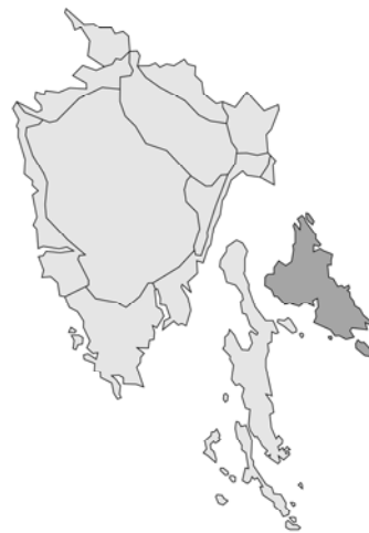
Abb. 126: Scutellaria orientalis subsp. pinnatifida