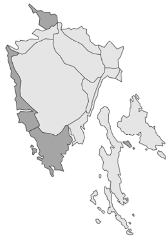
Abb. 96: Origanum majorana