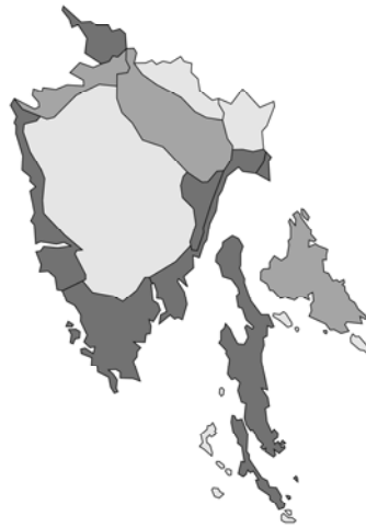
Abb. 16: Clinopodium acinos subsp. villosum