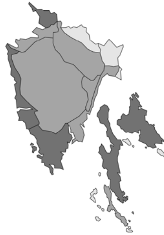
Abb. 20: Clinopodium glandulosum