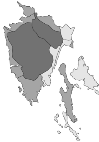
Abb. 32: Galeopsis angustifolia