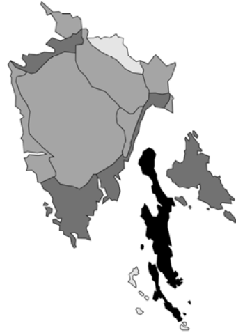
Abb. 142: Stachys subcrenata