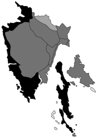
Abb. 157: Thymus longicaulis subsp. longicaulis