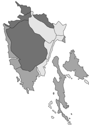
Abb. 92: Nepeta cataria