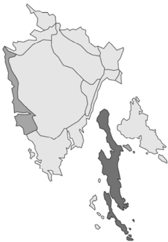
Abb. 101: Prasiium majus