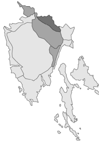
Abb. 164: Thymus pulegioides subsp. pulegioides