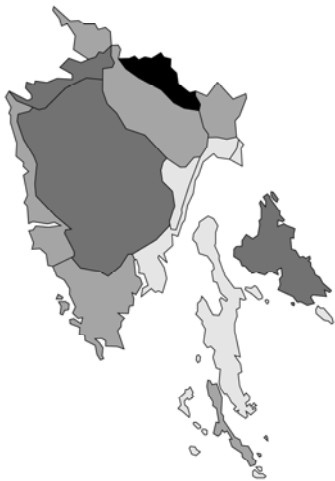
Abb. 71: Mentha arvensis