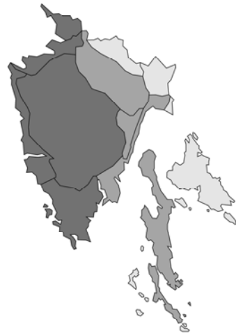
Abb. 64: Melissa romana