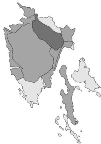
Abb. 66: Melittis melissophyllum subsp. albida