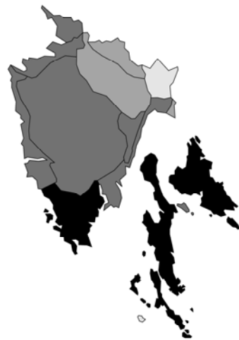
Abb. 60: Marrubium incanum