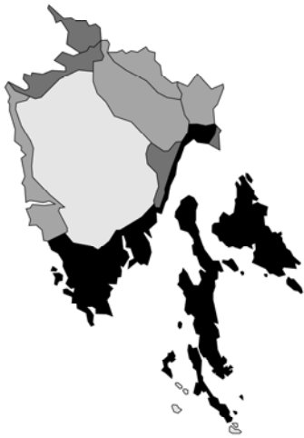
Abb. 111: Salvia officinalis subsp. officinalis