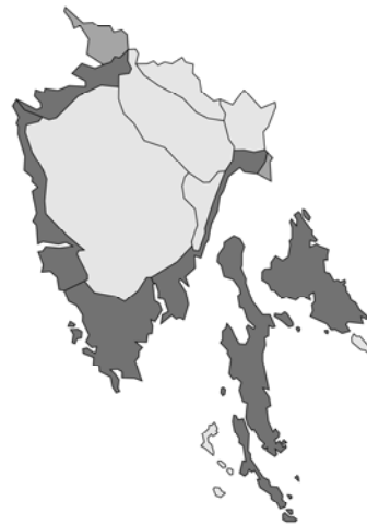
Abb. 168: Vitex agnus-castus