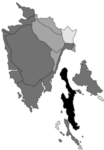
Abb. 23: Clinopodium nepeta