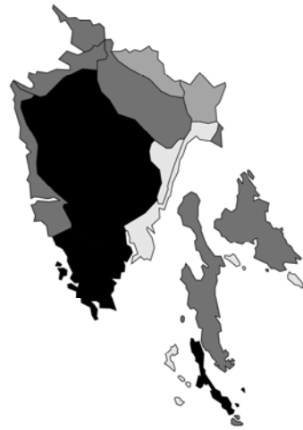
Abb. 4: Ajuga genevensis