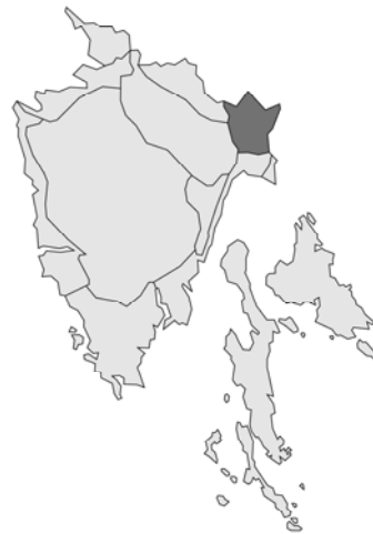
Abb. 42: Glechoma hederacea var. hederacea