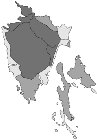
Abb. 121: Satureja montana subsp. variegata