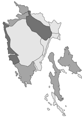
Abb. 28: Clinopodium vulgare subsp. vulgare