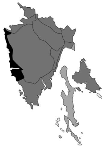
Abb. 12: Betonica officinalis