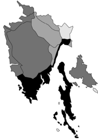
Abb. 106: Salvia bertolonii