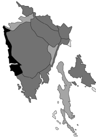
Abb. 14: Betonica officinalis subsp. serotina