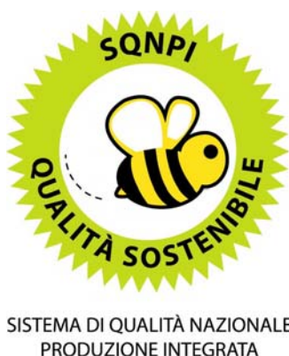
Figura 1: Logo del marchio Produzione Integrata previsto dal Sistema di Qualità Nazionale

* fino a scadenza dell'impegno continuano a valere i limiti di fertilizzazione azotata presenti nelle Norme Tecniche di Produzione Integrata allegate alla D.D. n. 377 del 17 aprile 2014, alle pagine 262, 268 e 282.