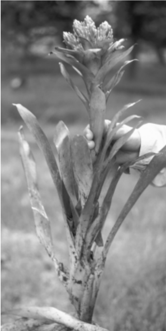
Figura 2A. Guzmania longibracteata . Hábito.