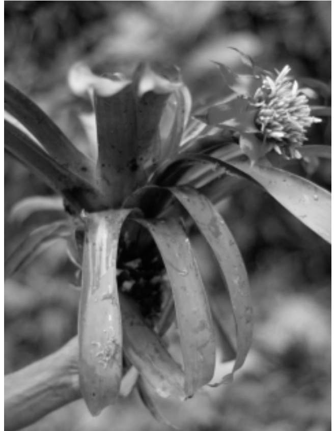
Figura 2C. G. eduardii . Hábito.