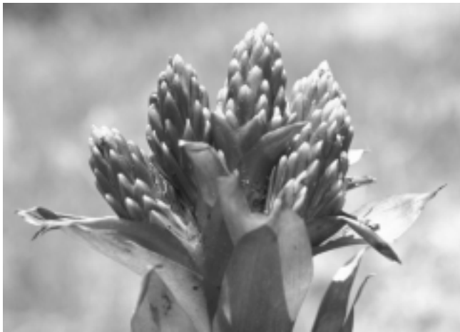
Figura 2B. G. longibracteata . Inflorescencia.