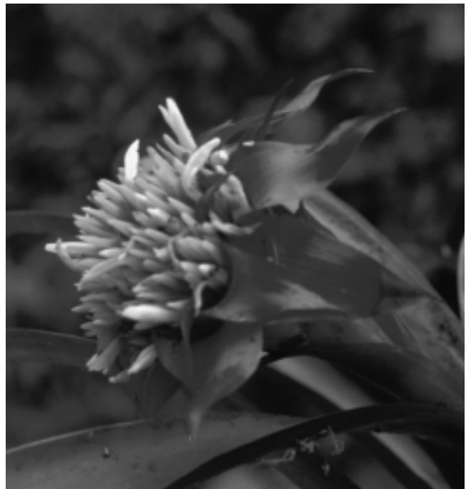
Figura 2D. G. eduardii . Inflorescencia.