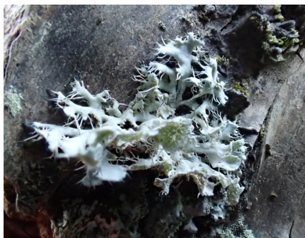
図2 . コフキゲジゲジゴケ生態写真 .