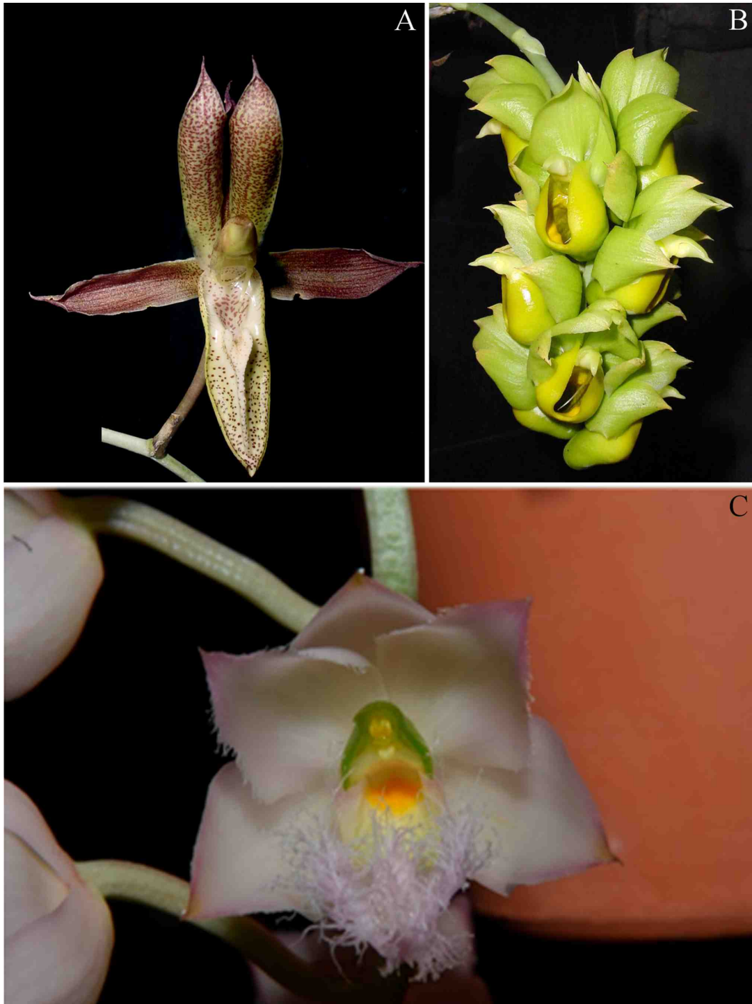
Figura 2. A. Catasetum laminatum Lindl. B. Catasetum pendulum Dodson. C. Clowesia rosea Lindl.

de biotas norteamericanas y suramericanas, tuvo un mayor incremento exactamente con el cierre total de este istmo (Bacon et al. , 2015). Finalmente y en relación a la segunda