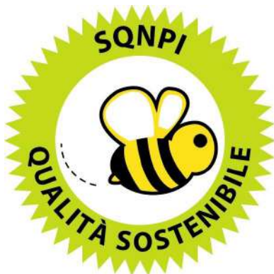
Figura 1: Logo del marchio Produzione Integrata previsto dal Sistema di Qualità Nazionale

SISTEMA DI QUALITÀ NAZIONALE PRODUZIONE INTEGRATA