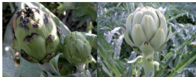
Síntomas de Ascochyta en capítulos de alcachofa.

La presencia de este hongo aumenta si la humedad es abundante, instalándose habitualmente primero en las hojas inferiores, viejas, pasando después a las demás. De allí, pasará a afectar a los capítulos.