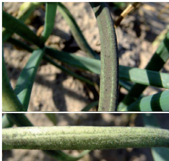
Síntomas del mildiu en hoja.

Es un hongo cuya evolución está muy condicionada por los factores climáticos, especialmente la humedad, que influye notablemente sobre la vida y evolución de sus órganos de multiplicación, los esporangios. Una vez situados éstos sobre la hoja, con temperaturas entre 10 y 22° C y presencia de agua (lluvia, rocío, riego, etc.) o una humedad relativa superior al 90%, se produce rápidamente la infección, realizándose la incubación entre 9 y 16 días, momento tras el cual empiezan a esporular.