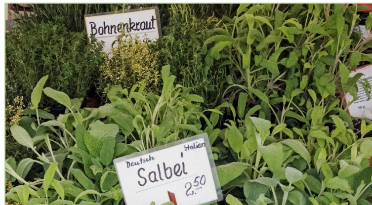
Bei der Produktion von Frisch- und frisch verarbeiteten Kräutern muss ganz besonders sorgfältig gearbeitet werden.

Im Bereich der Lebensmittel, also der Gewürze bzw. Gewürzpflanzen und Kräutertees kommen Produkte in gefrorenem, getrocknetem und frischem Zustand auf den Markt. Gerade frische Küchenkräuter sind mit besonderer Sorgfalt herzustellen und aufzubereiten, da sie in der Regel ohne weitere Erwärmung verzehrt werden. Auch getrocknete Kräuter werden häufig ohne weitere Erhitzung in der Lebensmittelverarbeitung, z. B. in Molkereiprodukten, eingesetzt. Bei all den Rohstoffen, die direkt als Lebensmittel genutzt bzw. im Lebensmittelbereich eingesetzt werden, also Gewürze bzw. Gewürzpflanzen sowie die Rohstoffe für Kräutertees, diätetische Nahrungsmittel und Nahrungsergänzungsmittel, erfolgt die Beurteilung der Pflanzenschutzmittelrückstände anhand der Verordnung (EG) Nr. 396/2005 (Anonym 2005).