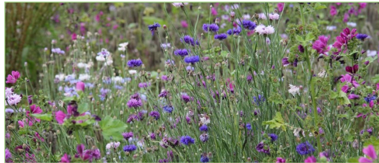
Blühstreifen bilden einen wertvollen Lebensraum für Nützlinge aller Art, sollten jedoch keine Wirtspflanzen für unerwünschte Schädlinge

Eine wichtige Präventivmaßnahme gegen Schadorganismen stellen im integrierten Pflanzenschutz der Schutz und die Förderung von Nutzorganismen dar. So lassen sich kulturschädigende Insekten durch Raubmilben, Schlupfwespen und Schwebfliegen sowie durch insektenfressende Vögel und Kleintiere