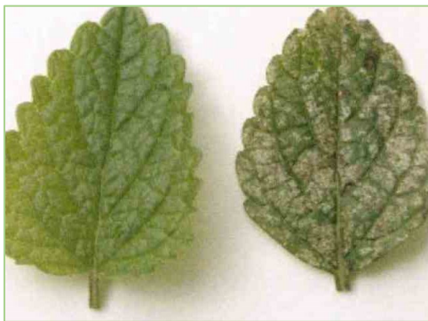
Melisse – links: gesundes Blatt, rechts: Saugschäden durch Zikaden

Aufgrund der Empfindlichkeit der Arznei- und Gewürzpflanzen gegenüber Pilzen wie Echtem Mehltau, Falschem Mehltau, Rost und Anthraknosen sowie tierischen Schaderregern wie Blattläusen, Zikaden, Blattkäfern, Wanzen und Raupen ist der Schadorganismendruck an den Standorten sowie auf den Nachbarschlägen zu beachten. Nach Möglichkeit sollten diese Organismen weder an den Standorten selbst, noch in der näheren Umgebung vorkommen. Zudem sollten in der Nachbarschaft der Arznei- und Gewürzpflanzenschläge alle Pflanzen vermieden werden, die als Zwischen- oder Winterwirte für die Schadorganismen dienen; beispielhaft seien Pfaffenhütchen und Schneeball als Winterwirte für die Schwarze Bohnenblattlaus sowie Dill, Petersilie und Kümmel als Schaderregerservoir pilzlicher Pathogene für Fenchel genannt.