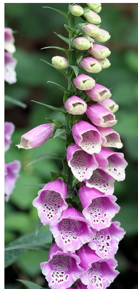
Mangelnde Sorgfalt bei der Ernte von hochgiftigen Arten wie z. B. Digitalis purpurea kann zur Kontamination der Ernteprodukte der Folgekultur führen.

Generell ist darauf zu achten, dass Vorfrüchte vollständig geerntet werden und nur unvermeidbare Rückstände, z. B. nach dem Dreschen von Körnerfrüchten, auf der Fläche verbleiben. Unvollständig geerntete Vorfrüchte, die in die nachfolgenden Arznei- und Gewürzpflanzenkulturen durchwachsen oder dort keimen, können zur Belastung der späteren Ware mit Fremdbestandteilen führen, d.h. sie erhöhen den Aufwand der Unkrautkontrolle. Dazu gehören z. B. Kartoffeln, Meerrettich, Kamille und Fenchel. Besonders kritisch ist das bei hochgiftigen Kulturarten wie Fingerhut oder PA bzw. Tropanalkaloide (TA) enthaltende Arten wie Beinwell, Pestwurz, Tollkirsche u.a. Zudem sind durchwachsende Kulturarten, treten sie in größerer Anzahl auf, weiter als Wirtspflanzen für artspezifische Schadorganismen relevant und verkürzen damit die Anbaupause.