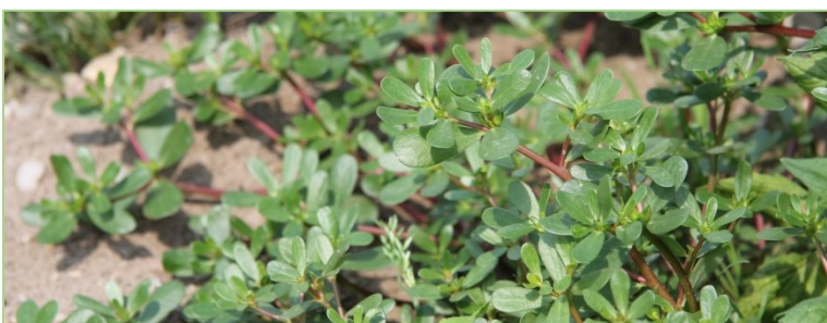
Um Problemunkräuter wie z. B. Portulak nicht über Mensch und Maschine weiter zu verbreiten, sollten betroffene Flächen zum Schluss einer Kampagne beerntet und bearbeitet werden.

Neben den bisher genannten vorbeugenden Maßnahmen zur Schadorganismenregulation bei Arznei- und Gewürzpflanzen sind allgemeine Hygienemaßnahmen ebenfalls von Bedeutung. Sie betreffen die Verbreitung von für Arznei- und Gewürzpflanzen schädlichen Organismen zwischen den verschiedenen Schlägen einer Kultur sowie den Schlägen verschiedener Kulturen, sofern diese von den gleichen Schadorganismen befallen werden. Dazu zählen die Samen von Portulak und Greiskraut ebenso wie die Sporen bzw. Dauerformen von Verticillium dahliae oder Sclerotinia sclerotiorum , die beide einen sehr weiten Wirtskreis, darunter auch Arznei- und Gewürzpflanzen (z. B. Artischocke, Pfefferminze), haben. Falls eine Übertragungsgefahr besteht, d.h. sofern in einem Schlag ein Befall vorliegt, sollten die Pflege- und Erntearbeiten auf diesen Flächen zum Schluss einer Kampagne durchgeführt werden.