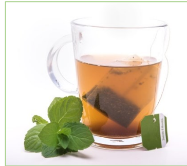
Unzählige Arznei- und Gewürzpflanzen sind in Form von Kräutertees auf dem Markt zu finden.

Im Bereich der Phytopharmaka und diätetischen Nahrung kommen Arznei- und Gewürzpflanzen zum Beispiel als Tee, als Wirkstoffe in Tabletten, Kapseln und Salben sowie als Tinkturen zum Einsatz. Entsprechend gilt es, die Qualität der diesen Produkten zugrunde liegenden Arznei- und Gewürzpflanzenzubereitungen wie beispielsweise feste und flüssige Extrakte, Öle und getrocknete Drogen sicherzustellen. Auch das jeweilige Herstellungsverfahren ist zu beachten. So können bei der Extraktion mit Lösungsmitteln beispielsweise neben den gewünschten Bestandteilen auch unerwünschte Substanzen in die Extrakte gelangen. Im Fall der pflanzlichen Arzneimittel sind die Grenzwerte für erlaubte Rückstände - u.a. für Pflanzenschutzmittel - sehr niedrig und durch eine hohe Untersuchungsdichte zu gewährleisten. Das Europäische Arzneibuch gibt in der Monographie „Pestizidrückstände“ für 70 Stoffe Grenzwerte an. Weiterhin wird beschrieben, wie auf Basis der akzeptablen täglichen Aufnahmemenge Grenzwerte für weitere Substanzen berechnet werden können. Für im Europäischen Arzneibuch nicht erfasste Wirkstoffe ist zusätzlich die Verordnung (EG) Nr. 396/2005 zur Beurteilung der Pflanzenschutzmittelrückstände heranzuziehen (Anonym 2005).