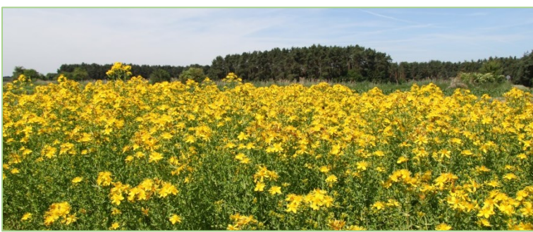
Mehrjährige Kulturen wie Hypericum perforatum können bis zu 5 Jahre auf einer Fläche stehen – danach ist eine Anbaupause dieser Art auf derselben Fläche für mehrere Jahre erforderlich.

stalten. Höhere Anteile an Arznei- und Gewürzpflanzenkulturen erfordern ein breites Arten- und Pflanzenfamilienspektrum und eine noch detailliertere Fruchtfolgeplanung.