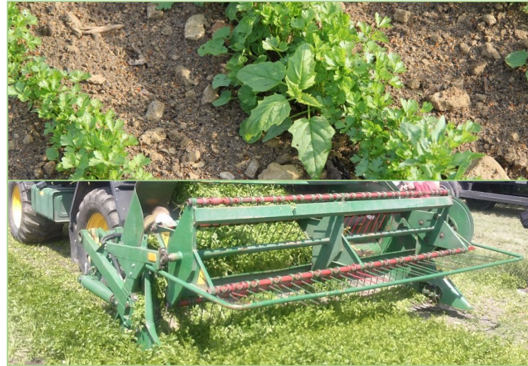
Wenn toxische Unkräuter bei der maschinellen Ernte mit erfasst werden, können Giftstoffe bis ins verarbeitete Endprodukt gelangen.

Um die rechtlich erforderliche, hohe Qualität der Arznei- und Gewürzpflanzen zu gewährleisten, wur-