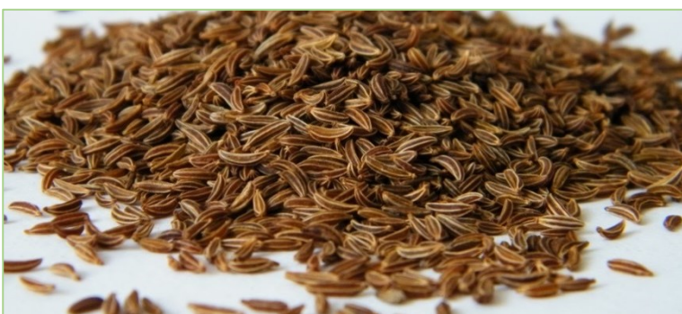
Kümmel zählt zu den Arten mit einem vergleichsweise hohen Nährstoffbedarf.

Eine zu starke Stickstoffdüngung sollte vermieden werden, da diese die Anfälligkeit von Arznei- und Gewürzpflanzen gegenüber Schaderregern erhöhen und es zu Ernte- und Qualitätseinbußen sowie einer erhöhten Aufwendung an Pflanzenschutzmitteln kommen kann. Um eine Stickstoffüberdüngung zu vermeiden, sollte dieser in Teilgaben bis zum Bestandsschluss oder bei Kulturen mit mehreren Ernten nach den einzelnen Schnitten einer Arznei- und Gewürzpflanzenkultur angewendet werden. Als Beispiele für Arznei- und Gewürzpflanzen mit hohem Nährstoffbedarf sind Große Brennnessel und Pfefferminze zu nennen. Anspruchslos bezüglich des Nährstoffbedarfs ist hingegen Kamille oder Kümmel. Bei Anis wiederum führen größere Stickstoffgaben zu Reifeverzögerung und Lagerbildung.