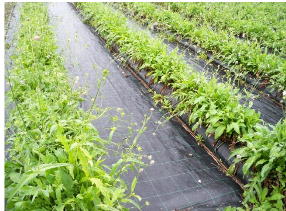
Neben organischen Mulchmaterialien können auch synthetische Materialien wie Mulchfolie oder Bändchengewebe zur Unterdrückung des Unkrautwachstums angewandt werden.

Neben der mechanischen kann auch eine thermische Unkrautregulation erfolgen. Dabei werden die möglichst kleinen Unkräuter so weit erhitzt, dass sie in Folge irreversibler Schädigungen absterben; ein Ab- oder Verbrennen der Pflanzen wird nicht angestrebt. Die zu behandelnden Unkräuter unterscheiden sich in ihrer Hitzeempfindlichkeit aufgrund der Lage des Vegetationspunkts, der Ausbildung einer Kutikula, der Ausbildung von Rhizomen, der Blattstärke und des Alters. So sind beispielsweise die Arten Quecke, Distel, Ackerwinde und ältere Gräser hitzetolerant; thermisch behandelbar nur im Keimblattstadium sind z. B. Winden- und Vogelknöterich, thermisch behandelbar im Keim- bis 2-Blatt-