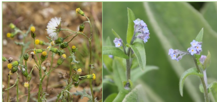
Gemeines Greiskraut und Acker-Vergissmeinnicht zählen zu den häufigsten PA-haltigen Unkräutern und sollten keinesfalls ins Endprodukt gelangen.

Aufgrund der Vielfalt der Kulturen ist das Spektrum an zu bekämpfenden Unkräutern, Erkrankungen und Schädlingen breit. Unkräuter konkurrieren um die für das Wachstum der Kulturpflanzen benötigten Nährstoffe, Wasser und Licht. Innerhalb der Unkräuter ist insbesondere die Gruppe der Unkräuter zu nennen, die Pyrrrolizidinalkaloide (PA) enthalten und zu denen u.a. Gemeines Greiskraut, Acker-Vergissmeinnicht, Jakobskreuzkraut und Natternkopf zählen. Deren Bedeutung für die Arznei- und Gewürzpflanzenproduktion wurde erst durch eine Studie des Bundesinstituts für Risikobewertung (BfR) zum Vorkommen von PA in Tees und Kräutertees in 2013 erkannt: Werden diese Unkräuter bei der Ernte der Kulturpflanzen mit erfasst und wie diese aufbereitet, gelangen die PA in Form giftiger Unkrautbestandteile in die späteren Produkte. Zur Begrenzung der Belastung pflanzlicher Arzneimittel durch PA wurden bereits Bekanntmachungen der europäischen Arzneimittelzulassungsbehörden erlassen; aktuell beträgt in Deutschland die maximal tolerierte PA-Exposition bezogen auf die Tagesdosis des Fertigprodukts 1,0 µg/Tag. Weitere Regulierungen werden erwartet.