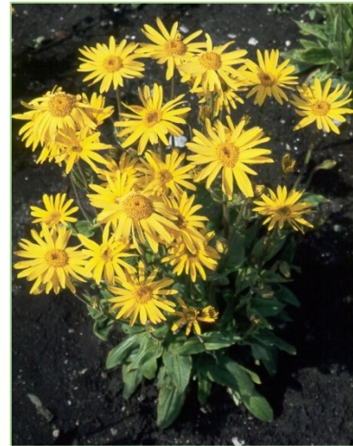
Arnika sollte auf sauren Böden mit einem pH-Wert von 5,5-6,2 angebaut werden.

Da Arznei- und Gewürzpflanzen eine geringe Konkurrenzkraft gegenüber Unkräutern aufweisen, ist der Beikrautdruck an den eigentlichen Standorten sowie in der Nachbarschaft der Schläge zu beachten. Problemunkräuter wie beispielsweise Klettenlabkraut, Ackerkratzdistel, Ackerwinde sowie grundsätzlich alle pyrrolizidin- und tropanalkaloidhaltigen Unkräuter sollten weder auf den Schlägen, noch in deren Nachbarschaft vorkommen. Außerdem ist gegebenenfalls der Durchwuchs der Kulturen aus der Vorfrucht wie beispielsweise von Kartoffeln und Raps zu bedenken.