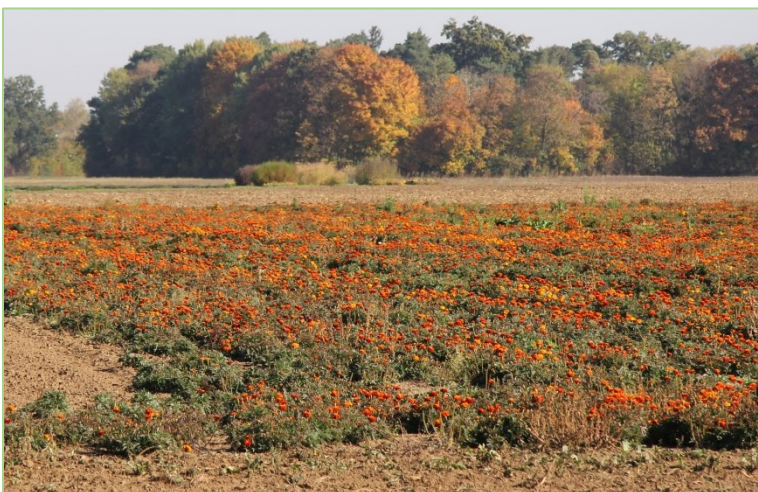
Zahlreiche pflanzenpathogene Nematoden können durch den Anbau von Tagetes als Zwischen- oder Vorfrucht bekämpft oder stark reduziert werden.

Da Vor- und Zwischenfrüchte meist sehr spezifisch wirken, ist zur Nematodenbekämpfung über die Fruchtfolge eine art- bzw. gattungsgenaue Diagnose der Nematoden im Boden erforderlich. So lässt sich beispielsweise durch den Zwischenfruchtanbau von Ölrettich als Fangpflanze vor Petersilie der Nematode Meloidogyne hapla regulieren. Tagetes ist eine Feindpflanze für Pratylenchus sp.. Gegen zahlreiche andere Nematoden ( Meloidogyne , Globodera , Heterodera , Paratylenchus etc.) kann Tagetes als Nicht-Wirtspflanze eingesetzt werden, so dass ihre Besatzdichte auf natürliche Weise zurückgeht. Der Wirkmechanismus, die Tagetesarten und -Sorten, sowie die Wirkeinschränkungen sind in der Tagetes-Broschüre (JKI 2013; www.julius-kuehn.de ) dargestellt.