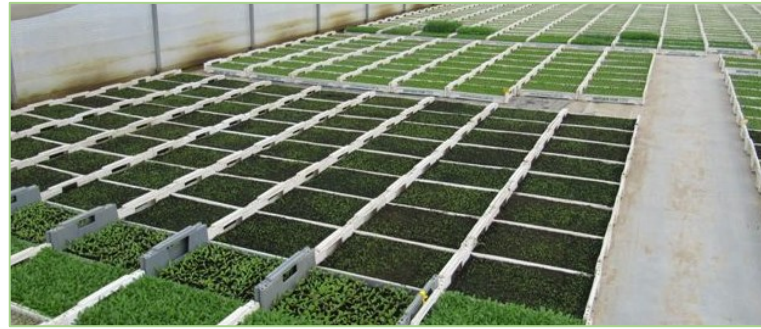
Gesunde Jungpflanzen bilden die Basis für eine robuste, gesunde und widerstandsfähige Pflanzkultur.

vorhandene Toleranz oder Resistenz einer Sorte wird zudem von den Züchterhäusern und Saatgut-Anbietern hingewiesen. Ein Sortenversuchswesen, das systematisch die Leistung aktueller Sorten untersucht, gibt es für Arznei- und Gewürzpflanzen nicht.