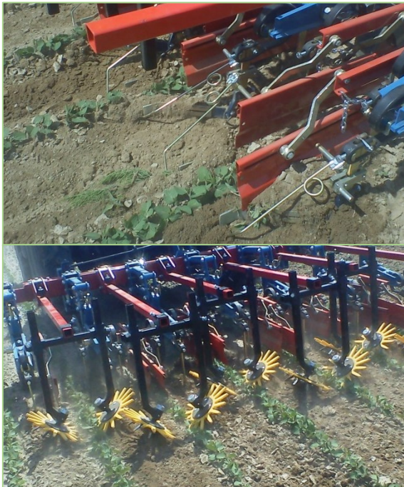
Für die Unkrautregulierung innerhalb der Reihe können beispielsweise Flachhäufler (oben) oder Fingerhacke (unten) zum Einsatz kommen.

hackbürsten und Rollhacken sowie in den Reihen arbeitende Hackgeräte wie Fingerhacke, Torsionshacke, Flachhäufler und seltener einzelne Rollstriegel-elemente verwendet werden. Für den Einsatz in Pflanzkulturen gibt es Systeme, bei denen die Hackwerkzeuge kameragestützt um die Pflanzen einer Reihe herum geführt werden. Jedoch sind bislang nur wenige dieser Geräte auf Arznei- und Gewürzpflanzenkulturen abgestimmt (Erkennung) und aufgrund der hohen Kosten vorerst nur auf großen Betriebsflächen rentabel.