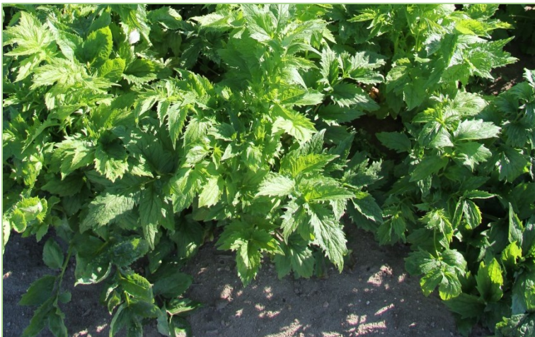
Baldrian sollte mit Blick auf die Wurzelernte und -reinigung, bevorzugt auf leichten Böden angebaut werden.

Um als Anbauflächen für bestimmte Arznei- und Gewürzpflanzen genutzt zu werden, ist eine Charakterisierung der Standorte bezüglich der essentiellen Parameter wie Bodenart, -fruchtbarkeit und -struktur, pH-Wert, Durchwurzelungstiefe, Nährstoffverfügbarkeit, Jahresdurchschnitts-, Maximal- und Minimaltemperatur sowie Niederschlag und Hangneigung notwendig.