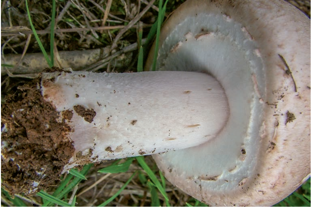
40 A. depauperatus