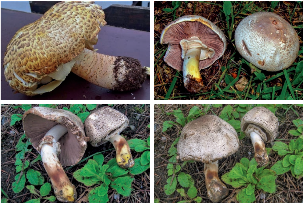
Dall'alto a sinistra: A. augustus Foto 18 Franco Mezzanotte; A. moelleri Foto 19 Ennio Carassai; A. moelleri Foto 20 M. Faraoni; A. moelleri Foto 21 M. Faraoni.

Nel materiale che ci rimane da osservare due specie commestibili, di rinvenimento abbastanza frequente, arrossano intensamente allo sfregamento sulla cuticola del cappello o per scarificazione (con un'unghia) sul gambo e sono Agaricus sylvaticus e Agaricus langei ; questo arrossamento è un segno molto importante per distinguere queste due specie commestibili da sosia tossici (vedi foto 23 in cui i tre carpofori a sinistra sono A. sylvaticus e i due a destra A. freirei ).