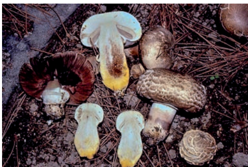
Dall'alto a sinistra: A. depauperatus Foto 30 L.A. Parra; A. bisporus Foto 31 M. Faraoni; A. xanthodermus Foto 32 M. Faraoni; A. iodosmus Foto 33 E. Carassai.