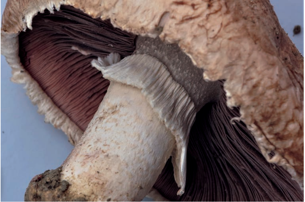
43 A. bisporus