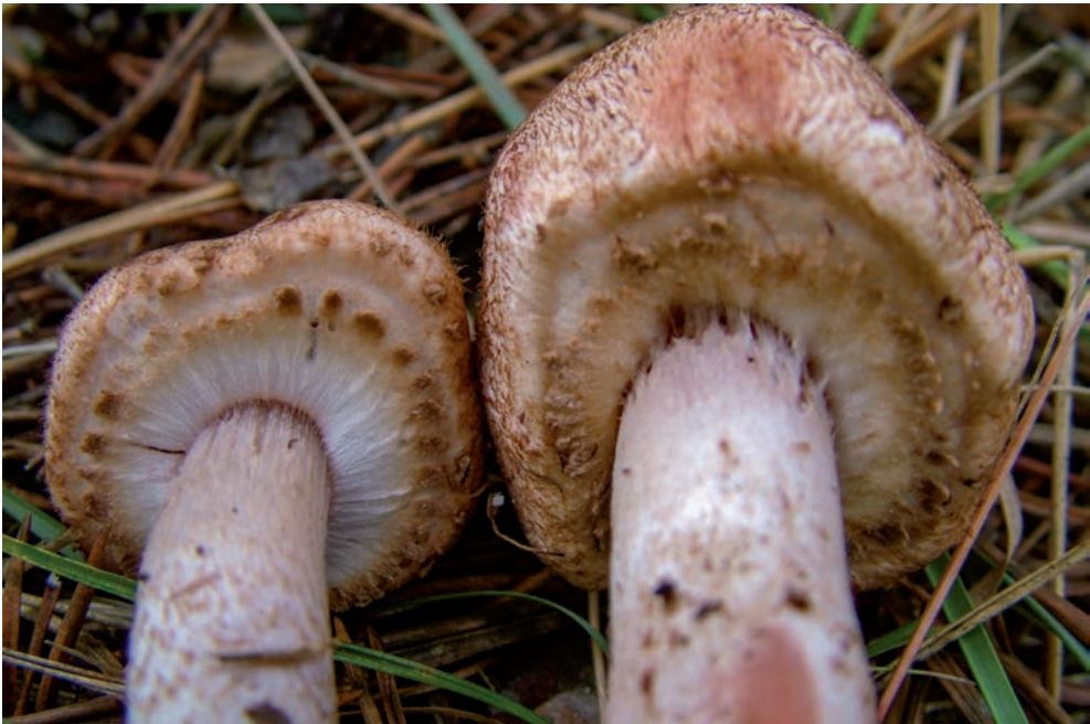
39 A. lanzei

In A. impudicus l'anello è supero, membranoso, sottile, semplice o doppio con un leggero secondo strato con piccole squame lineari vicino al margine, concolori al cappello (vedi foto 41).