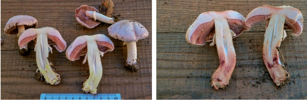
da sinistra: A. pseudopratisensis Foto 34 M. Faraoni; A. pseudopratisensis Foto 35 M. Faraoni.

In A. freirei la carne, bianca al taglio, può rimanere immutabile o raramente può ingiallire molto debolmente alla base del gambo in modo quasi impercettibile, per poi diventare rosa o rosso vino poco intenso soprattutto nella metà inferiore del gambo. Da ultimo in A. bresadolanus la carne, al taglio bianca, può rimanere tale, immutabile, o virare lentamente all'ocraceo nella metà superiore del gambo e al giallo alla base del gambo.