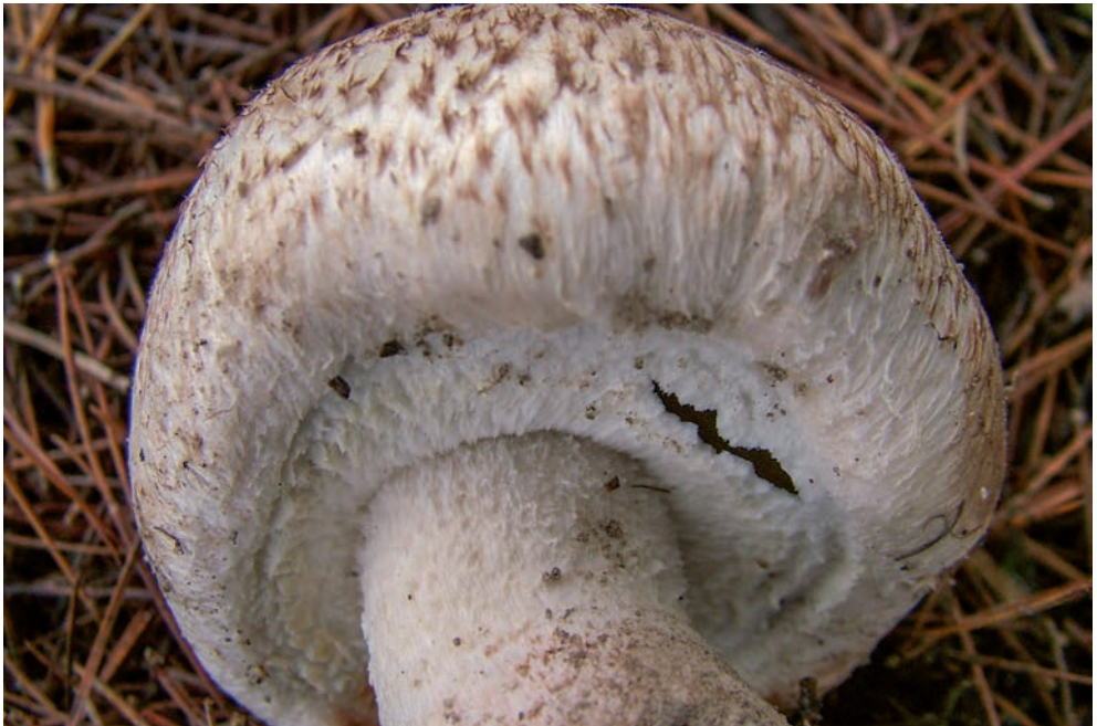
41 A. impudicus

In A. sylvaticus l'anello è supero, sottile ma ingrossato al margine, semplice o doppio, con la faccia inferiore fibrillosa, col margine fimbriato o talora lacerato in grosse squame triangolari in un accenno di ruota dentata (vedi foto 42).