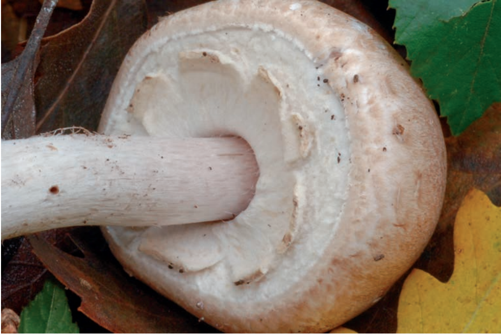
47 A. phaeolepidotus