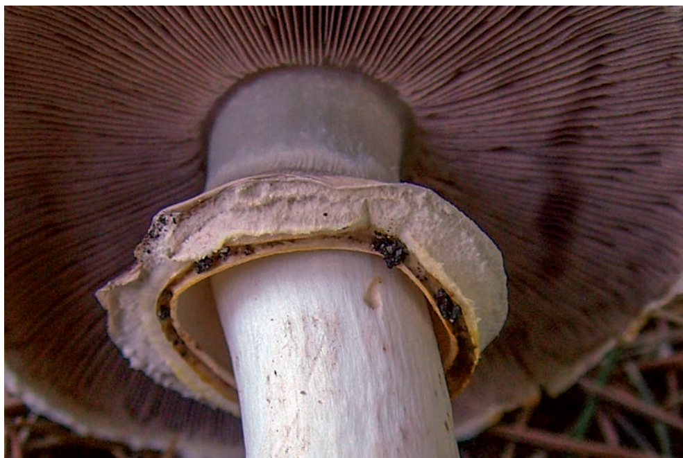
45 A. iodosmus

Per quanto riguarda le specie commestibili che abbiamo appena trattato A. augustus è possibile raccogliarlo sia in ambiente selvaggio (boschi di conifere soprattutto, ma anche di latifoglie o misti) che antropizzato come parchi e giardini; mai osservato in prati o in altre zone erbose senza copertura arborea. A. subrufescens fruttifica in modo