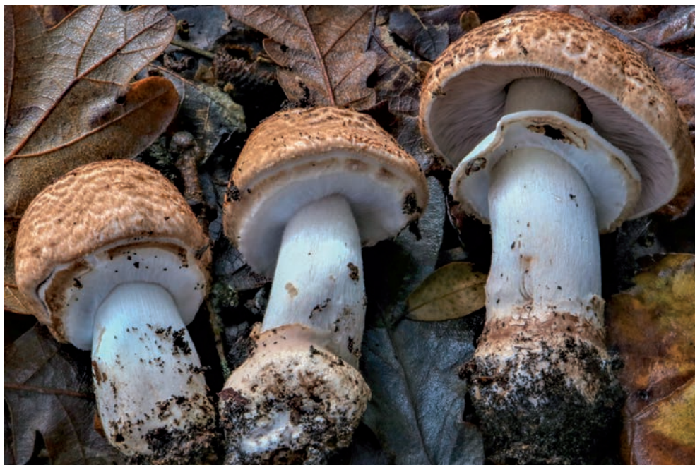
51 A. freirei