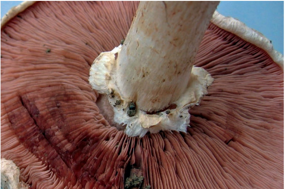
44 A. bisporus