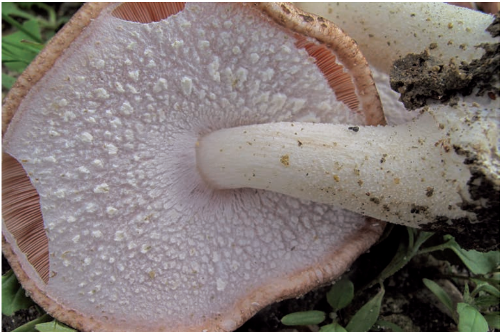
37 A. subrufescens

In A. depauperatus è supero, membranoso, sottile, semplice, liscio, col margine generalmente ispessito e doppio, e allora la lamina inferiore è spesso delicatamente denticolata (vedi foto 40).