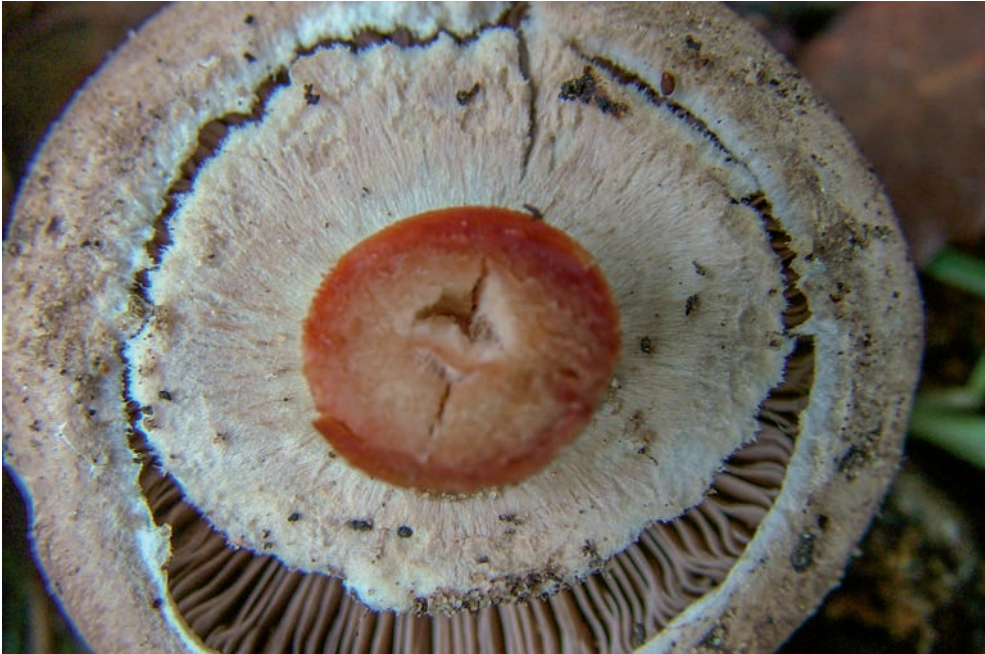
42 A. sylvaticus

Anche in A. phaeolepidotus , nella sua espressione più caratteristica, è unico nel suo genere: supero, doppio, ampio, membranoso, con la faccia inferiore lacerata in squame a ruota dentata, con una squama lineare a forma di arco all'estremità di ogni dente,