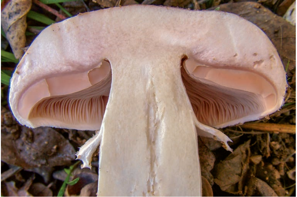
49 A. bresadolanus