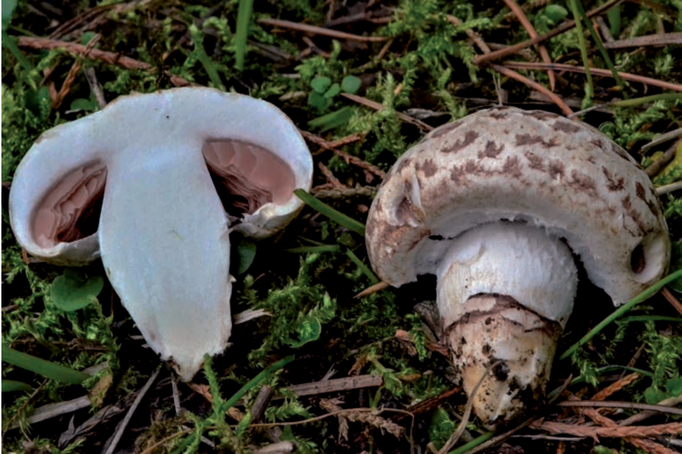
38 A. porphyrocephalus