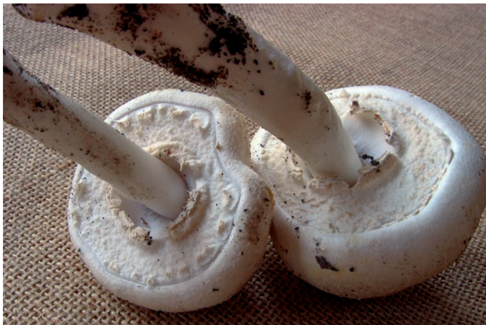
46 A. xanthodermus