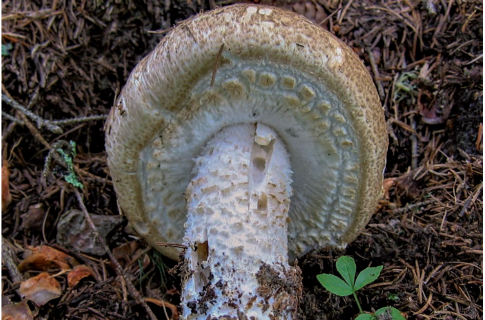
36 A. augustus