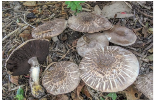
Dall'alto a sinistra: A. bresadolanus Foto 22 E. Carassai; confronto tra A. sylvaticus e A. frerei Foto 23 M. Faraoni; A. impudicus Foto 24 L.A. Parra; A. xanthodermus Foto 25 M. Faraoni.