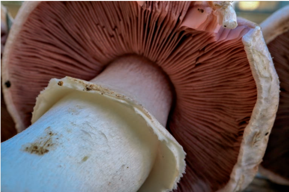
48 A. pseudopratensis

A. pseudopratensis preferisce aree antropizzate e ruderali (bordo di strade, orti, parchi pubblici, aree dunali modificate artificialmente, aree coltivate come uliveti, ecc..). A.