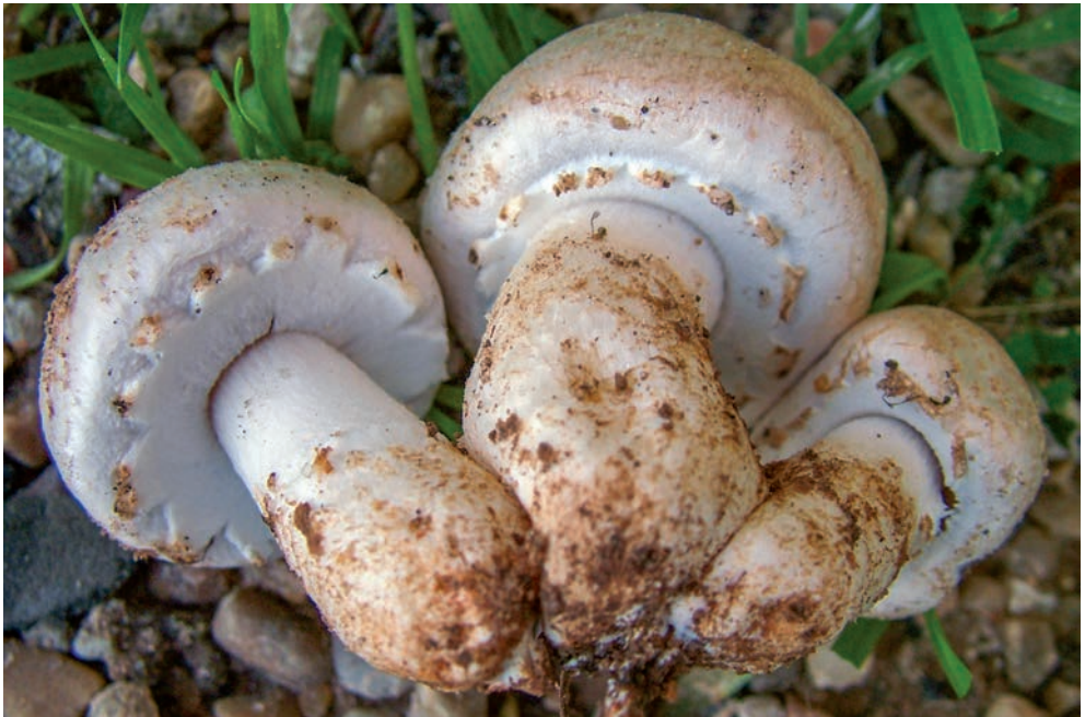
50 A. bresadolanus

iodosmus ha fruttificazione gregaria o in gruppi con basidiomi ravvicinati o confluenti, uniti alla base del gambo, in luoghi molto antropizzati (giardini, parchi, cimiteri,