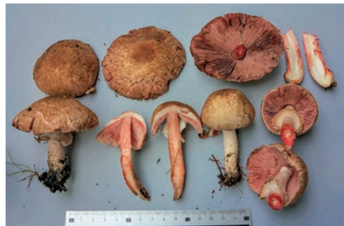
Dall'alto a sinistra: A. moelleri Foto 26 M. Faraoni; A. bresadolanus Foto 27 L.A. Parra; A. sylvaticus Foto 28 M. Faraoni; A. langei Foto 29 M. Faraoni.