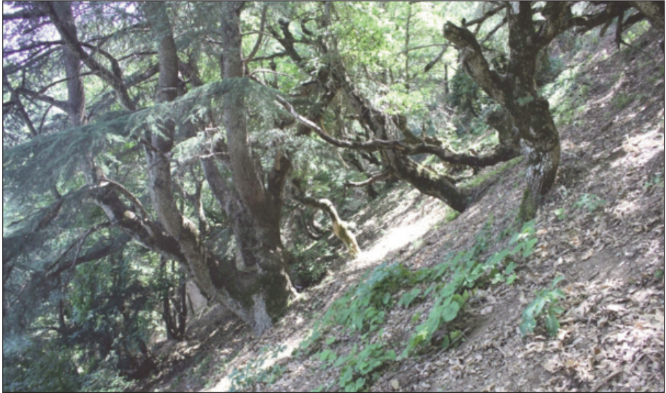
Fig. 2. Station d' Epipactis microphylla , 11.06.2020.