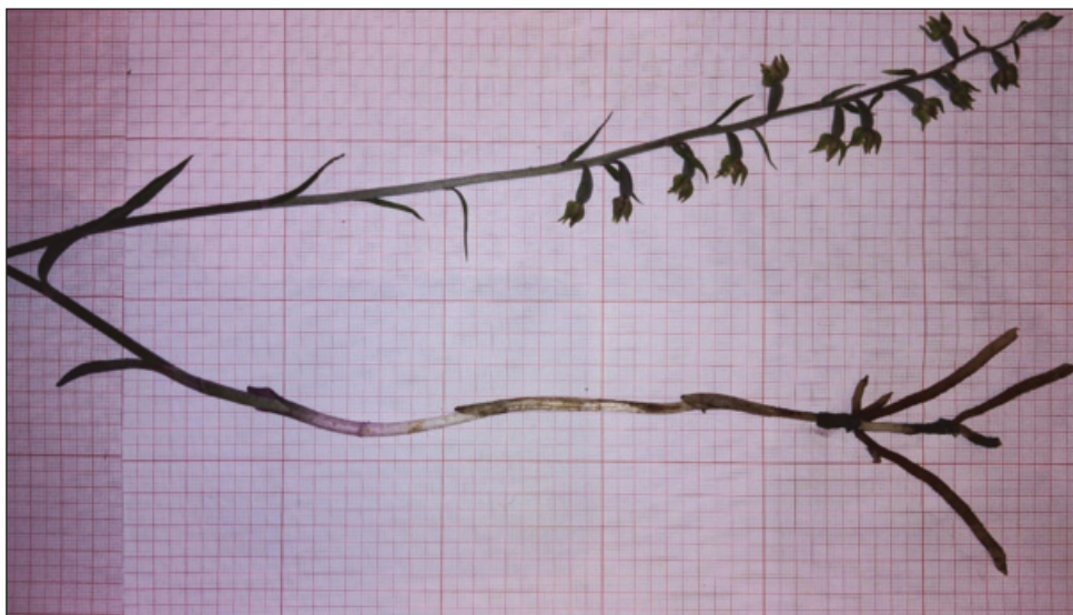
Fig. 4. Un spécimen de la plante, récolté sur le versant nord de Babor, 11.06.2020.