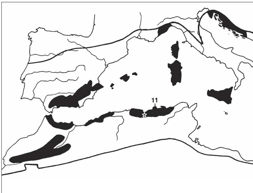
Fig. 1. Localisation géographique du Djebel Babor (étoile) et du hotspot régional « Kabylies-Nuidie-Kroumirie » (n°11) parmi le hotspot mondial de biodiversité du bassin méditerranéen (d'après Médail & Quézel 1997 et Véla & Benhouhou 2007, modifié).

Le Néocomien qui forme les crêtes est formé des marno-calcaires et des schistes. Le Crétacé supérieur est transgressif sur tout le versant nord du Babor, peu détritique à la base, chargé en bancs calcaires détritiques et conglomérats (Duplan 1952).