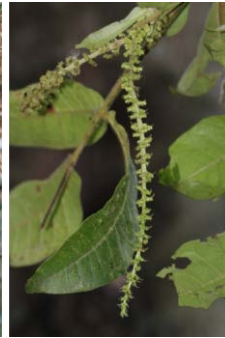
Untaian Bunga Jantan