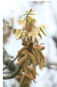
Daun dan bunga