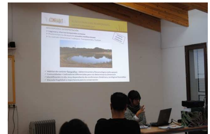
Jornadas Formativas sobre hábitats y especies en JB Dunas del Odile