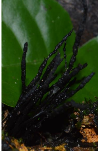
45. Xylaria multiplex