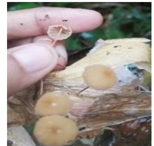
41. Marasmius sp.