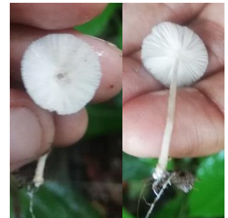
44. Coprinellus sp.