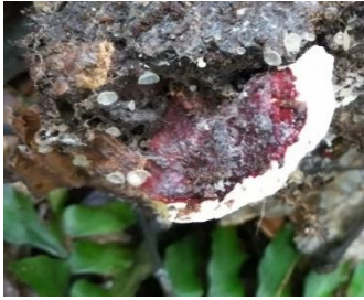
21. Earliella scabrosa