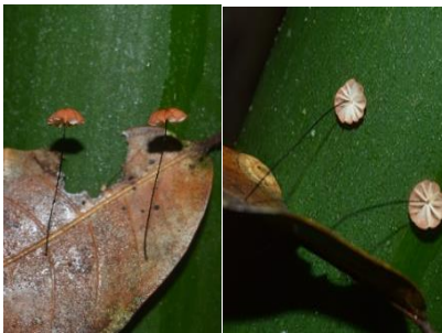
30. Marasmius cf. praecox