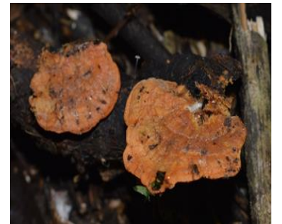
32. Pycnoporus sanguineus