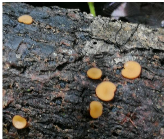
50. Scutellina scutellata