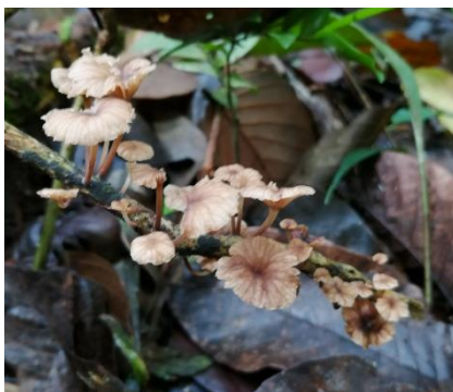
25. Marasmiellus omphaloides