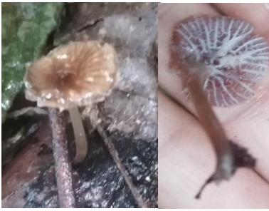
27. Mycena aff. tessellata

Practica pre-profesional II- Universidad Nacional de la Amazonia Peruana-Estación Biológica Kawsay