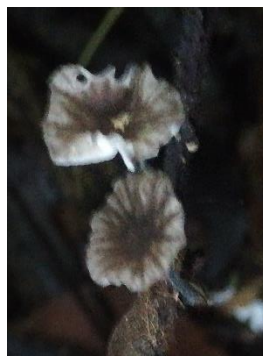
4. Gerronema bryogeton