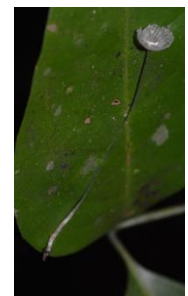
35. Coprinopsis sp.