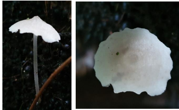
11. Filoboletus gracilis