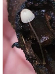
15. Marasmiellus sp.