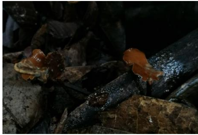
23. Polyporus dictyopus