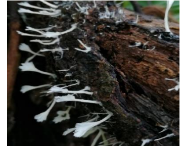
24. Hydnopolyporus fimbriatua