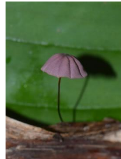
7. Marasmius haematocephalus