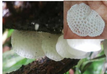
40. Favolaschia sp. 2