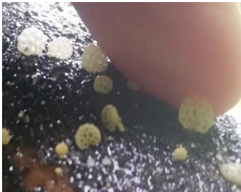
39. Favolaschia sp. 1