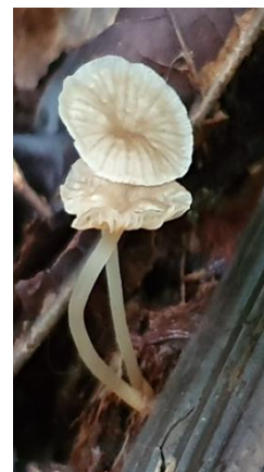
13. Mycena lucentipes (bioluminiscence)