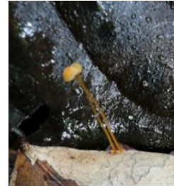
16. Marasmius guyanensis cf.