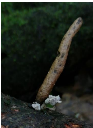
49. Xylaria sp.