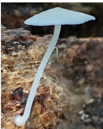
12. Gymnopus sp.