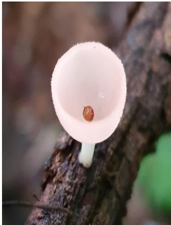
47. Cookeina speciosa