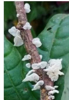
20. Marasmius griseoroseus