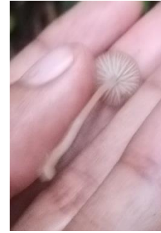
2. Hymenopellis sp.