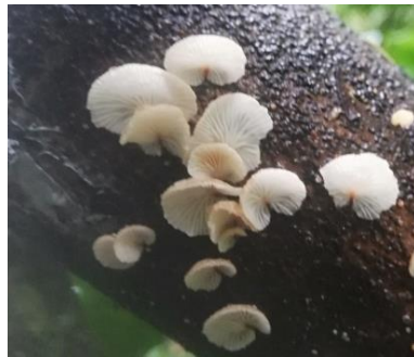
37. Crepidotus cf. variabilis