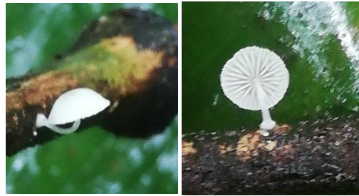
28. Mycena sp.