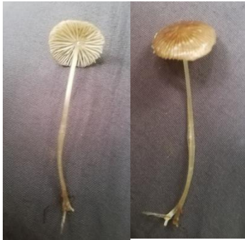
36. Mycena aff. tessellata

Practica pre-profesional II- Universidad Nacional de la Amazonia Peruana-Estación Biológica Kawsay