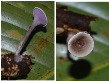
33. Trogia cantharelloides