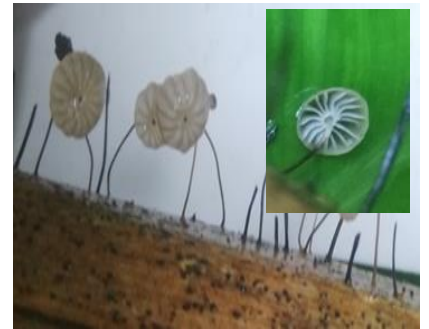
38. Marasmius castellanoi