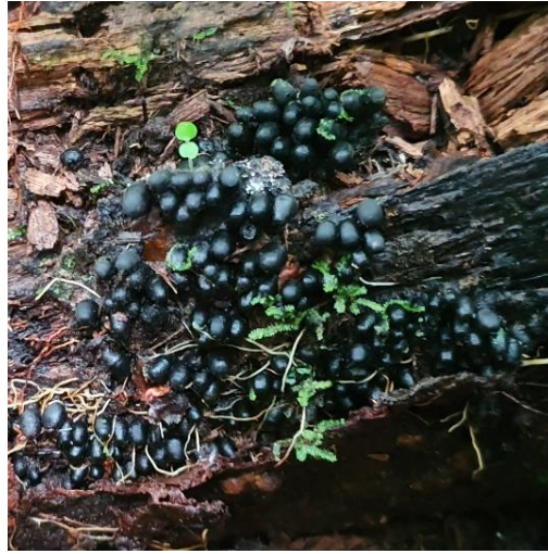
46. Phylacia poculiformis