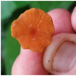
14. Marasmius denisii cf.

Practica pre-profesional II- Universidad Nacional de la Amazonia Peruana-Estación Biológica Kawsay