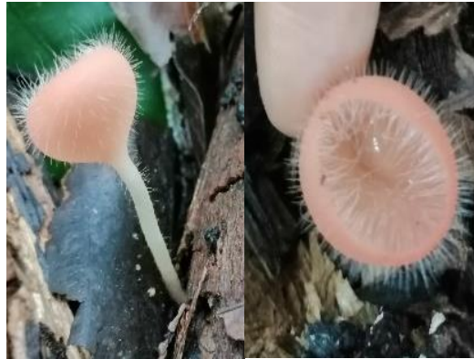
48. Cookeina tricholoma