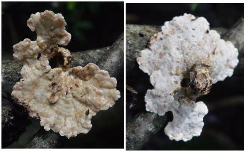
8. Stereopsis radicans

Practica pre-profesional II- Universidad Nacional de la Amazonia Peruana-Estación Biológica Kawsay