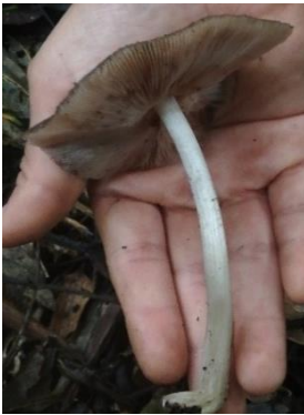
3. Pluteus sp.