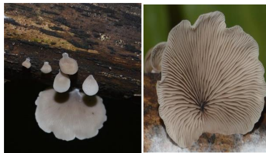
34. Schizophyllum commune