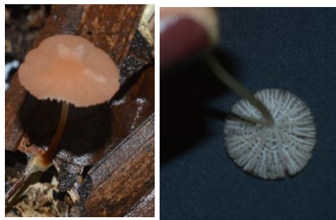
31. Marasmius cladophyllus