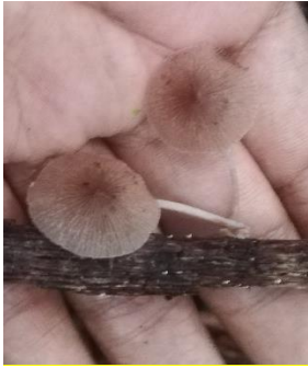
1. Psathyrella candolleana

Practica pre-profesional II- Universidad Nacional de la Amazonia Peruana-Estación Biológica Kawsay