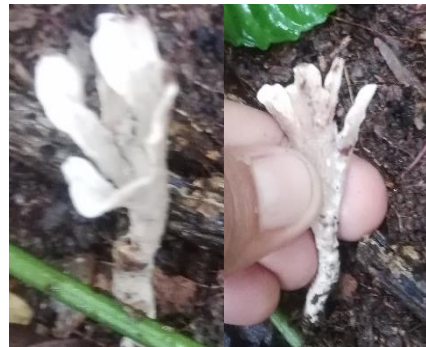
43. Stereopsis hiscens var. macrospora