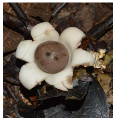
26. Geastrum triplex