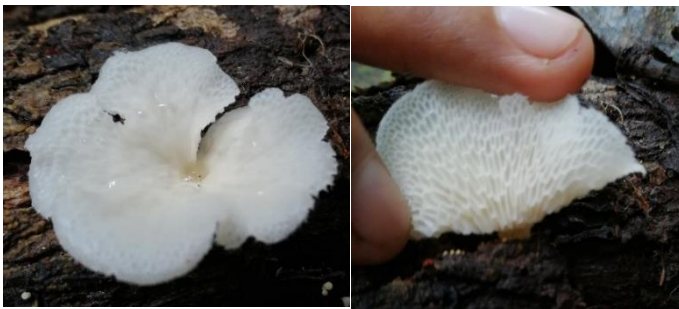
19. Favolus brasiliensis