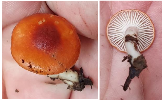
18. Leucopaxillus gracillimus