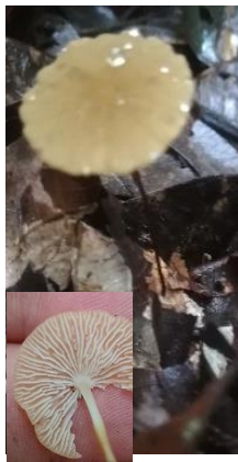
42. Marasmius cf. cuatrecasii