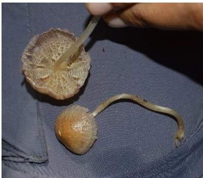
10. Marasmius cladophyllus