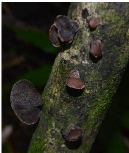
6. Auricularia cornea