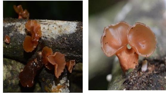
9. Dacryopinax elegans