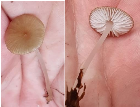
17. Hydropus brunneoumbonatus