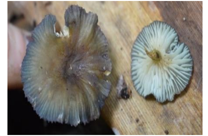
29. Marasmius trinitatis