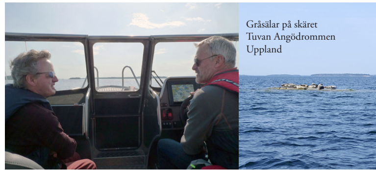
Gräsäl på skäret Tuvan Angödrommen Uppland