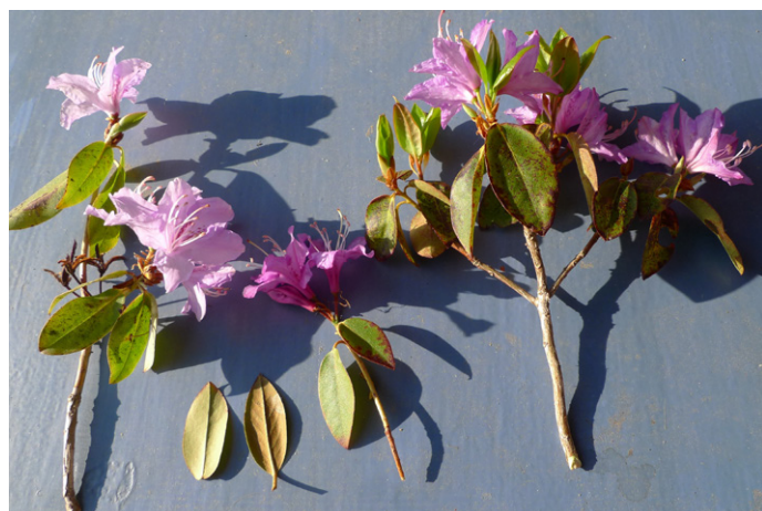
Small leaf (R) is concinnum . Other material are tsinlingense wc Taibai Shan June 4, 2004 Lassas Hagar May 22, 2019