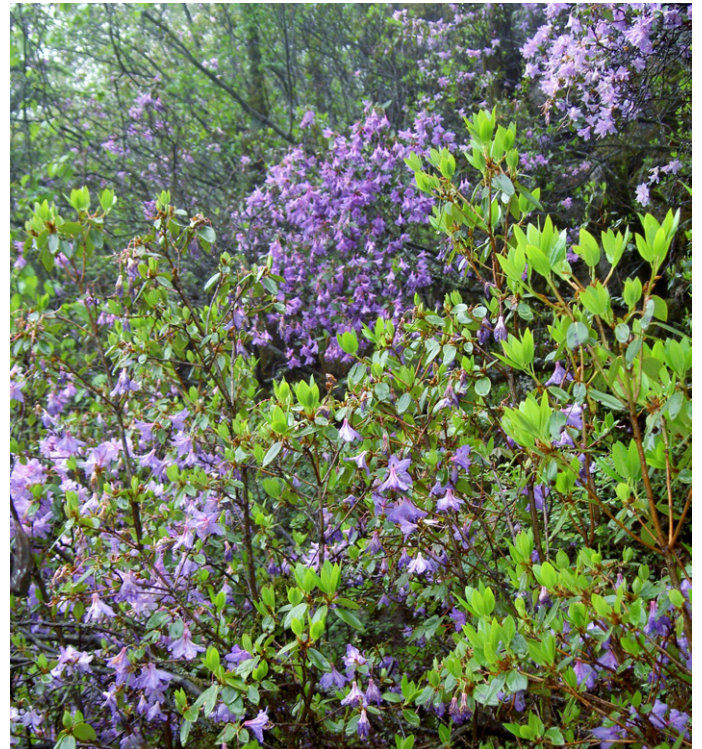
Förmodad Rhododendron tsinlingense Taibai Shan Shaanxi China June 4, 2004

Om vi koncentrerar oss på släktet rhododendron kom jag i kontakt med följande arter: Rhododendron aureodorsale , R. purdomii , R. capitatum , R. pachytrichum och R. concinnum vilka alla stod i full blom. Varje art utom concinnum har jag i artikeln behandlat tämligen utförligt då det vid den tidpunkten oftast fanns tveksamheter om artens ställning. Rhododendron concinnum , med svenskt namn skogsalprosen, fann jag som klart identifierad och ägnade tiden mest åt andra aktiviteter. Nämligen att beundra de vanligt förekommande buskarna väl synliga och spridda i den mäktiga nordsluttningen. Jag minns särskilt den friska doften i deras närhet och att de var förbluffande höga, flera uppåt 4 meter. Begeistrad var jag av de mest blåblommade vilka jag fann tilltalande. Jag iakttog skogsalprosen i begränsat antal ända upp till höjdnivån 3100 m, där som underskog till Rhododendron aureodorsale .