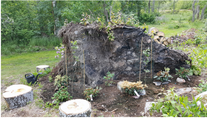
Nya planteringar vid rotvälta i Lassas Hagar