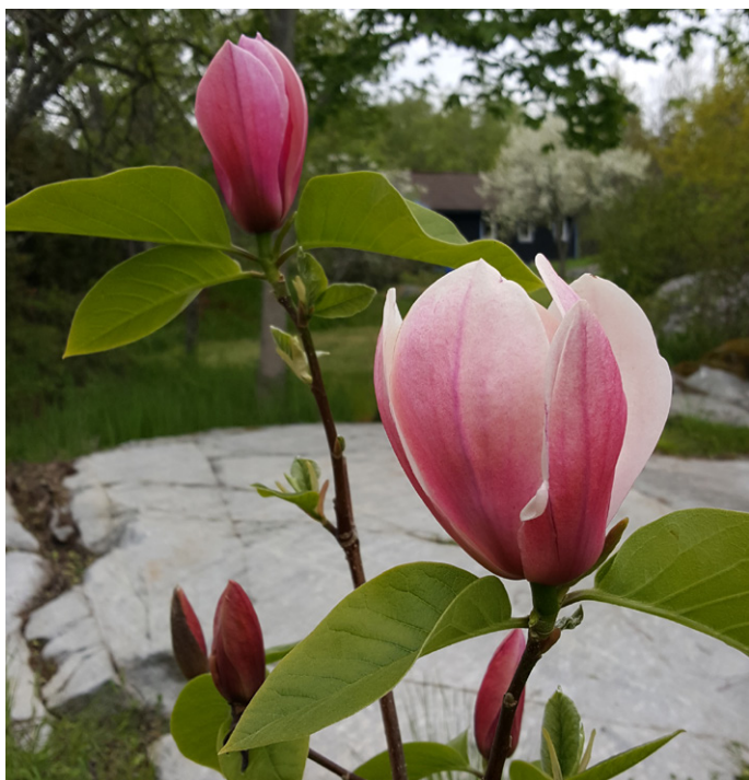
Magnolia 'Rose Marie' Arboretum Lassas Hagar maj 2019

gårdsturen fick det bli nåt' enkelt och snabbt till lunch. Stockholmare – vad annars – är en utmärkt kötttrik och lagom kryddad korv och god tjeckisk öl med annat lämpligt tilltugg.