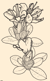
R. Lapponicum C-GA