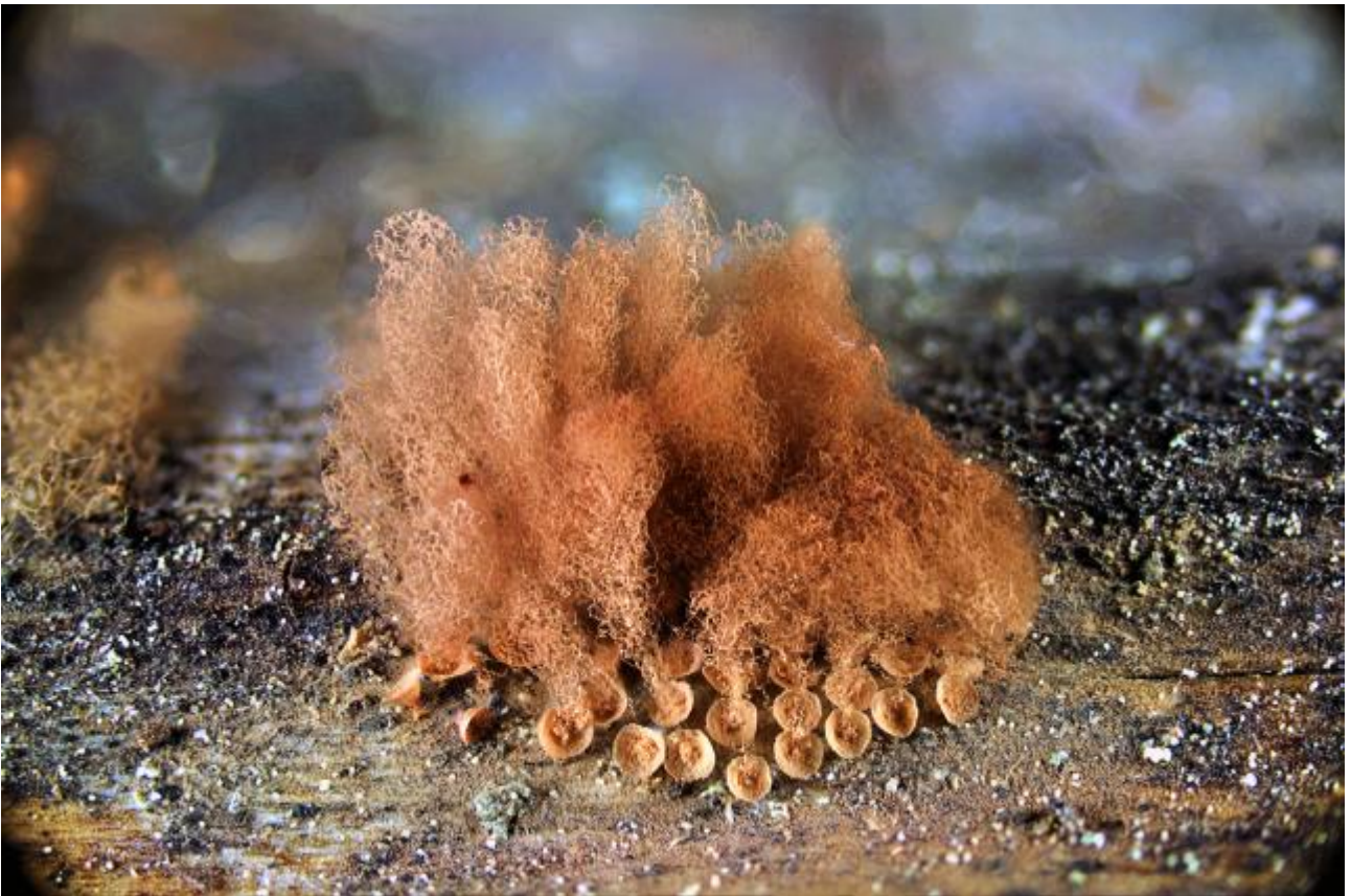
A. Esporocarpos y calículos.