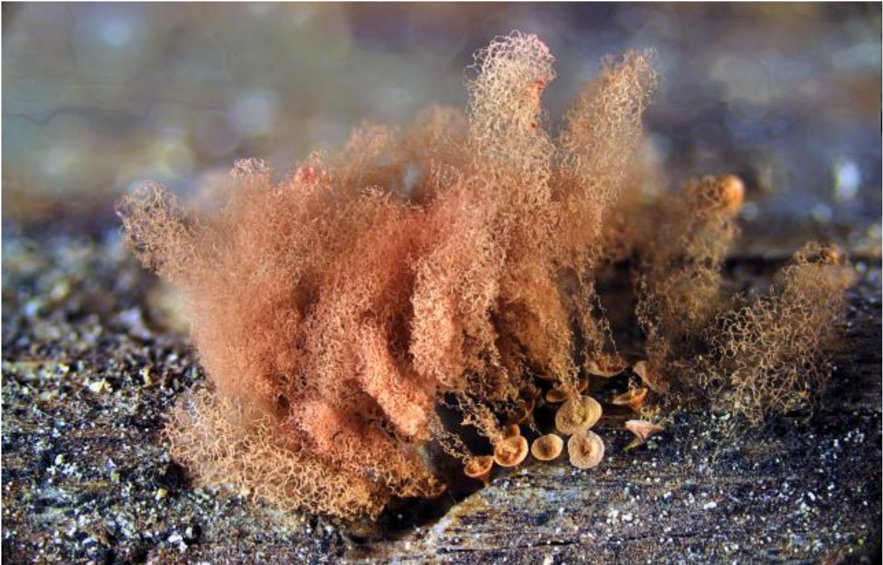
Trichiidae, Trichiida, Lucisporinia, Myxogastrea, Mycetozoa, Amoebozoa, Protozoa

(Pers. ex J.F. Gmel.) Pers., Observ. mycol. (Lipsiae) 1: 58 (1796)