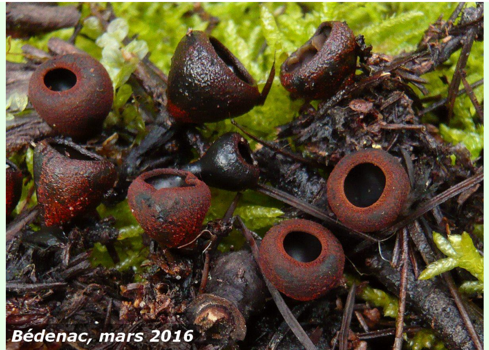
Bédenac, mars 2016