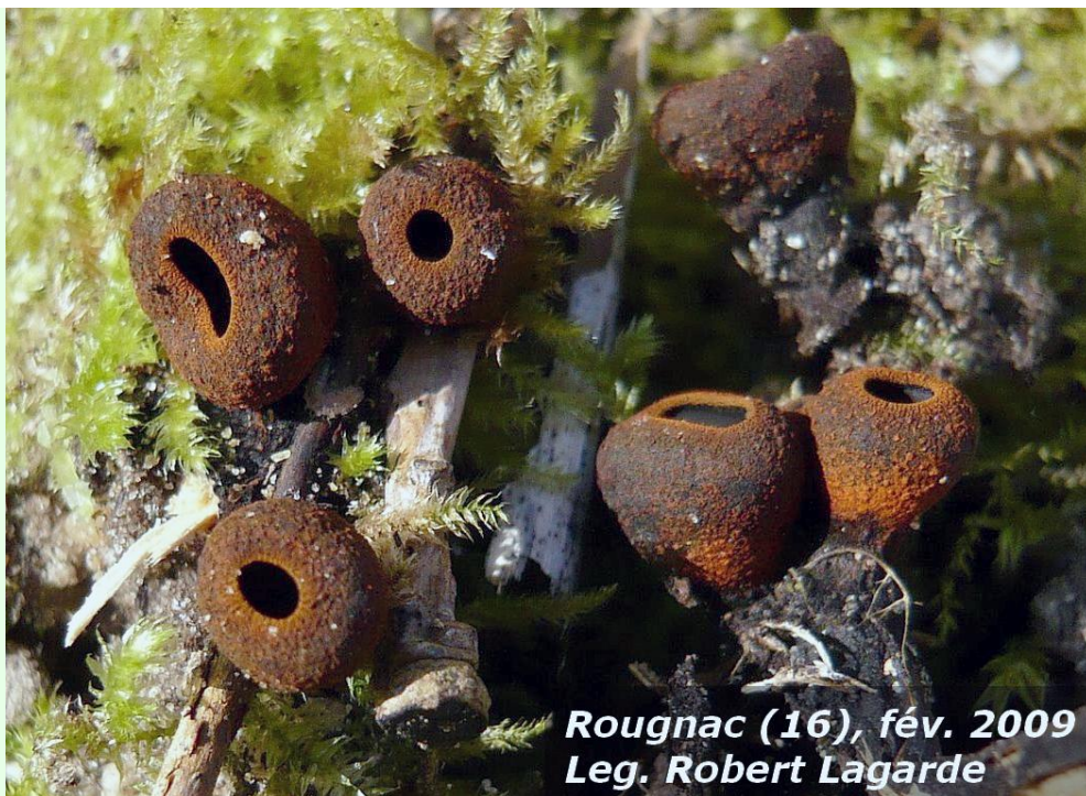
Rougnac (16), fév. 2009 Leg. Robert Lagarde