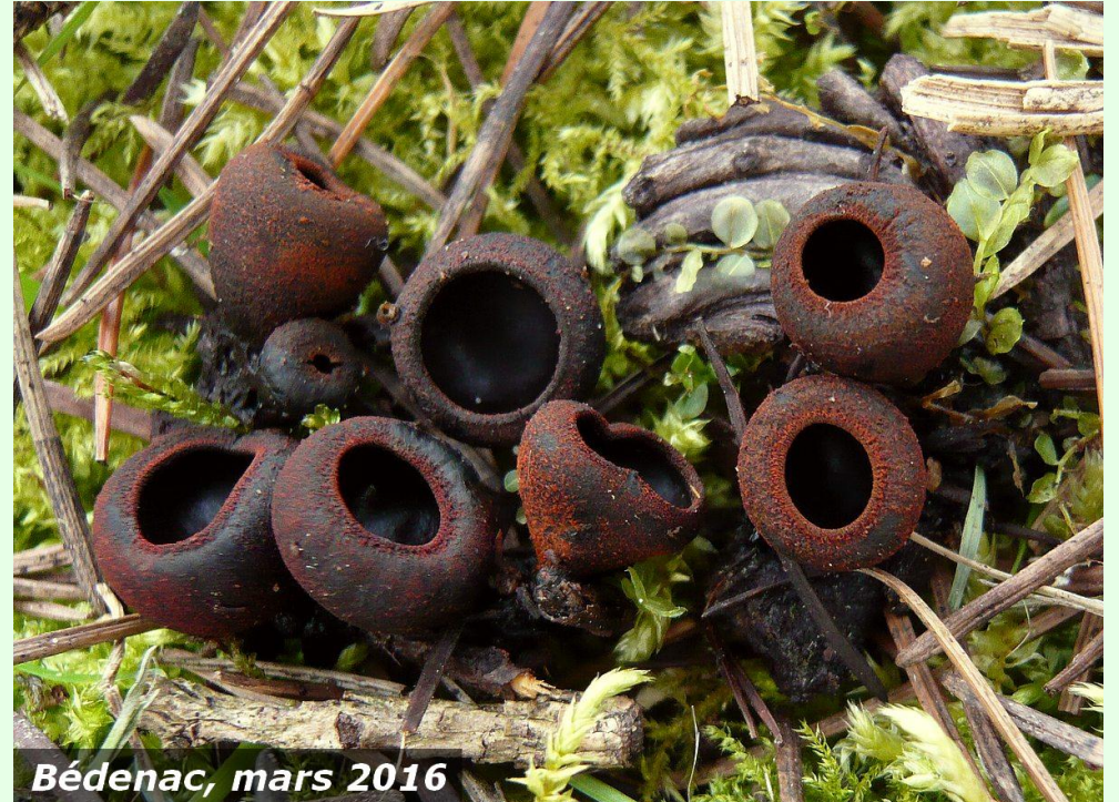
Bédenac, mars 2016