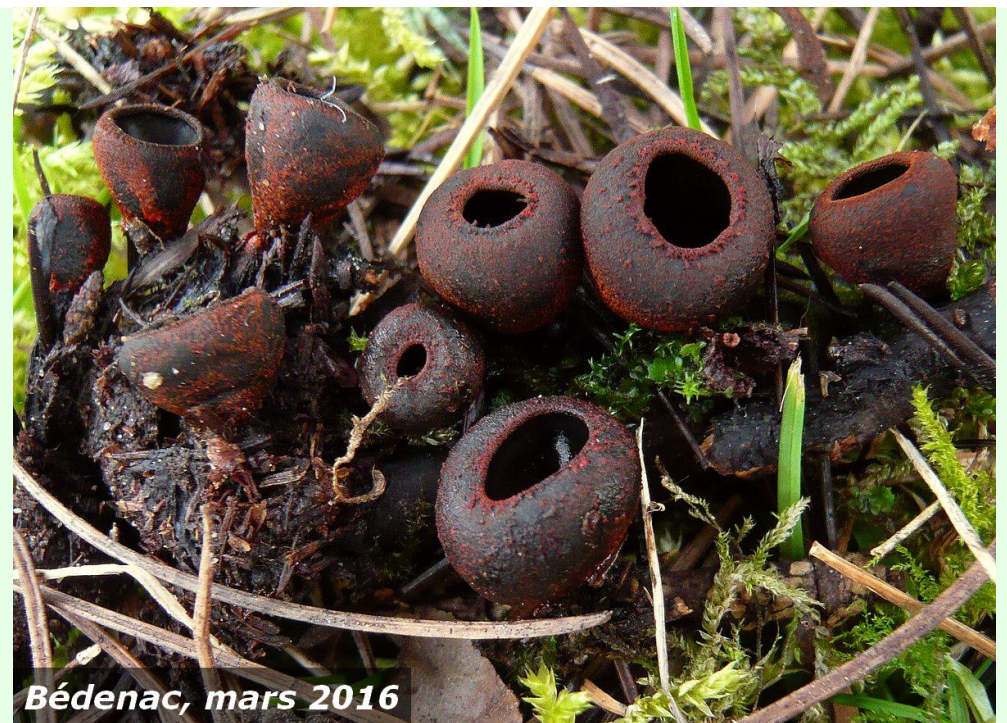
Bédenac, mars 2016