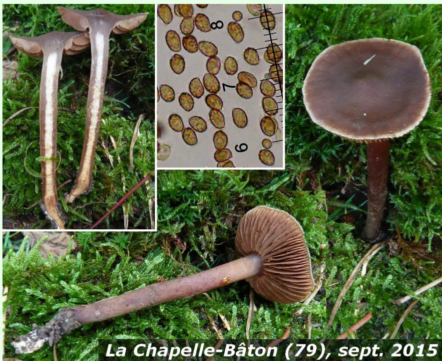
La Chapelle-Bâton (79), sept. 2015