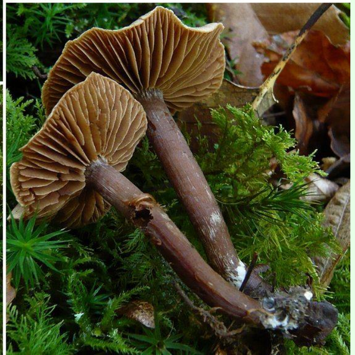
Louzac St André (16), nov. 2016