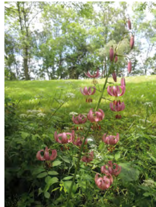
Abb. 14: Lilium martagon , Türkenbundlilie