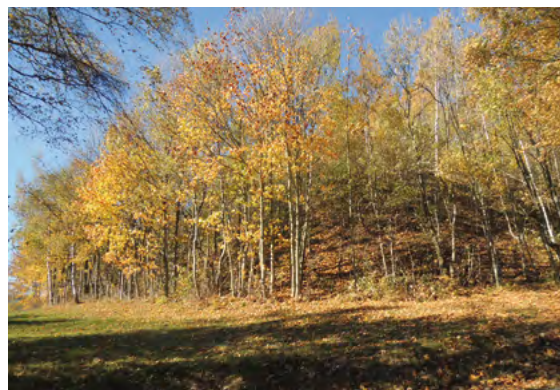
Abb. 8: Malwine, südlicher Haldenteil