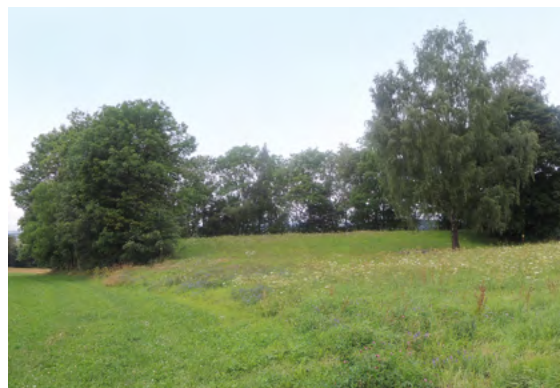
Abb. 5: Halde „Friedrich-August-Treibeschacht“