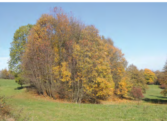
Abb. 4: Halde „Kellerschacht“