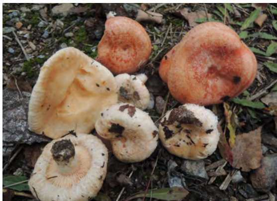
Abb. 19: Lactarius pubescens , Flaumiger Milchling (links) u. Lactarius torminosus , Birken-Milchling (oben)