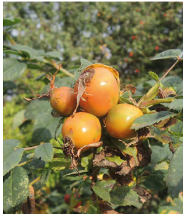
Abb. 13: Rosa caesia , Lederblättrige Rose