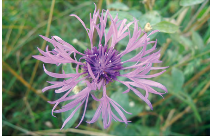
Abb. 11: Centaurea pseudophrygia , Perücken-Flockenblume