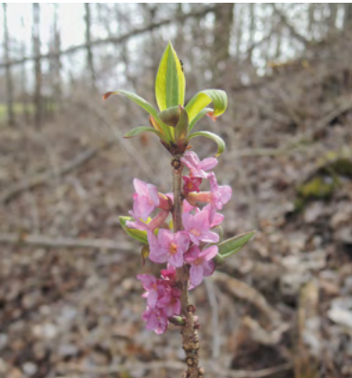
Abb. 12: Daphne mezereum , Seidelbast