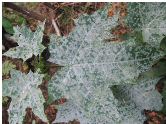
Abb. 25: Sawadaea tulasnei