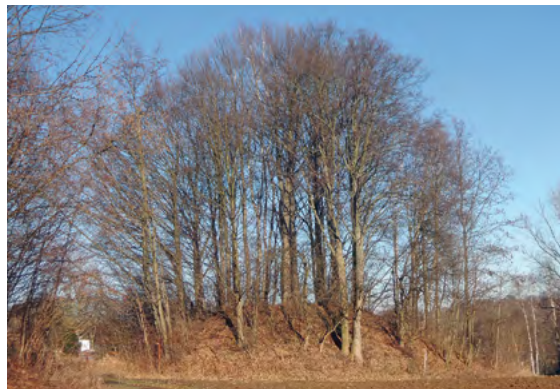
Abb. 3: FND „Hölzerne Staude“ im Winter