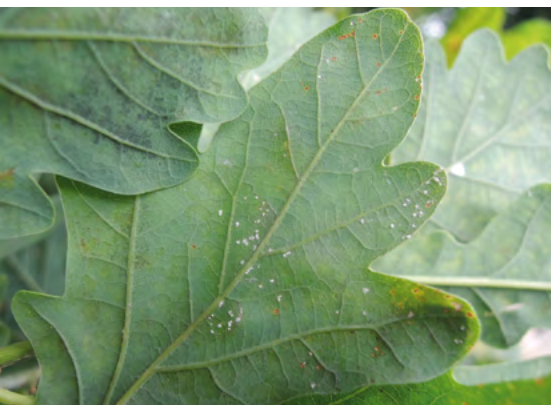
Abb. 24: Microstroma album