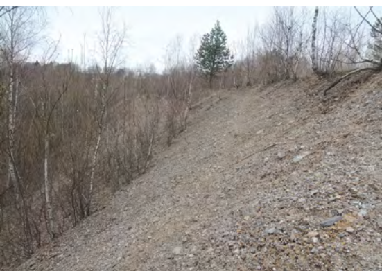
Abb. 9: Malwine, Geröllhang im geplanten Bereich

20: nördlich Halde 9, Altbergbauhalde, inmitten eines Feldes, müsste die Halde der Grube „St. Georg in der Hoffnung“ sein, 16. bis ins 19. Jahrhundert, bewaldet, im mittleren Teil offen bis verbuscht