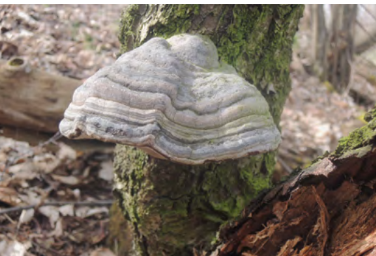
Abb. 16: Fomes fomentarius , Zunderschwamm an Betula