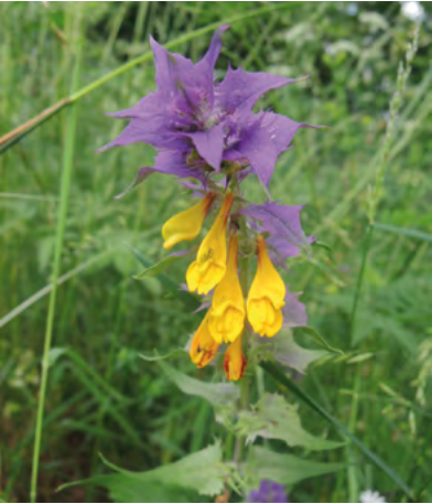
Abb. 10: Melampyrum nemorosum , Hain-Wachtelweizen