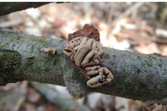
Abb. 22: Encoelia furfuracea , Kleiiger Haselbecher