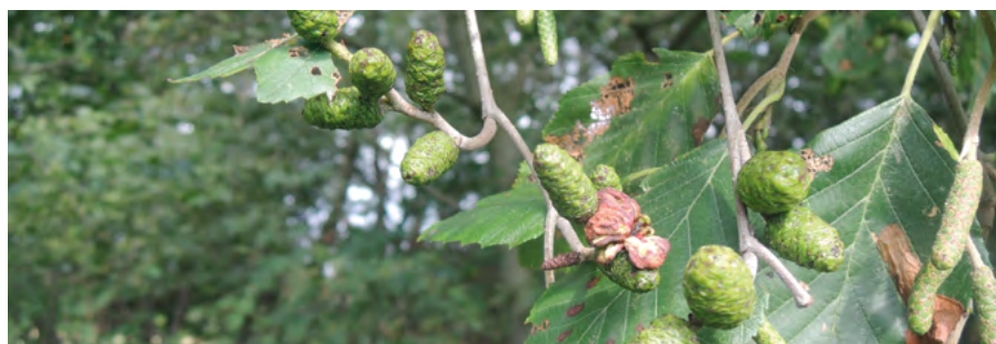
Abb. 26: Taphrina alni