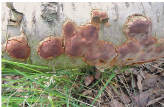
Abb. 17: Fuscoporia contigua , Großporiger Feuerschwamm