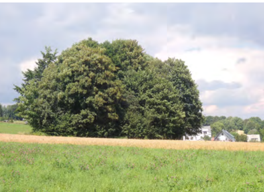
Abb. 2: FND „Hölzerne Staude“ im Sommer