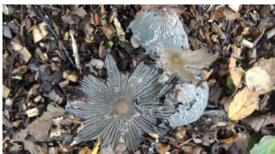
Abb. 21: Coprinopsis lagopus , Hasenpfote