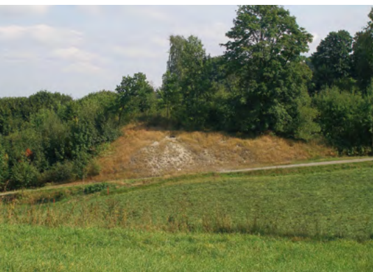
Abb. 6: Halde „Alte Galiläer“