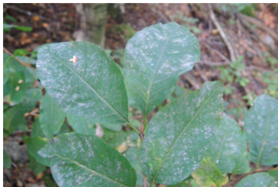
Abb. 23: Erysiphe magnusii