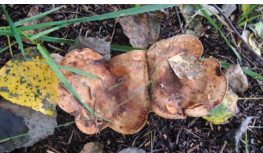
Abb. 20: Paxillus involutus , Kahle Kremplinge in einem Ameisenhaufen