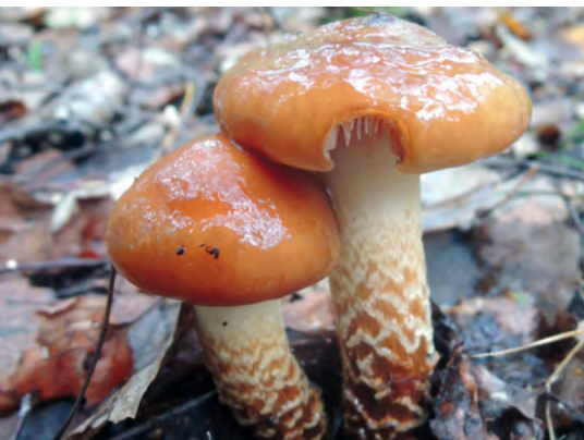
Abb. 18: Cortinarius trivialis , Natternstieler Schleimfuß