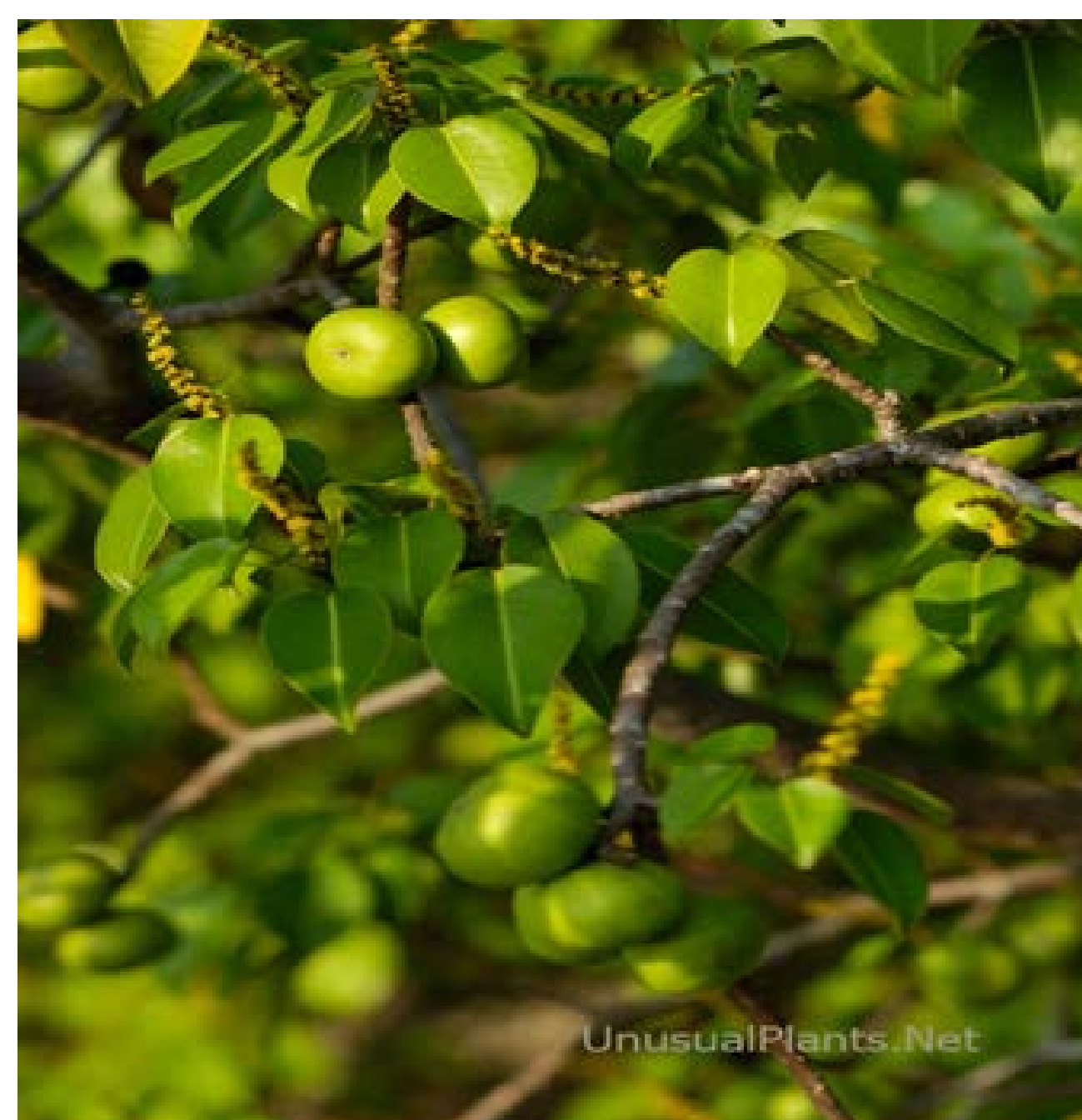
Manchineel, Hippomane mancinella