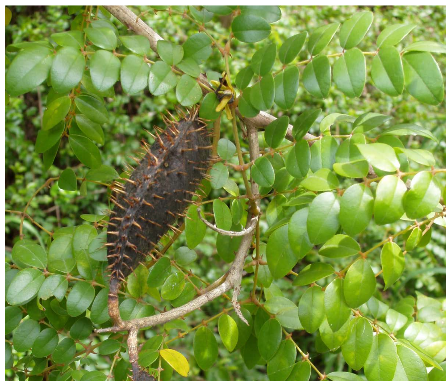
Catch-&-Keep, Caesalpinia cilata

Por favor, ten cuidado con el árbol venenoso manzanillo, Hipómanes mancinella , y el arbusto carrasco, Comocladia dodonea . El contacto puede irritar los ojos o producir reacciones tóxicas en la piel. Otras plantas, tales como el cactus y las acacias, tienen espinas o pelos irritantes. Por favor, evite todo contacto.