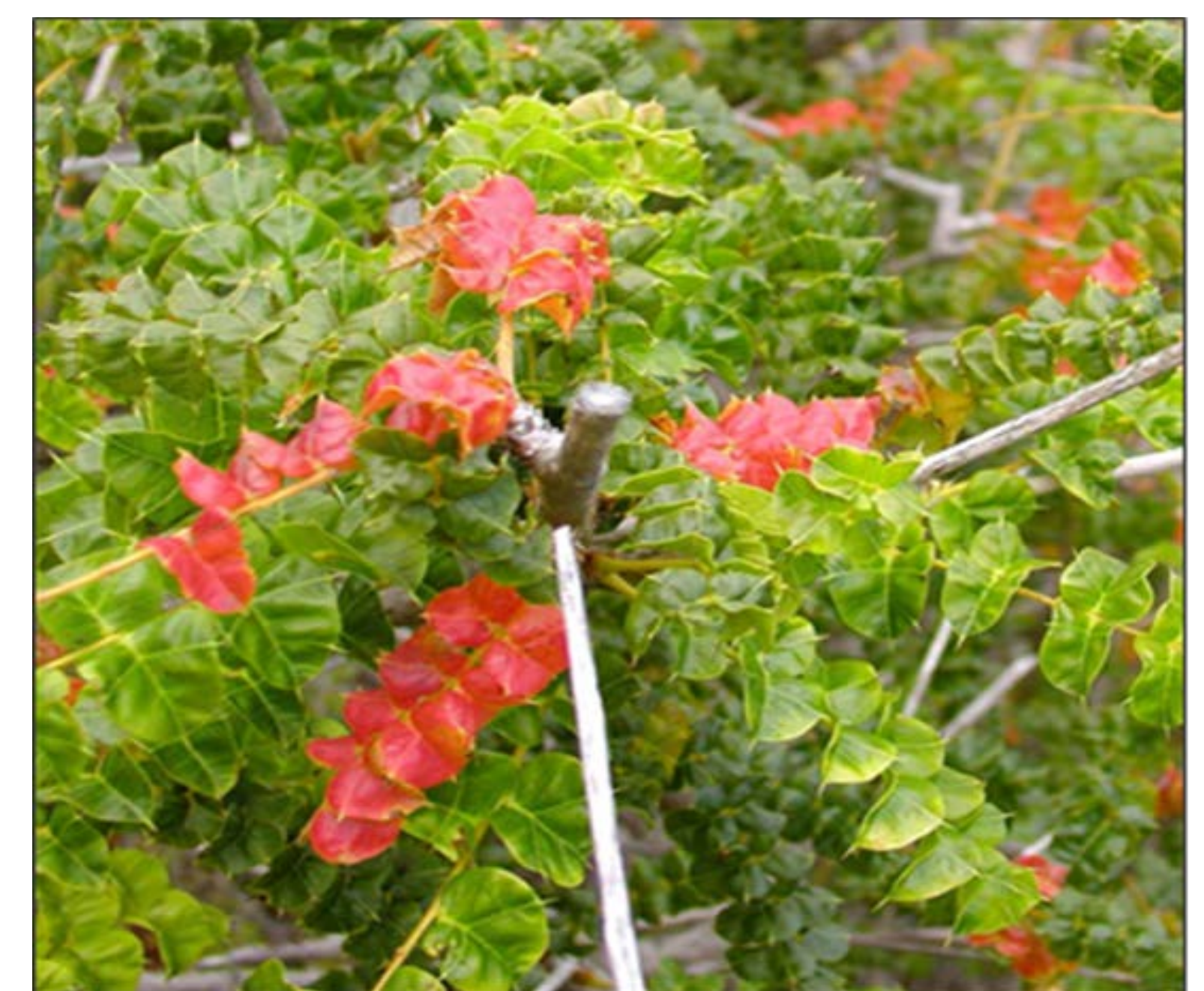
Christmas Bush, Comocladia dodonea