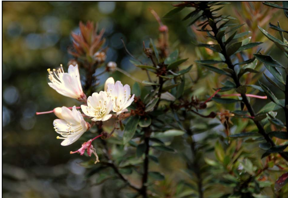
Befaria mexicana . RIQUEZA DE ERICÁCEAS EN EL ÁREA DE LA GEOTÉRMICA