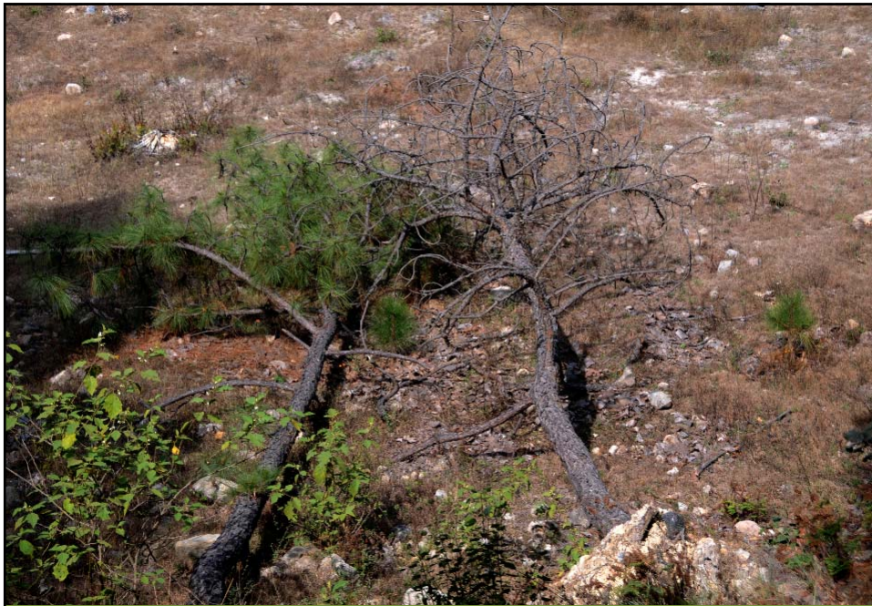
Pinus oocarpa. DESCANCEN EN PAZ