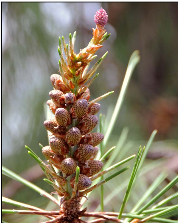
Pinus luzmariae. MADURACIÓN DIFERENCIAL ENTRE ESTRÓBILOS MASCULINOS Y FEMENINO EN LA MISMA RAMA