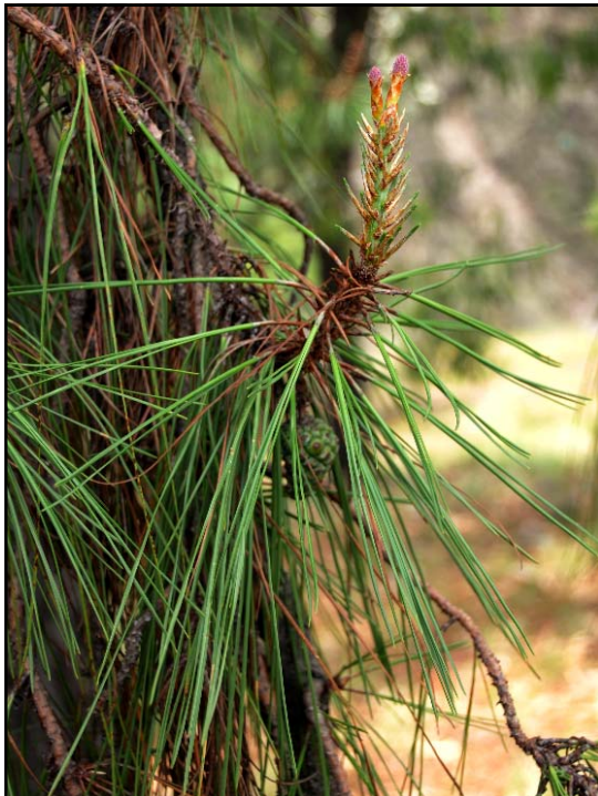
Pinus luzmariae. CONILLOS DE 1 Y 13 MESES