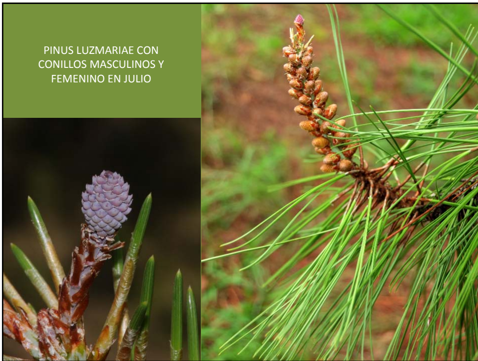
PINUS LUZMARIAE CON CONILLOS MASCULINOS Y FEMENINO EN JULIO