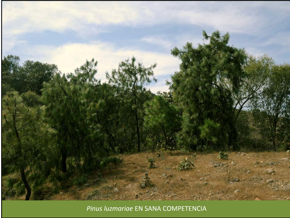
Pinus luzmariae EN SANA COMPETENCIA