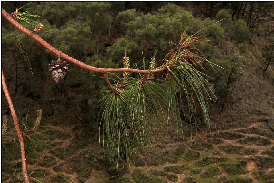
Pinus luzmariae Y SU TRISTE REALIDAD