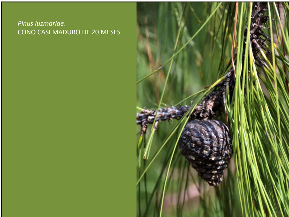
Pinus luzmariae . CONO CASI MADURO DE 20 MESES