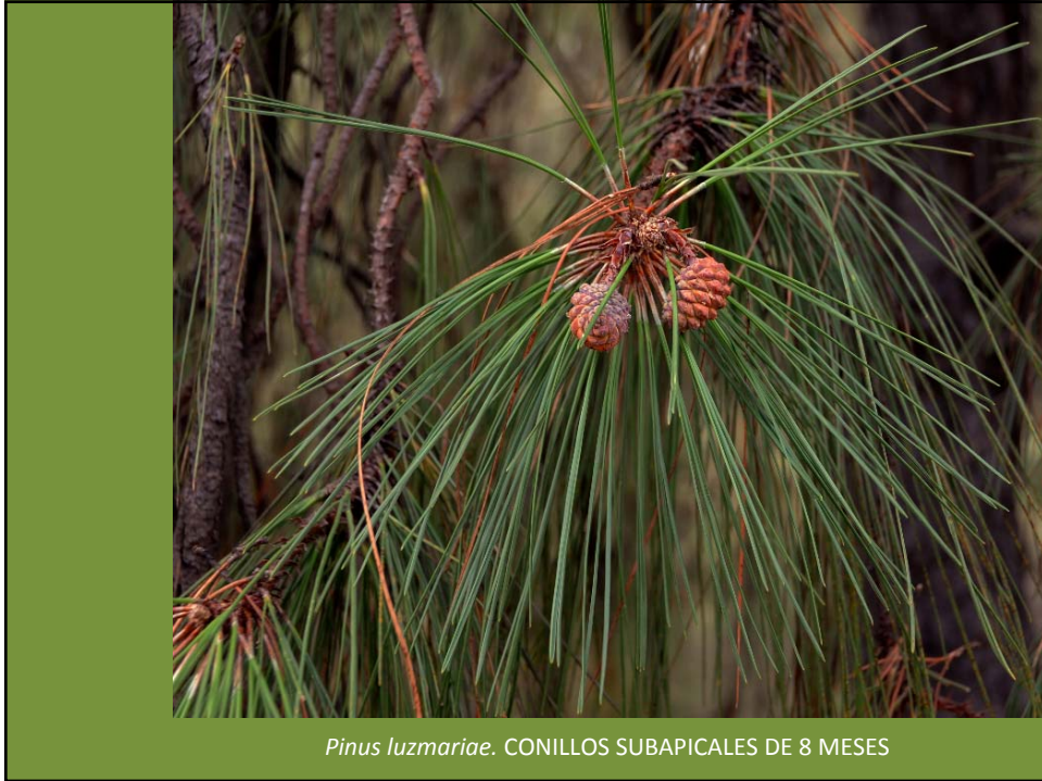
Pinus luzmariae . CONILLOS SUBAPICALES DE 8 MESES