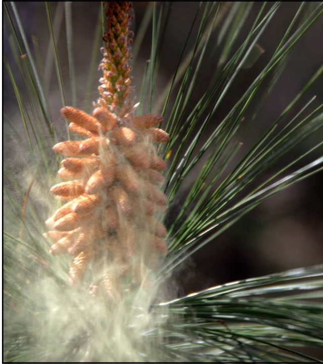
Pinus oocarpa. ESTRÓBILOS MASCULINOS EN PLENA POLINIZACIÓN