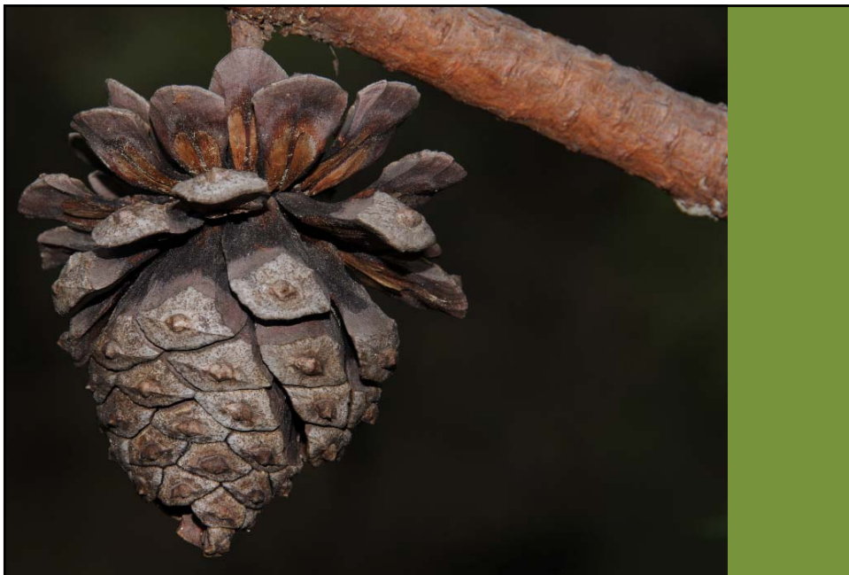
Pinus luzmariae . ALTO ÍNDICE DE ESTERILIDAD EN LAS SEMILLAS