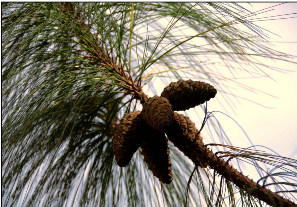
Pinus douglasiana VIGOROSOS