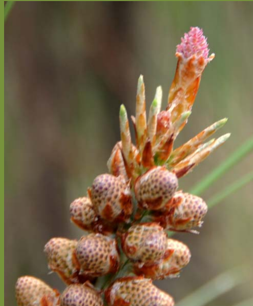
Pinus luzmariae. "ELLA Y ELLOS"