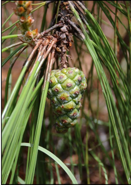
Pinus luzmariae. CONO DE 12 MESES