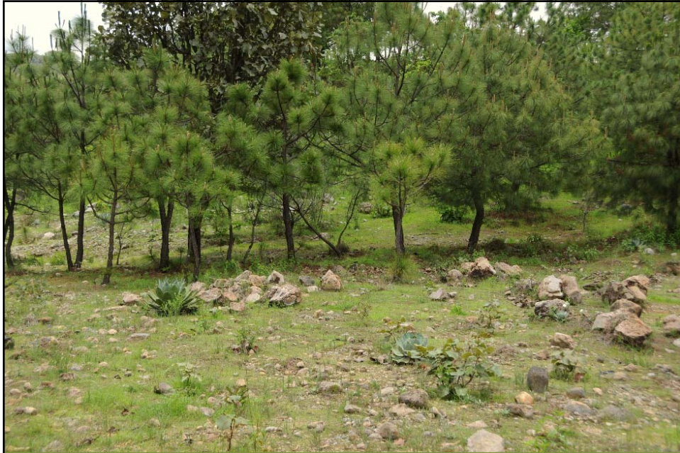
Pinus douglasiana , LOS GORRONES EN LA FIESTA