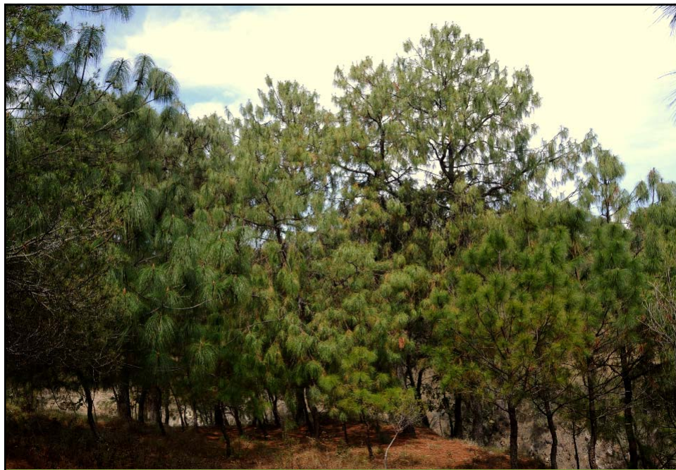
Competencia entre pinos nativos y exóticos. Pinus luzmariae , P. douglasiana y P. radiata (?)