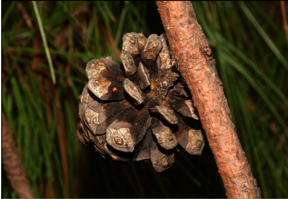
Pinus luzmariae . ESCAMAS BASALES CAEDIZAS