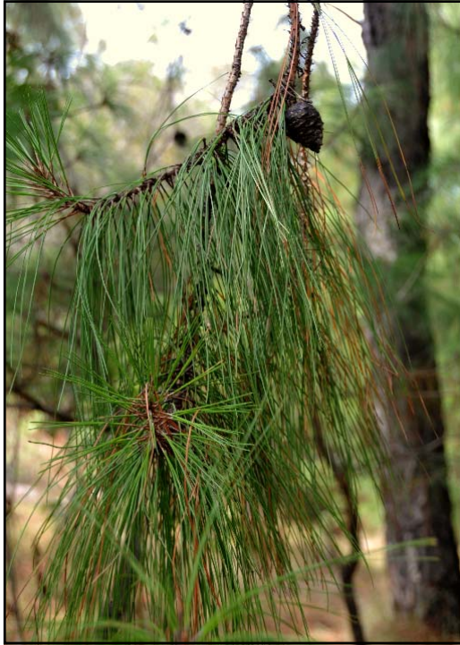
Pinus luzmariae . EVOLUCIÓN A DESDÉN DE LOS MORTALES