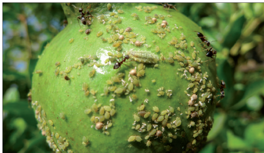
Pulgones y depredador

Los nematodos en el granado han sido relativamente poco estudiados, si se comparan con los trabajos realizados en otros cultivos. Las raíces de los árboles de granado son parasitadas por algunos nematodos (Bello, 1984), principalmente especies polífagas y