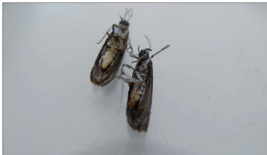
Adultos de Cryptoblabes gnidiella .

El pulgón amarillo verdoso del granado ( A. punicae ) afecta principalmente a flores y frutos en