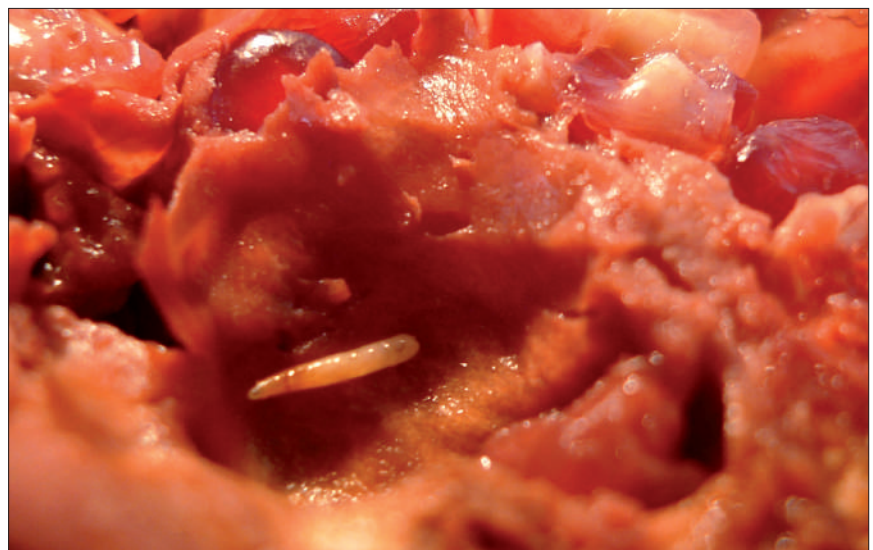
La mosca de la fruta, Ceratitis capitata , larva.

En el cultivo del granado hay citados más de 150 artrópodos fitófagos en el ámbito mundial, por lo que debe extremarse la precaución en la importación incontrolada de frutos y de plantones procedentes de otras zonas, que puede favorecer la aparición de nuevas plagas que afecten al cultivo en España. En India (Balikai y col., 2011) hay citadas más de 95 especies de insectos como dañinas en el granado, destacando como más perjudiciales la mariposa del granado, Virachola (= Deudorix ) isocrates (Fabricius), cuya larva perfora la piel y se introduce en el fruto; la mosca blanca, Siphoninus phyllireae (Haliday) y el barrenador de la corteza, Indarbela tetraonis (Moore). En Turquía, el mayor productor de granadas en la Cuenca del Mediterráneo, se consideran plagas fitófagas del granado más de 90 especies (Ozturk y Ulusoy, 2009), principalmente de los órdenes Homoptera (34), Coleoptera (12) y Hemiptera (11);