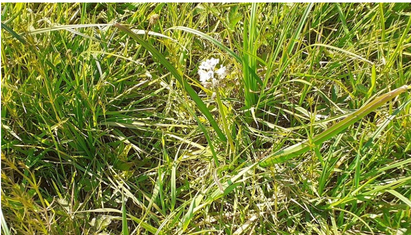
La Jacinthe de Rome, dans la zone humide de la Gimone