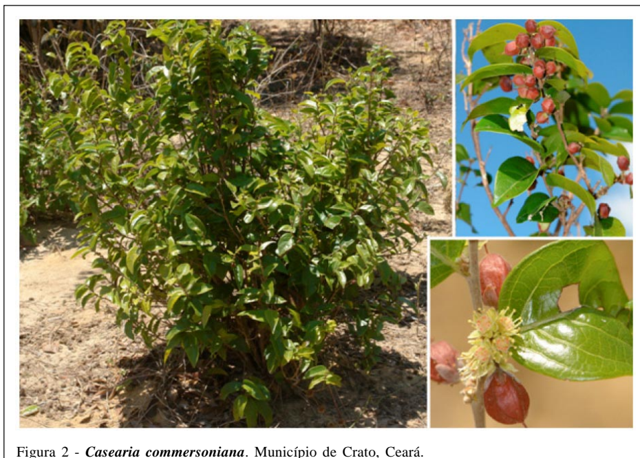
Figura 2 - Casearia commersoniana . Município de Crato, Ceará.