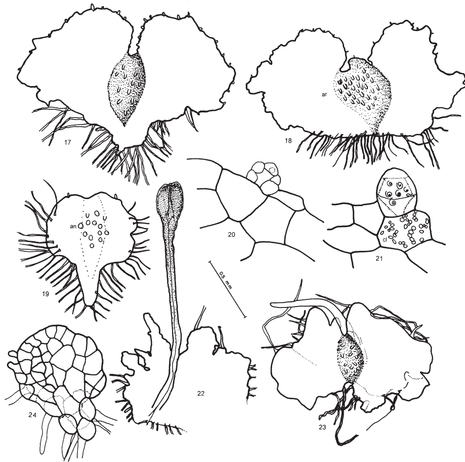
Figs. 17-24. Protalos maduros. Fig. 17. Cordiforme. Fig. 18. Reniforme. Fig. 19. Oval. Figs. 20-21. Anteridios. Figs. 22-23. Esporofitos incipientes, 135 días. Fig. 24. Gametofitos de 40 días diferenciándose por acción de anteridiógenos. an. Anteridios; ar. Arquegonios; cl. Cloroplastos.