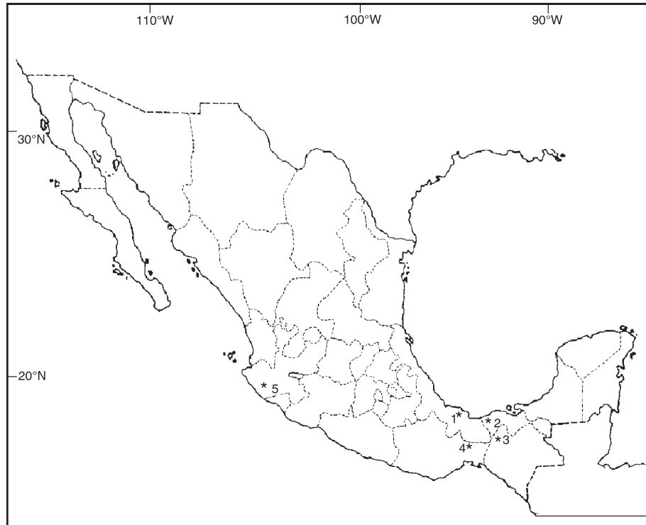
Fig. 1. Distribución conocida de Desmopsis trunciflora . 1. Los Tuxtlas, Veracruz. 2. Municipio de Huimangillo, Tabasco. 3. Reserva El Ocote, Chiapas. 4. Los Chimalapas, Oaxaca. 5. Municipio de Casimiro Castillo, Sierra de Manantlán, Jalisco.