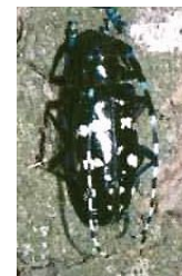
Adulto de A. glabripennis .

Anoplophora glabripennis (Motschulsky) es la especie más conocida del género, ha sido detectada en 1996 en Estados Unidos (Nueva York y Chicago), el año 2001 en Austria (Braunau an Inn), el año 2003 en Canadá (Vaughan), Francia (Gien) y Polonia y el año 2004 en Alemania (Bayern).