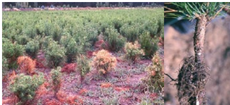
Seto de P. radiata afectado por F. circinatum

mente especies del género Pinus y Pseudotsuga , provocando canchales con abundante resina, en tallos de plantas y troncos y ramas de árboles, a los cuales causa la muerte. Es originario de América del Norte y Central, desde donde se ha dispersado a Haití, Sudáfrica, Japón y España.