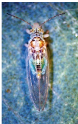
Adulto de G. brimblecombei

Glycaspis brimblecombei es un insecto originario de Australia que se ha introducido en Estados Unidos, México y Brasil, en localidades con climas templados y tropicales.