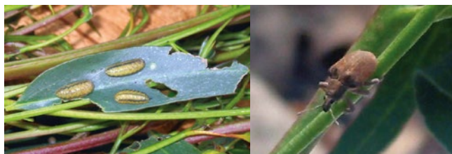
Larva y adulto de G. scutellatus .

Plaga exclusiva del género Eucalyptus y originaria de Australia, desde donde se ha dispersado hacia Nueva Zelanda, varios países de África y Europa, Argentina, Brasil, Chile, Uruguay y EE.UU.