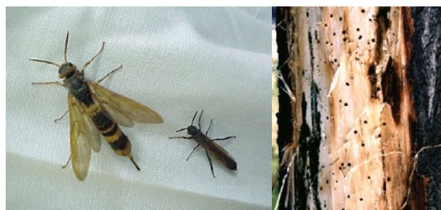
Hembra y macho de T. fuscicornis y orificios de emergencias.

Insecto originario de Asia y Europa oriental, se ha introducido en Australia y Chile. Afecta principalmente