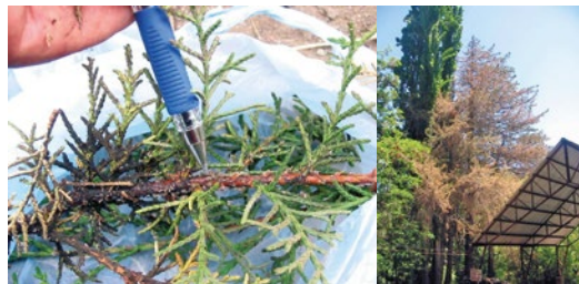
Izq.: Colonia de C. cupressi ; der.: árbol de C. macrocarpa atacado por el pulgón, Los Andes, V Región

En Chile se detectó por primera vez en la localidad de Pica en la I Región, a mediados del año 2003, afectando árboles de Cupressus sempervirens .