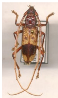
Adulto de P. recurva

Este insecto está asociado al género Eucalyptus y originario de Australia y Papúa - Nueva Guinea, desde donde se ha dispersado a Nueva Zelanda, Sudáfrica, Zambia, Malawi, Norte de África, Península Ibérica, Estados Unidos, Argentina y Uruguay.