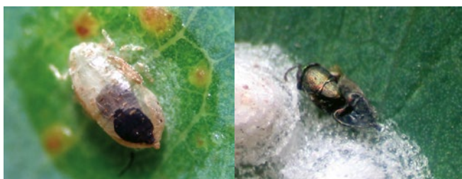
Ninfa parasitada y adulto de P. bliteus

A la fecha se ha confirmado el establecimiento del parasitoide en la totalidad de las regiones afectadas, sin embargo los niveles de parasitismo han sido variables, con valores que llegan hasta el 85 %. Se estima que en un período más prolongado el parasitoide logrará niveles más homogéneos de control de las poblaciones de la plaga.