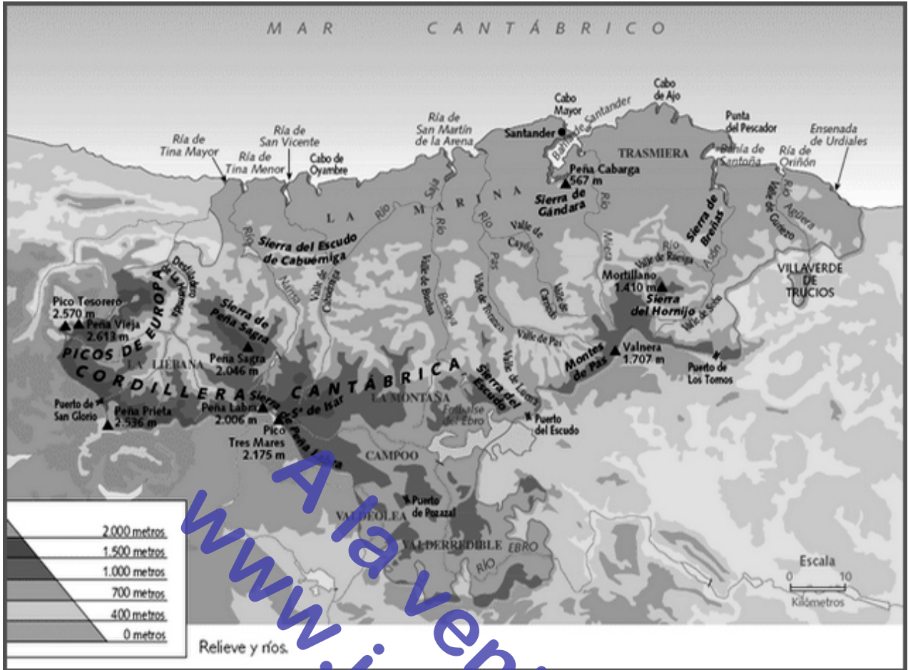
Mapa físico hipsométrico de la comunidad autónoma de Cantabria.

en Liébana y sierra del Cordel), y cuarcitas (Pechón).