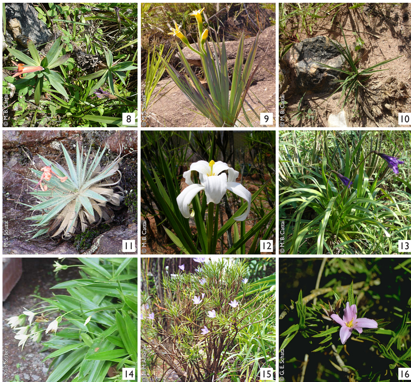
Figuras 8 a 16: Gêneros descritos para Velloziaceae. 8: Aylthonia sp. 9: Barbacenia flava 10: Barbaceniopsis sp. 11: Burlemarxia pungens 12: Nanuzia plicata 13: Pleurostima purpurea 14: Talbotia elegans 15: Vellozia epidendroides 16: Xerophyta pinifolia .

sensu Menezes possuem um número de cromossomos exclusivo. A subfamília Vellozioideae sensu Menezes mostrou-se parafilética, tanto no trabalho de Menezes et al. (1994) quanto no de Salatino et al. (2001). Williams (1991) por sua vez, utilizando flavonóides foliares, observou que apenas espécies da subfamília Vellozioideae sensu Menezes (1980A) possuem flavo-