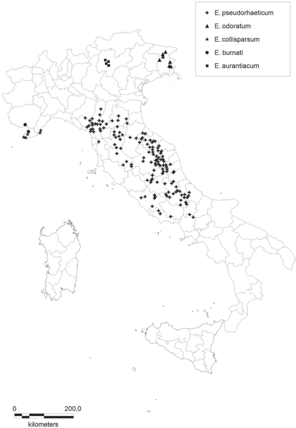
Fig 1: Distribution map of Erysimum aurantiacum (LEYB.) LEYB, E. burnati VIDAL in MAGNIER, E. collisparsum JORDAN, E. odoratum EHRH. and E. pseudorhaeticum POLATSCHEK in Italy.