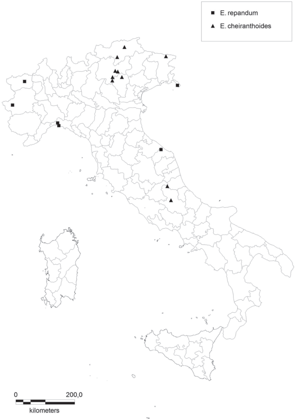
Fig 3: Distribution map of Erysimum cheiranthoides L. and E. repandum L. in Italy.