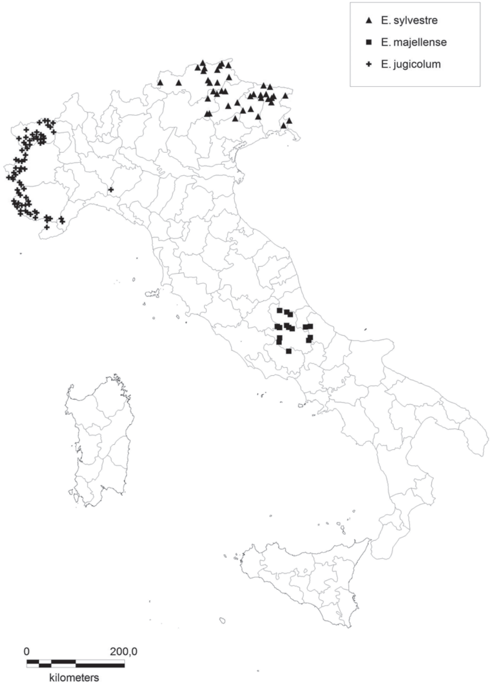
Fig 5: Distribution map of Erysimum jugicolum JORDAN, E. majellense POLATSCHEK and E. sylvestre (CRANTZ) SCOP. in Italy.