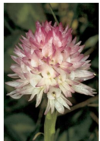
Nigritella lithopolitana , Hochobir (A), 28. 6. 95