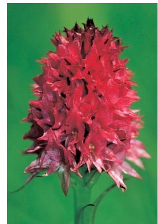
Nigritella dolomitensis , Val da Fanes(I), 14. 7. 89