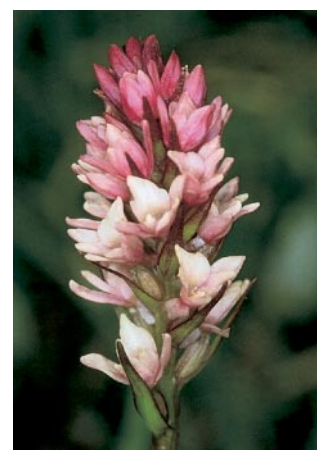
× Gymnigritella heufleri , Schatzalp Davos (CH), 22. 7. 98