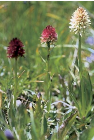
Nigritella rhellicani , Farbvarianten, Pufplatsch (A), 9. 7. 90

TEPPNER & KLEIN (1990) haben festgestellt, dass die alpinen Pflanzen durch ovalen Blütenstand, kleinere Blüten und buchtig gezähnte Brakteenränder merklich von den von Linné beschriebenen skandinavischen Pflanzen abweichen. Jeder wissenschaftliche Name aber bezieht sich auf ein ganz bestimmtes Individuum, auf den sogenannten Holotyp. Wenn dieser nun eine in Schweden vorkommende Pflanze ist, müssen die abweichenden Pflanzen unserer Region umbenannt werden. So taufte TEPPNER & KLEIN (1990) die bei uns heimische Art N. rhellicani , zu Ehren von Johann Müller aus Rellikon am Greifensee, genannt Rhellicanus, der als Erster die Pflanze 1536 in einem Gedicht über eine Wanderung auf das Stockhorn als Christi manus erwähnt.