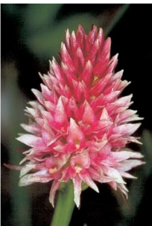
Nigritella stiriaca , Schafberg (A), 5. 7. 95