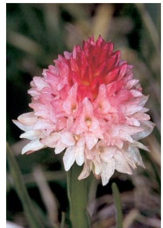
Nigritella corneliana , Col du Galibier (F), 16. 7. 92