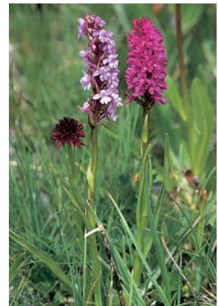
× Gymnigritella suaveolens mit «Eltern» N. rhellicani und Gymnadenia conopsea ; Val Badia, (I), 25. 7. 89