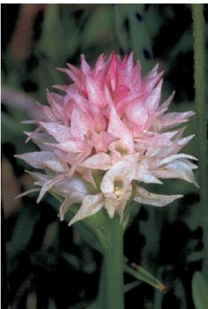
Nigritella widderi , Tauplitzalm (A), 11. 7. 91