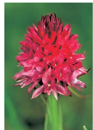
Nigritella rubra , Würzjoch (I), 12. 7. 89