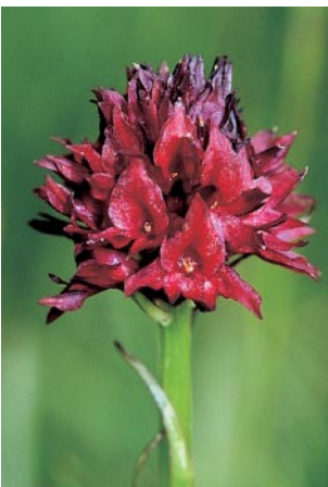
Nigritella austriaca , Seiser Alm (A), 12. 7. 90