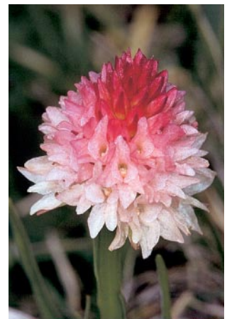
Nigritella corneliana , Col du Galibier (F), 16. 7. 92