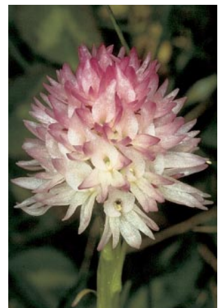
Nigritella lithopolitana , Hochobir (A), 28. 6. 95