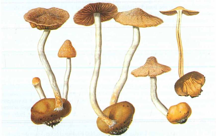
Abb. 8. Psathyrella globosivelata , Körniger Mürling. Brandenburg, Naturschutzgebiet am Ortsrand von Dahlewitz, nährstoffreicher Laubwald an der Berliner Stadtgrenze, 10. Oktober 1992, leg. & Aquarell E. LUDWIG.

Lamellentrama mit braunem, membraninkrustierendem Pigment, Schnallen in allen Fruchtkörperteilen vorhanden.