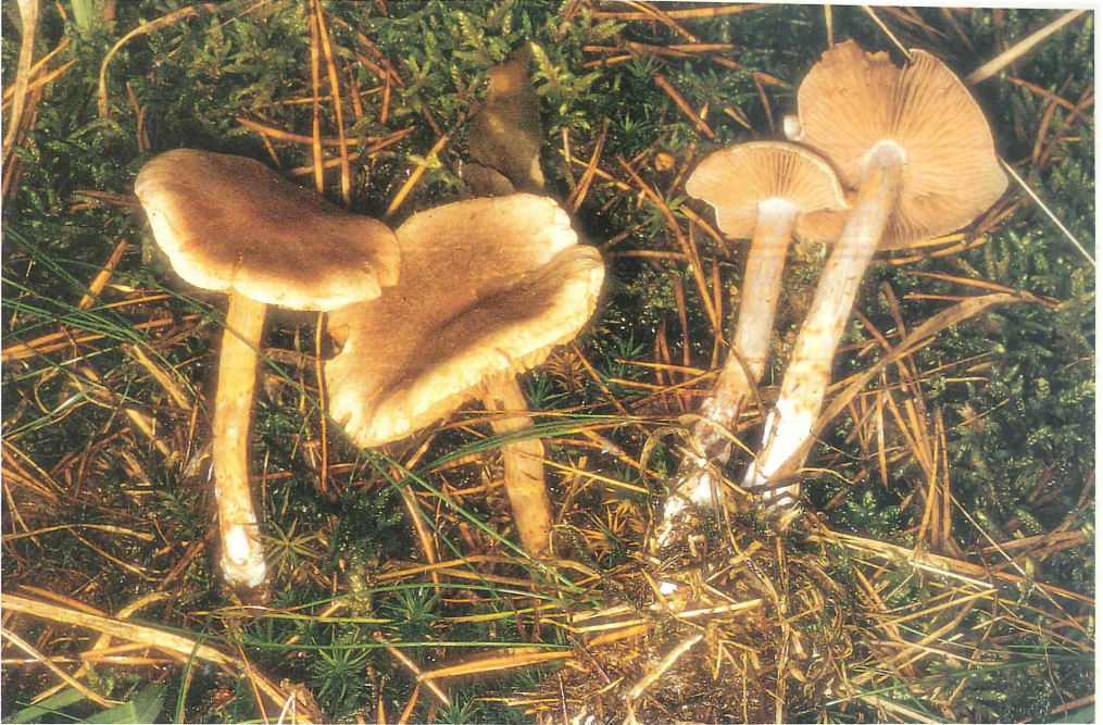
Abb. 3 u. 4: Cortinarius paragaudis vom Mittelberg südlich Remda in Thüringen. Unten: Schnitt, Marginalzellen und Sporen. Balken 2 x 10 µm. Foto und Zeichnung U. LUHMANN.

Hut 4-6,5 cm, jung stark gewölbt, fast halbkugelig, später verflachend mit lange deutlich abgeknicktem Hutrand, oft unre-