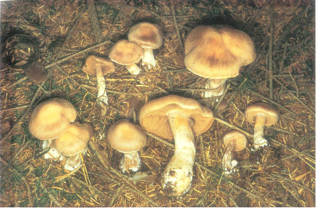
Abb. 1 u. 2: Cortinarius malachus vom Mittelberg südlich Remda in Thüringen. Unten: Schnitt, Marginalzellen und Sporen. Balken 2 \times 10 \mu\text{m} . Foto und Zeichnung U. LUHMANN.

Lamellen gedrängt, ausgebuchtet angewachsen; jung hell graubraun mit violetterem Ton, später graubraun mit etwas hellerer Schneide.