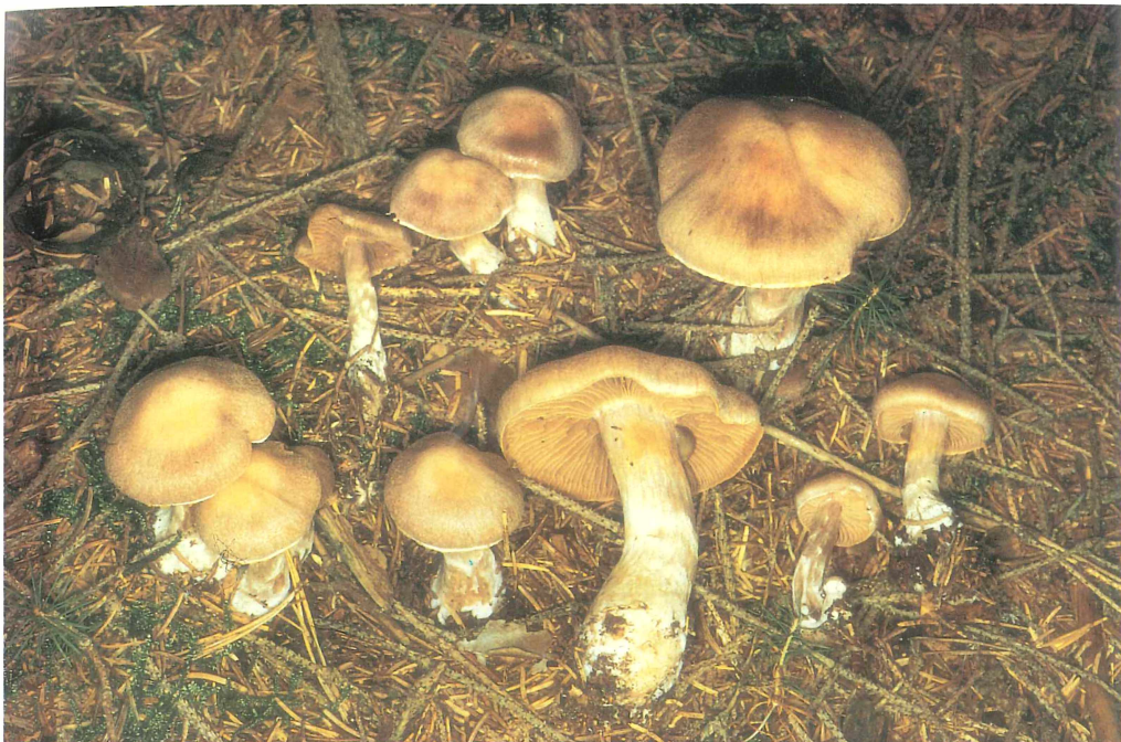
Abb. 1 u. 2: Cortinarius malachus vom Mittelberg südlich Remda in Thüringen. Unten: Schnitt, Marginalzellen und Sporen. Balken 2 x 10 µm. Foto und Zeichnung U. LUHMANN.

Lamellen gedrängt, ausgebuchtet angewachsen; jung hell graubraun mit violetterem Ton, später graubraun mit etwas hellerer Schneide.