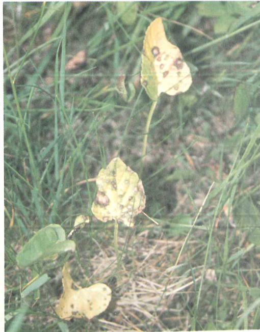
Abb. 3: Befallsbild von Ramularia macrospora an Phyteuma nigrum , Neugrumbach, 1998 (Foto: W. DIETRICH).