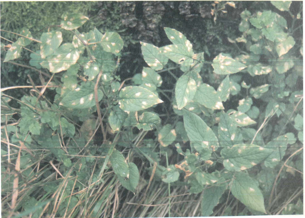
Abb. 1: Befallsbild von Phacellium episphaerium an Stellaria nemorum , SW Crottendorf, 1998.