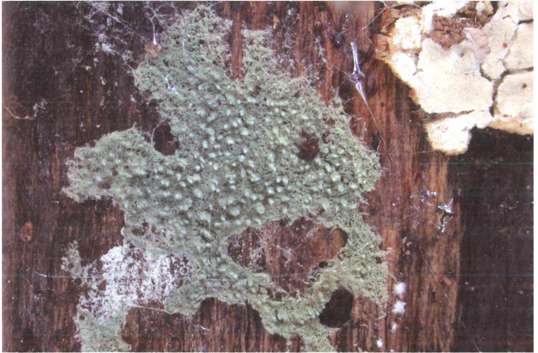
Abb. 2: Amaurodon viridis (ALB. & SCHW.: FR.) J. SCHRÖT. in COHN. Fundort: Teneriffa, Orotavatal südlich von Aguamansa. Der Pilz wuchs zusammen mit Laeticorticium polygonioides (P.KARST.) DONK (im Bild rechts oben) auf dem Wurzelholz von Baumheide ( Erica spec. ).